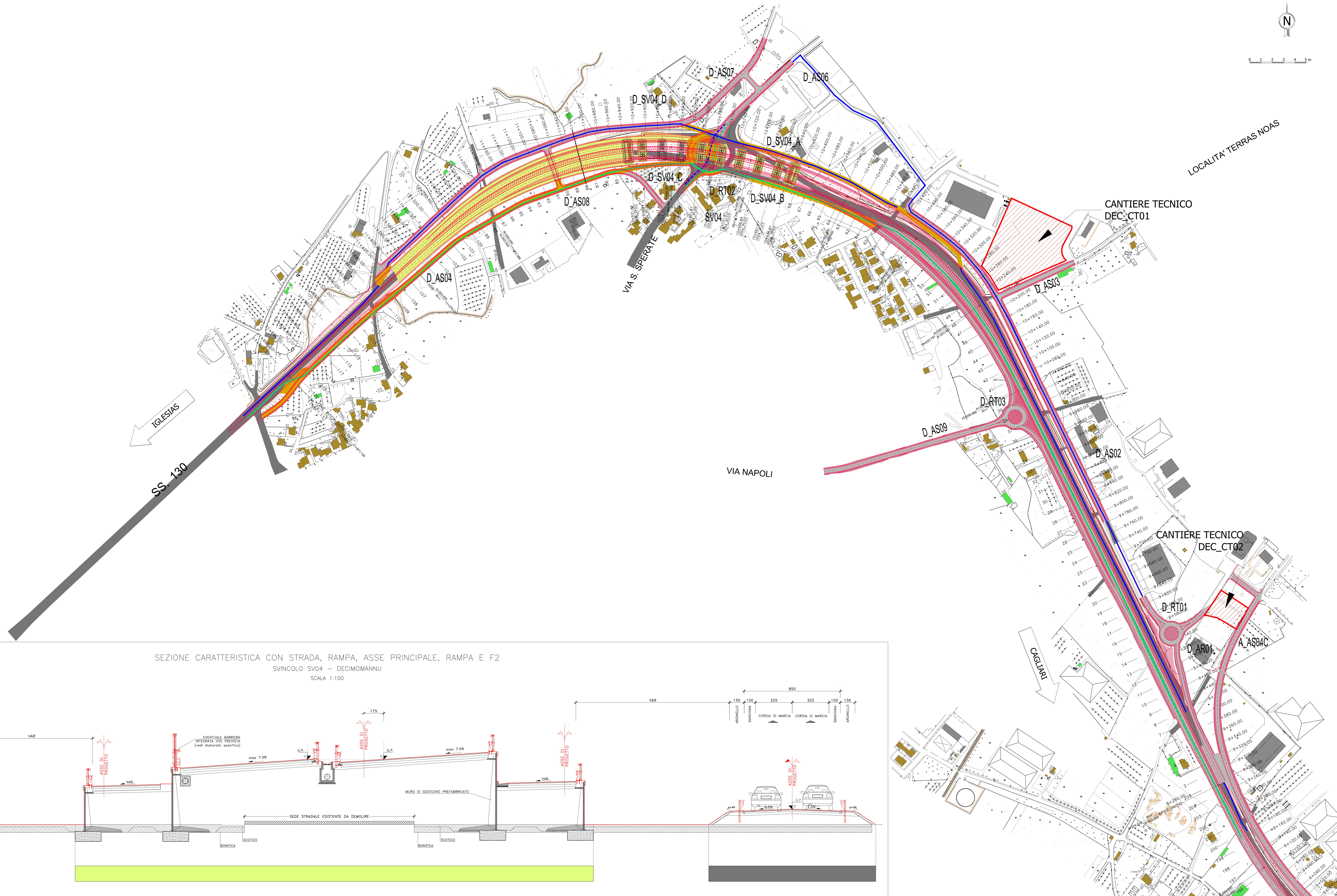
SEZIONE CARATTERISTICA CON STRADA, RAMPA, ASSE PRINCIPALE, RAMPA E F2 SVINCOLO SV04 - DECIMOMANNU SCALA 1:100