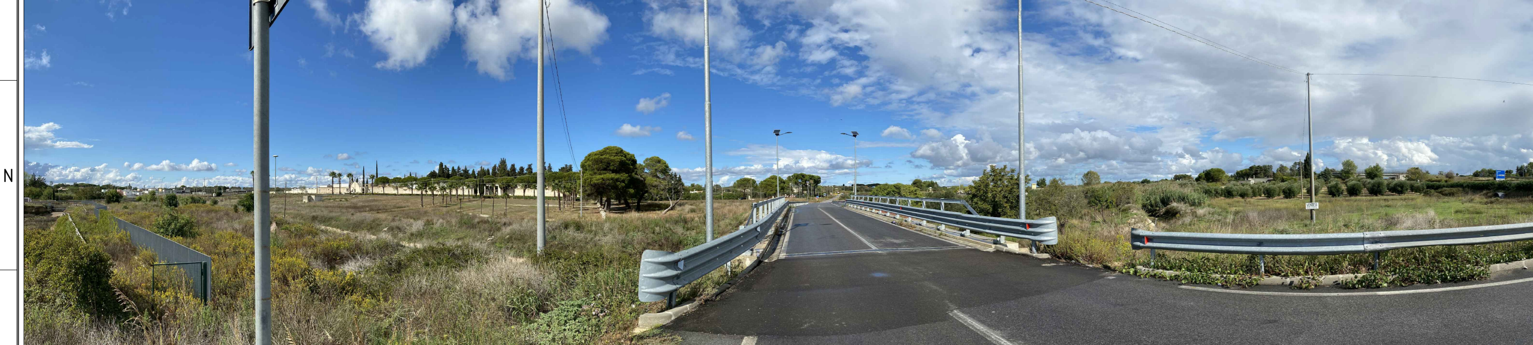
PV 11 da "COMUNE DI LATIANO -STRADA PAESAGGISTICA" FOTO A