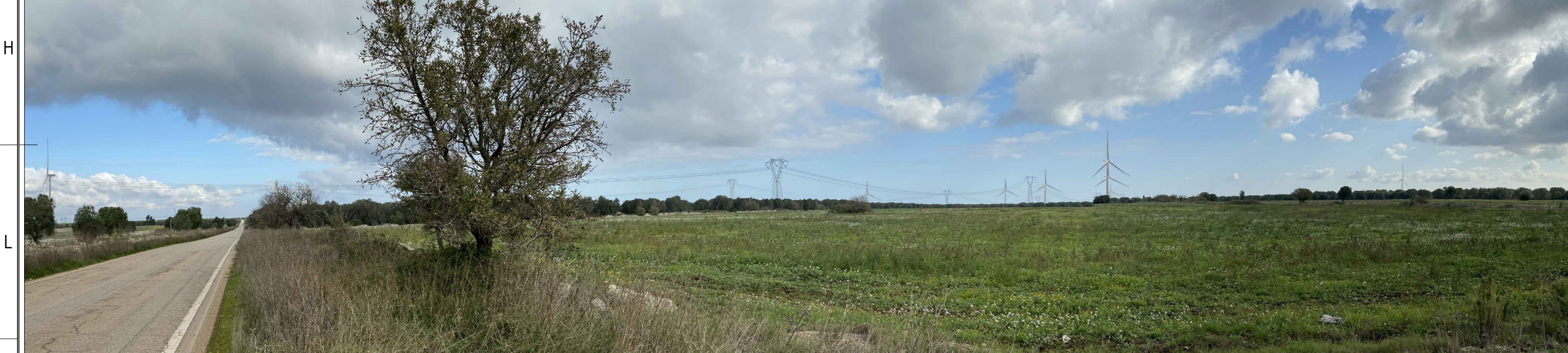
PV 10 da "STRADA PAESAGGISTICA" FOTOSIMULAZIONE C