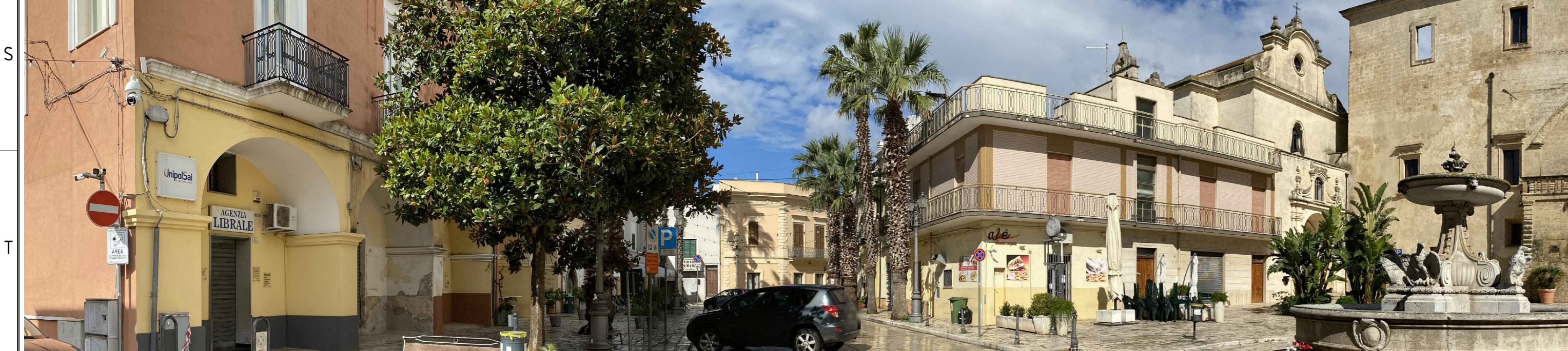
PV 12 da "PALAZZO IMPERIALI" FOTO A