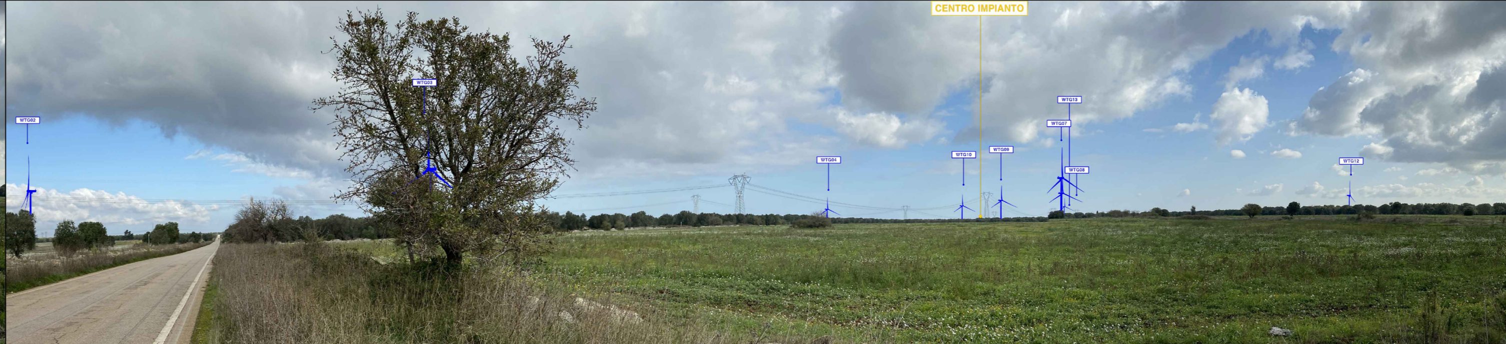
PV 10 da "STRADA PAESAGGISTICA" INDICAZIONI IMPIANTI B