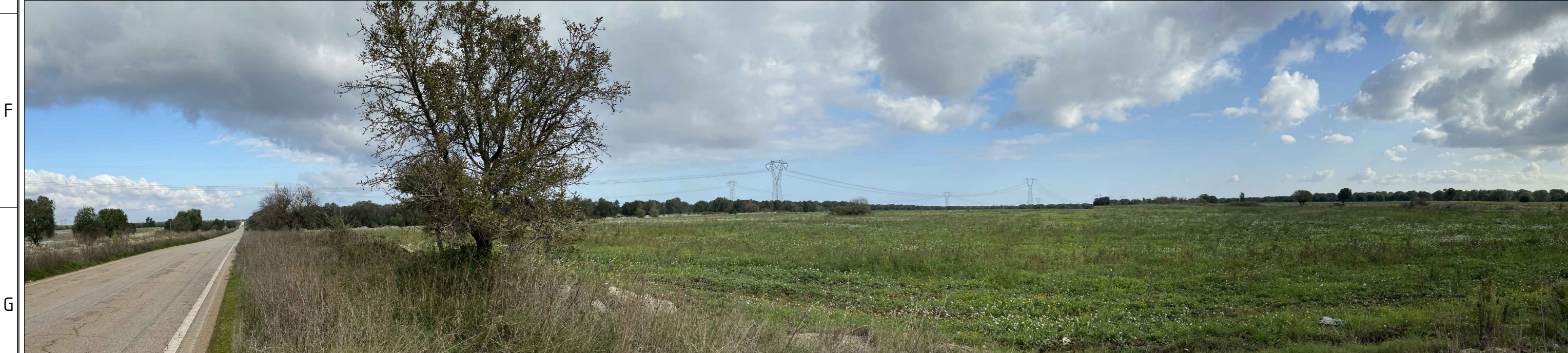
PV 10 da "STRADA PAESAGGISTICA" FOTO A