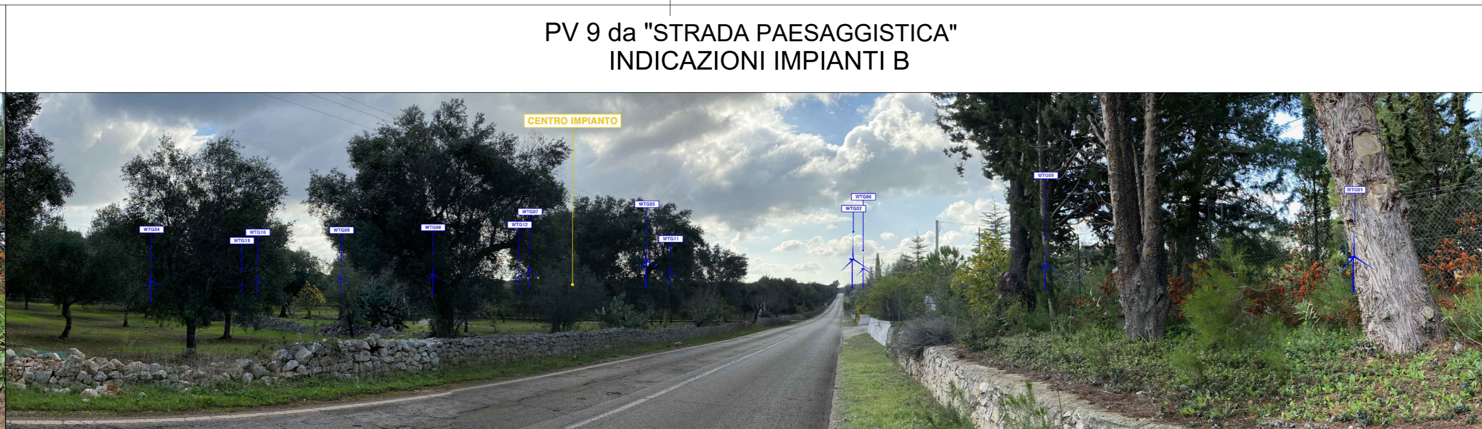
PV 9 da "STRADA PAESAGGISTICA" INDICAZIONI IMPIANTI B