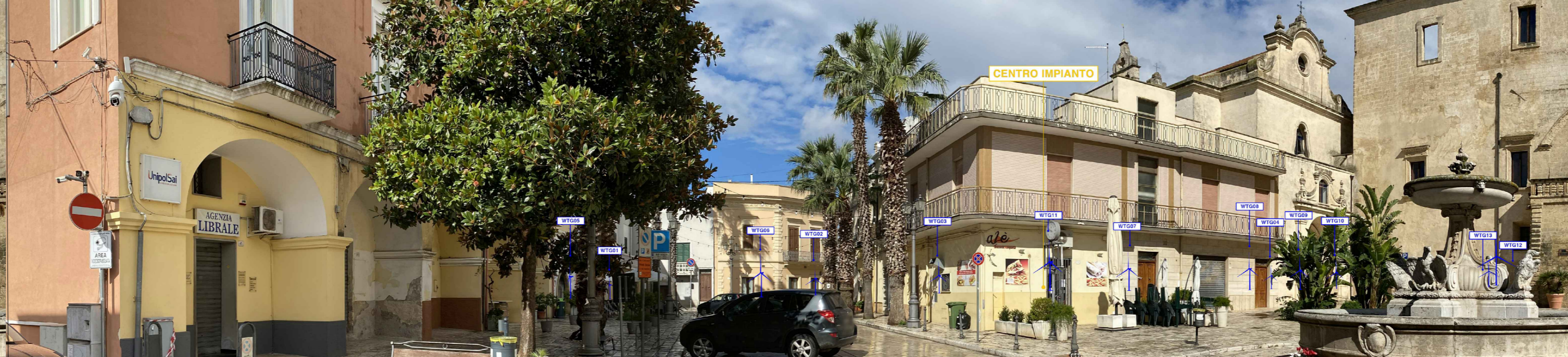
PV 12 da "PALAZZO IMPERIALI" INDICAZIONI IMPIANTI B