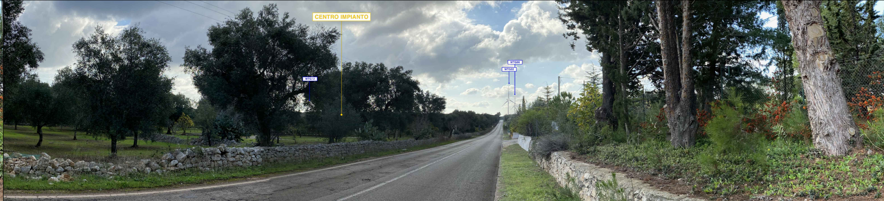
PV 9 da "STRADA PAESAGGISTICA" FOTOSIMULAZIONE D