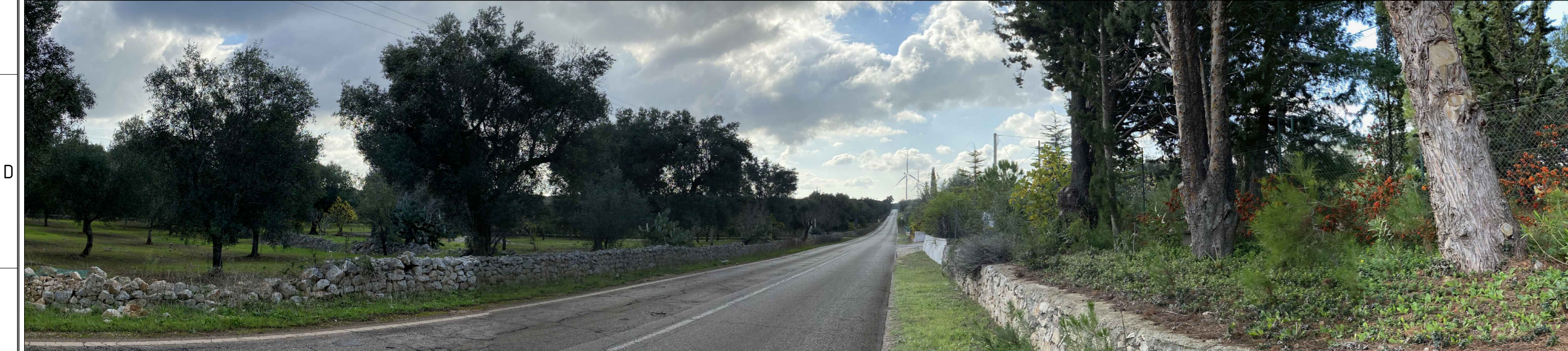
PV 9 da "STRADA PAESAGGISTICA" FOTOSIMULAZIONE C