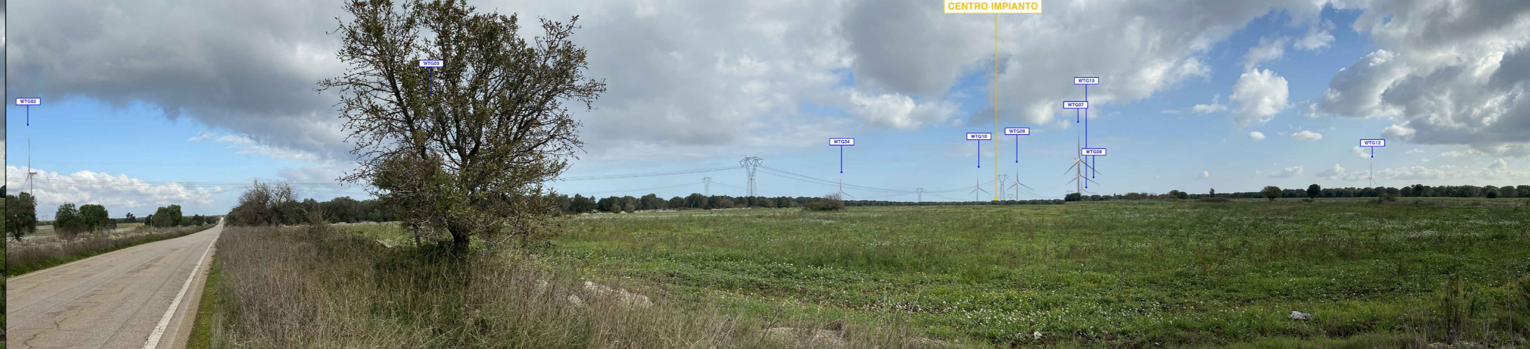
PV 10 da "STRADA PAESAGGISTICA" FOTOSIMULAZIONE D