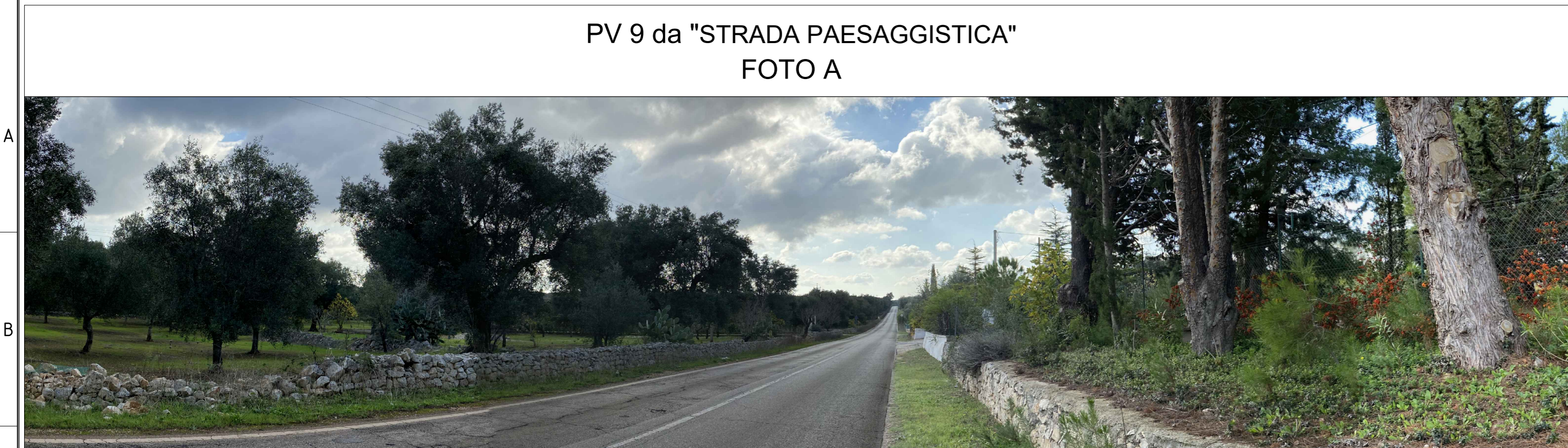
PV 9 da "STRADA PAESAGGISTICA" FOTO A