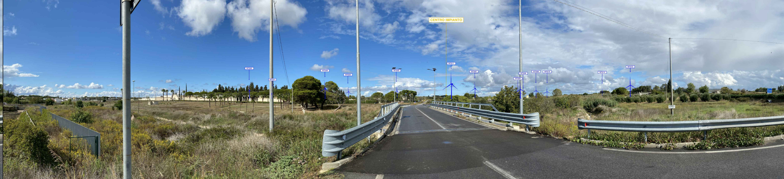
PV 11 da "COMUNE DI LATIANO -STRADA PAESAGGISTICA" INDICAZIONI IMPIANTI B