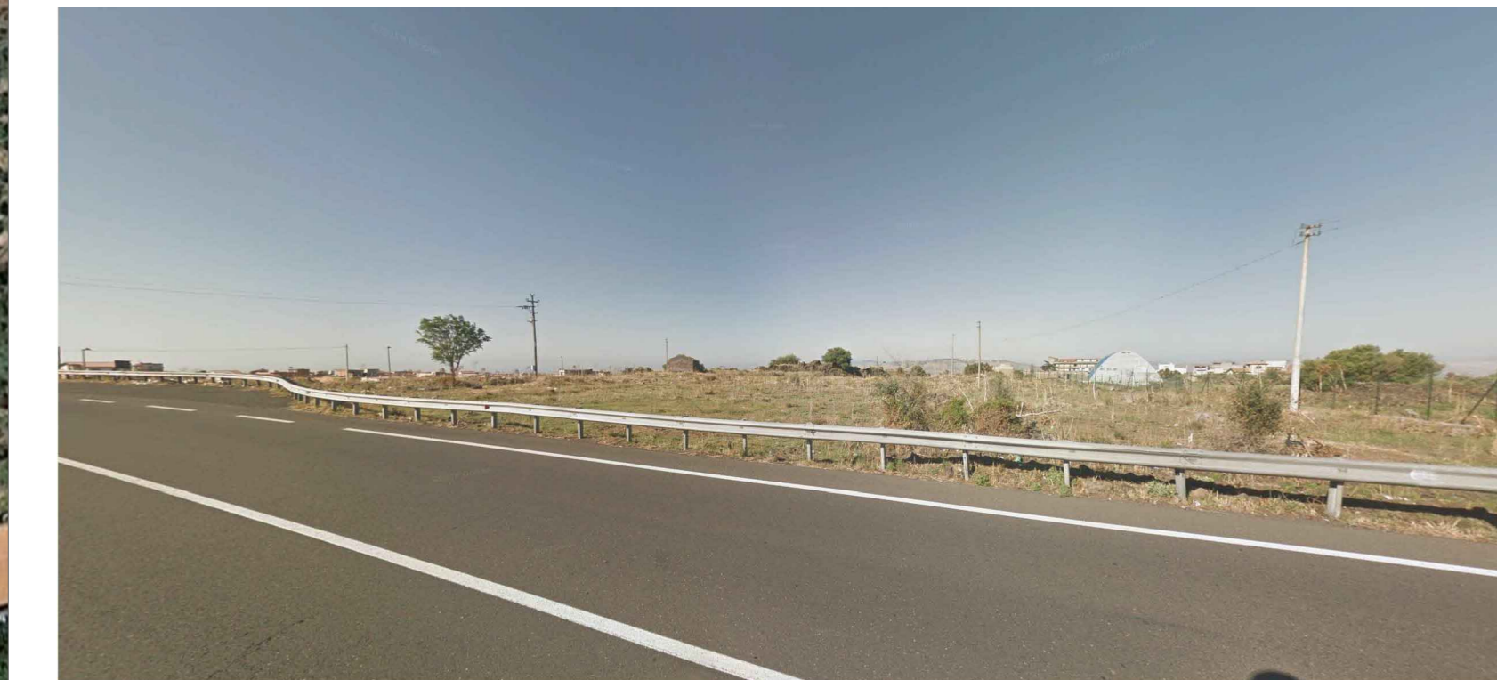
VISTA DELL'AREA DA SS284