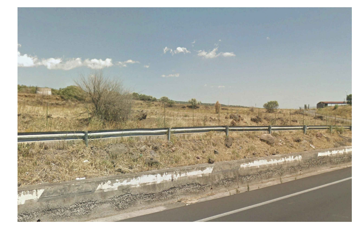
VISTA DELL'AREA DALLA STATALE SS284