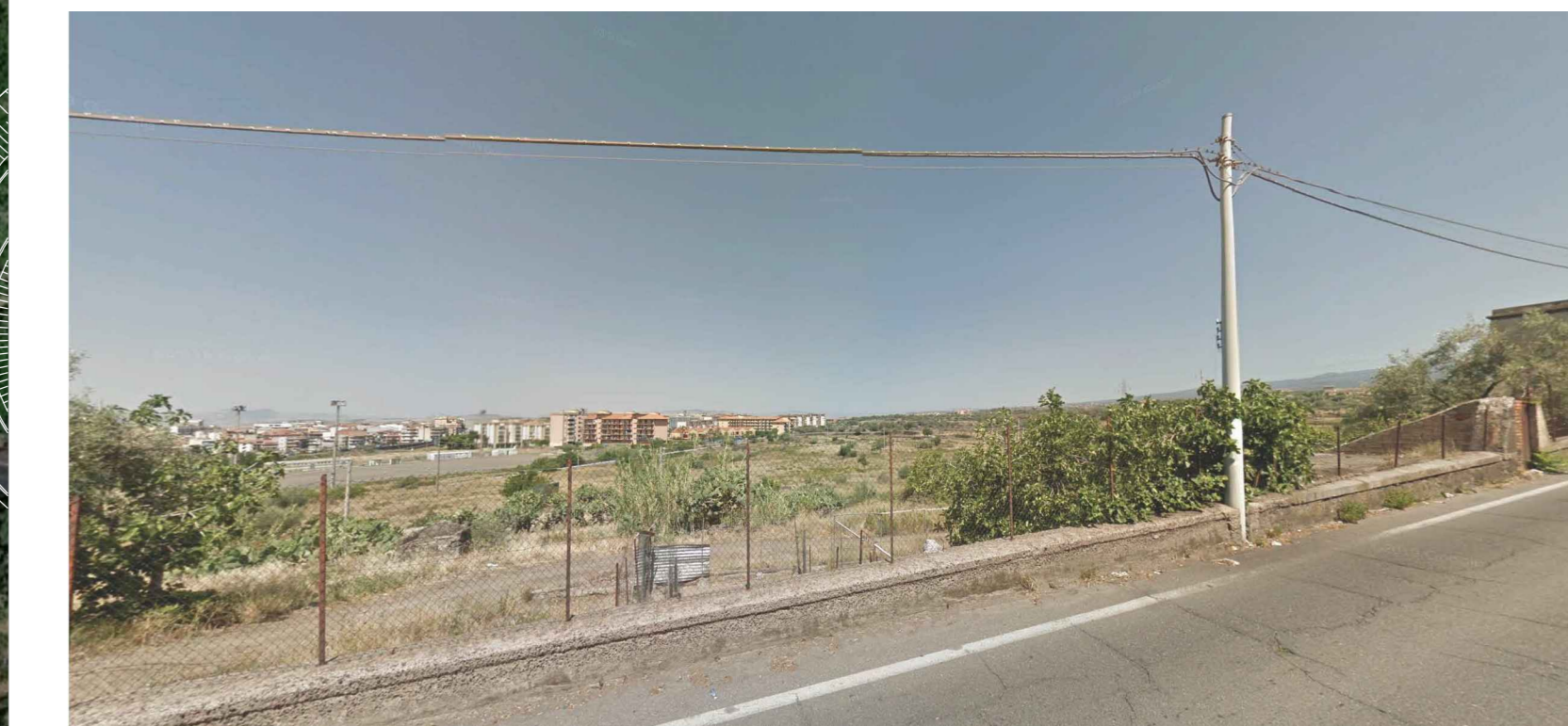
VISTA DELL'AREA DA VIA DELLA LIBERTÀ