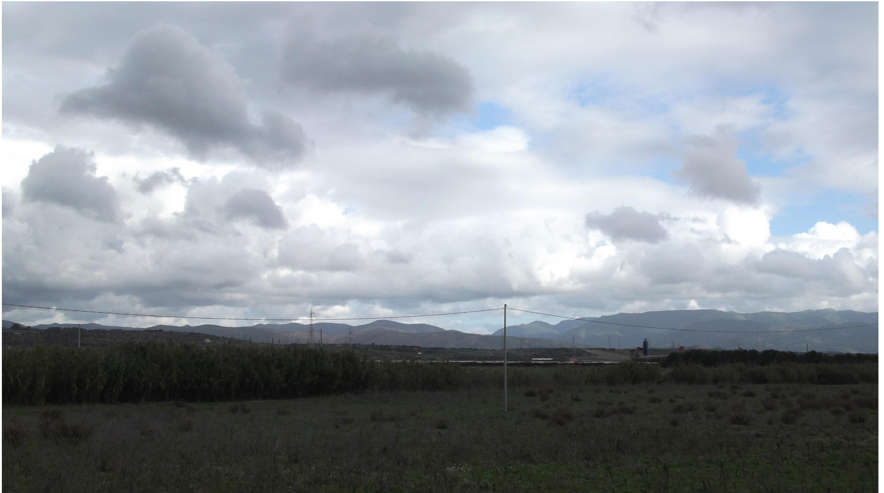
Punto 9: Vista in direzione Est da una strada vicinale, situata a Sud del centro abitato di Maracalagonis. La foto inquadra una parte dell'area di rispetto del Riu Foxi, che si trova a circa 70 metri dal punto di osservazione, mentre la SS 554 sarà realizzata oltre il fiume, a circa 250 metri dal punto di ripresa