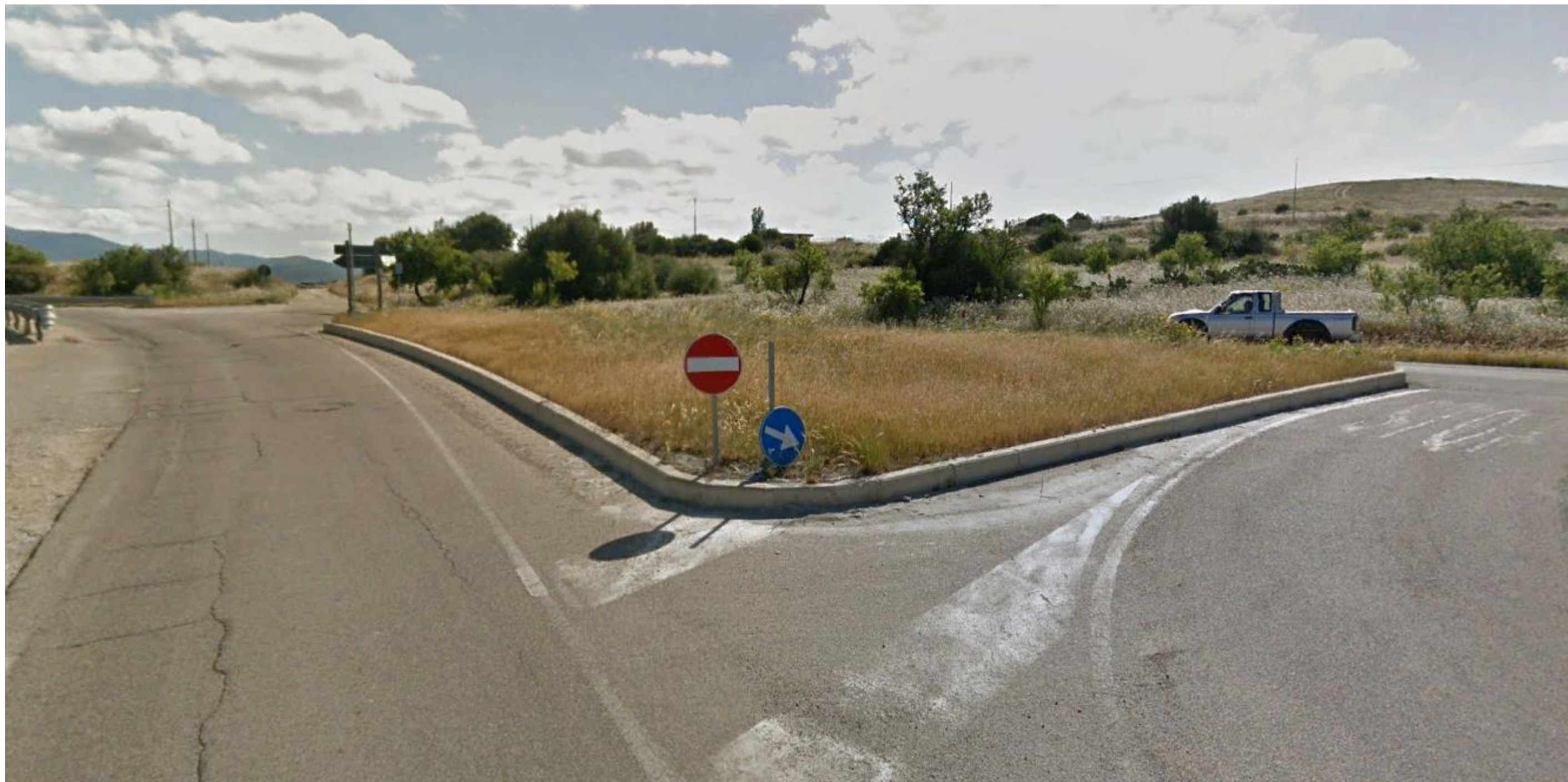
Punto 2: Vista dalla Strada Ex Provinciale Quartucciu Ganni in direzione dell'intersezione con la Strada Statale 125 Orientale Sarda, a Nord-Est del centro abitato di Quartucciu