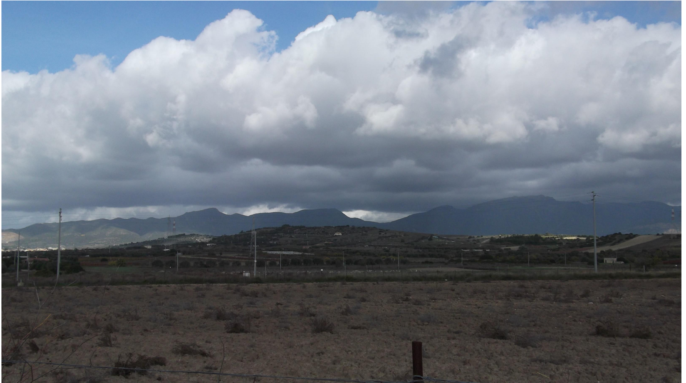
Punto 14: Vista in direzione Nord da una strada vicinale, situata a Sud-Est del centro abitato di Maracalagonis. Nell'area inquadrata verrà realizzata in rilevato la SS 554, secondo l'asse Est-Ovest