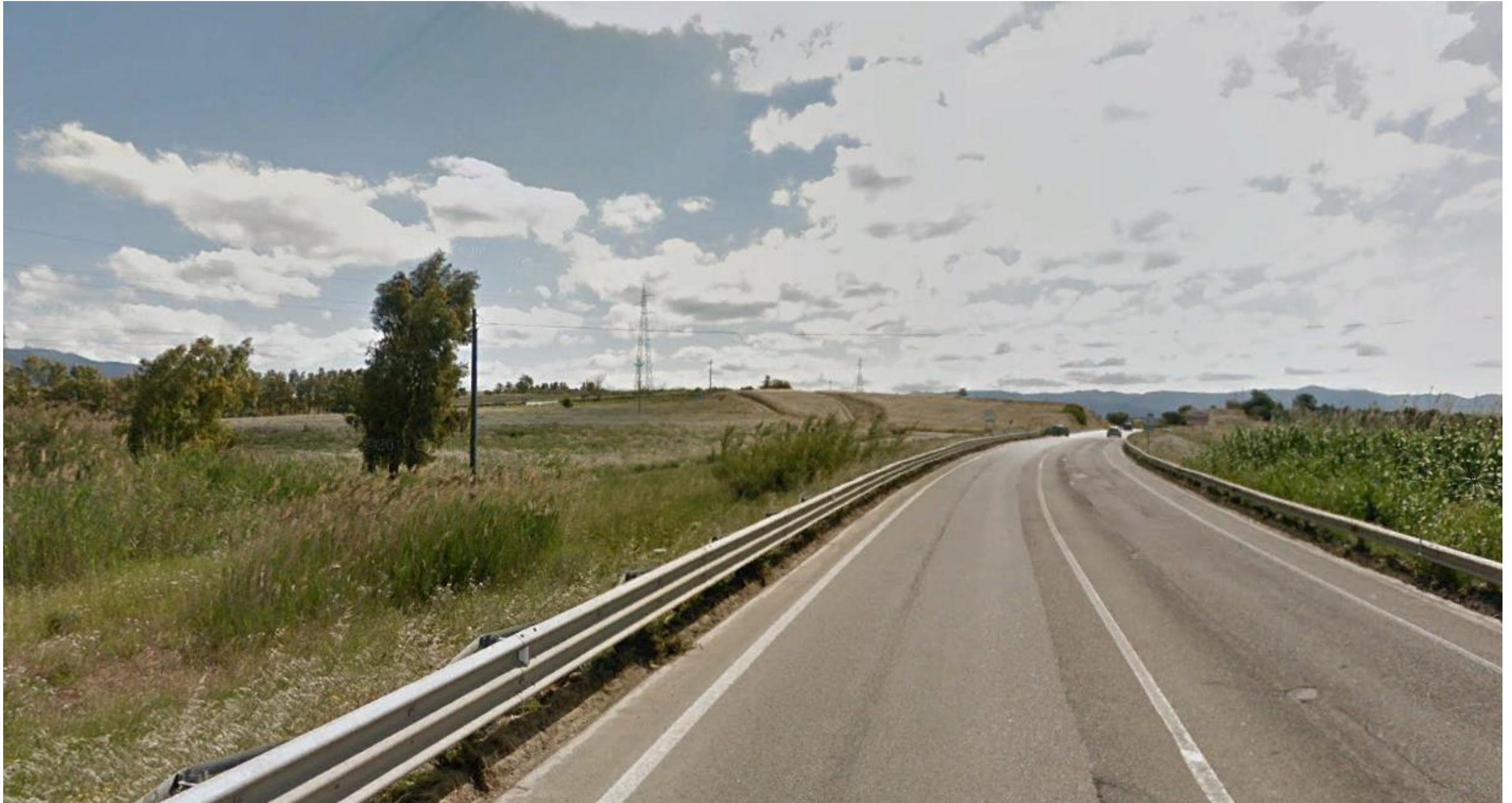
Punto 5: Vista dalla SS 125 in direzione da Quartucciu verso Maracalagonis, a Nord-Est del centro abitato di Quartucciu. Nell'area inquadrata, sulla destra verrà realizzata una rotatoria a raso e sulla sinistra verrà realizzata la Strada Statale 554, con un tratto in sopraelevata