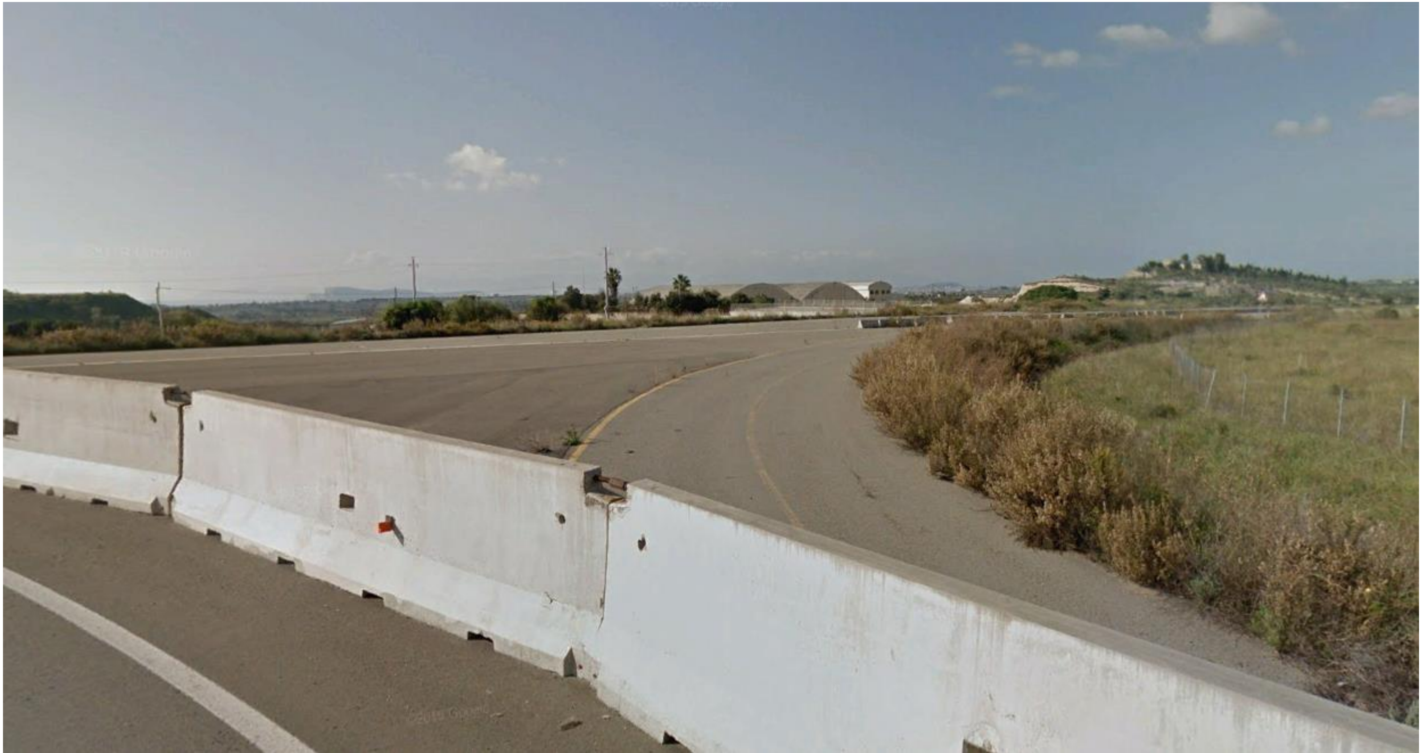
Punto 18: Vista dallo svincolo di raccordo tra la SS 554 bis e la SS 125 in direzione della SS 554. Nella foto è inquadrato il piccolo tratto già esistente, ma non attivo, della SS 554, separato dalla strada attualmente in uso dai new jersey in primo piano