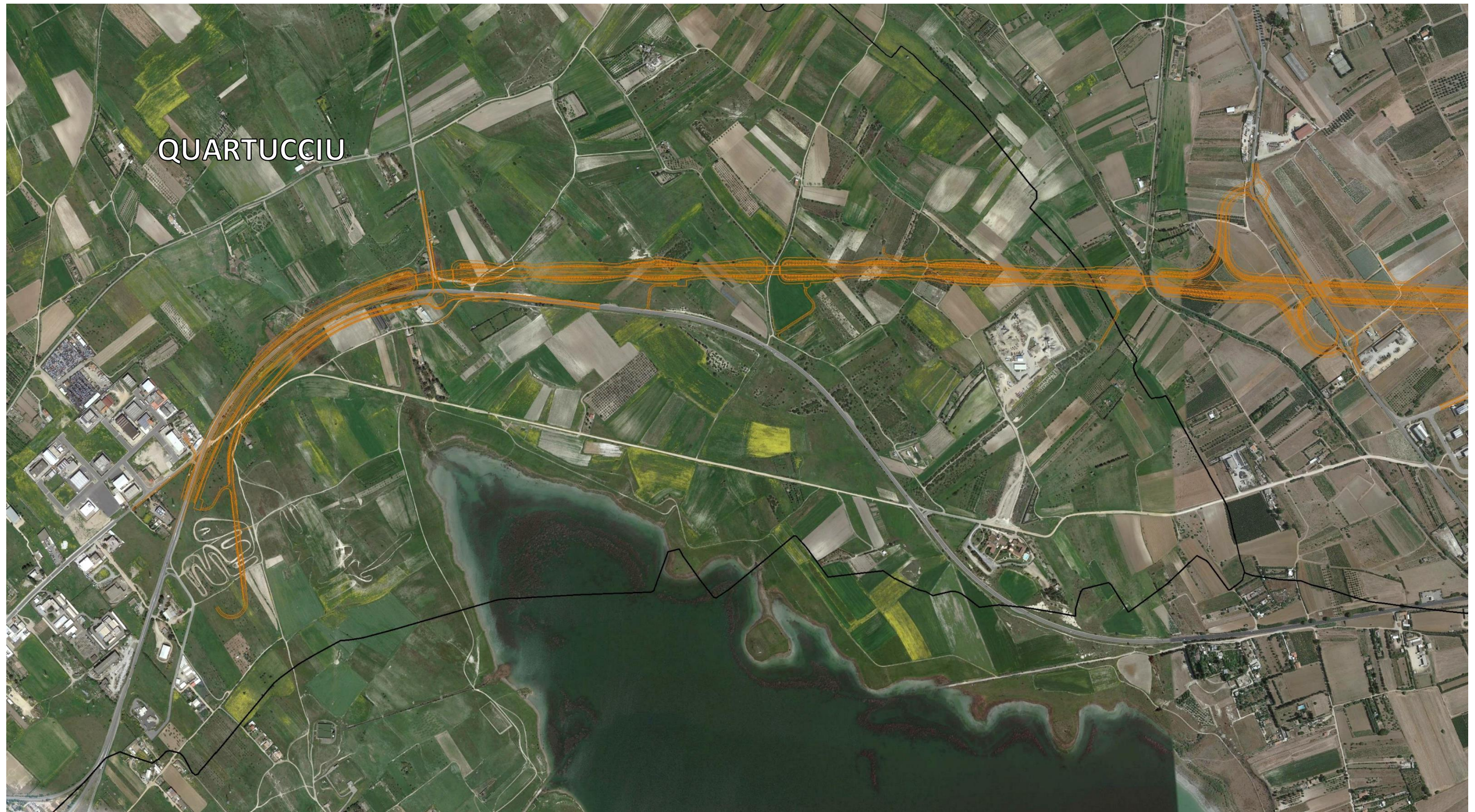
Ortofoto con sovrapposizione del primo tratto di intervento situato nel Comune di Quartucciu