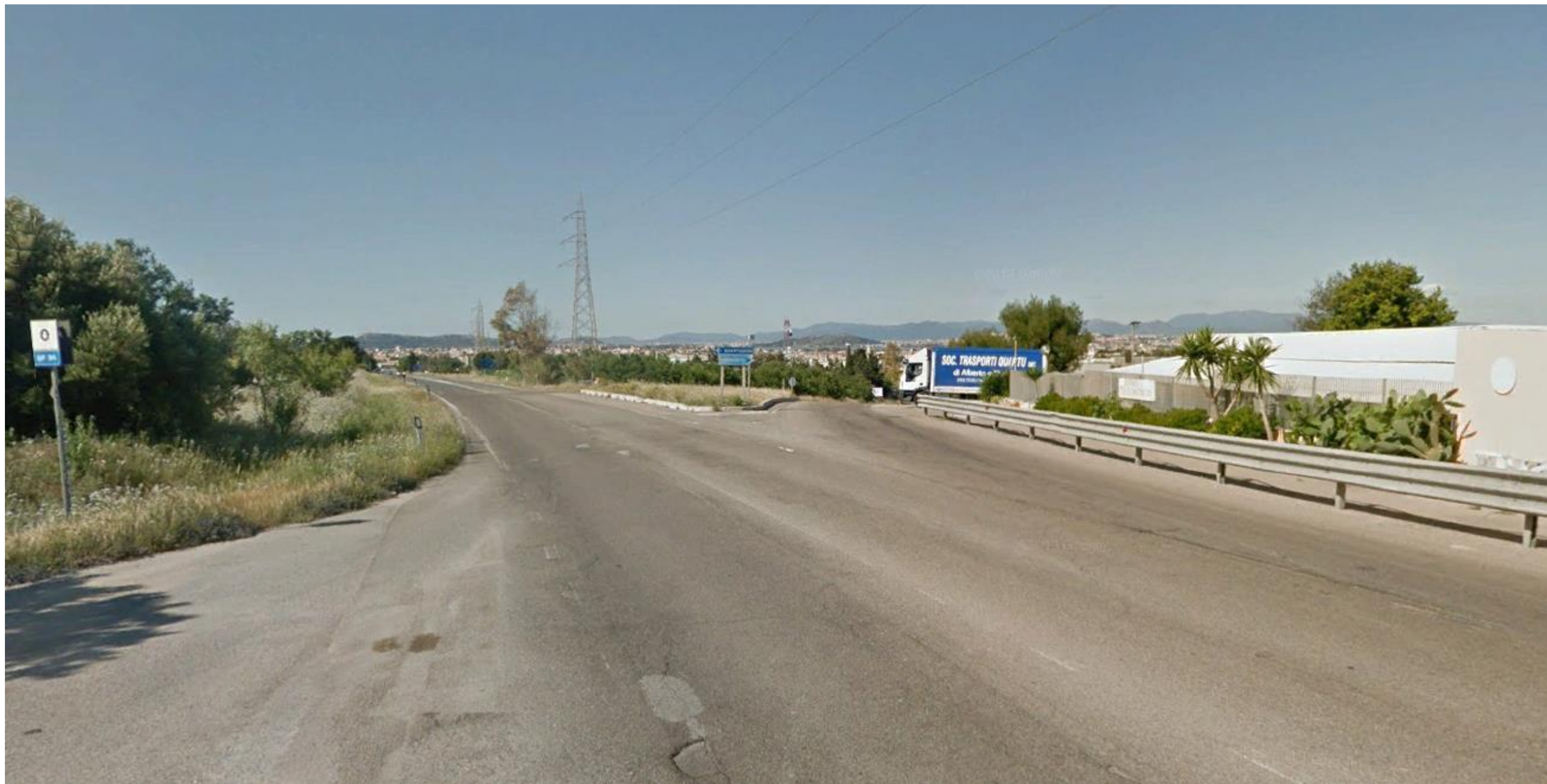
Punto 3: Vista dalla Strada Provinciale 94 in direzione della Strada Statale 125 Orientale Sarda, a Nord-Est del centro abitato di Quartucciu. Da questa inquadratura è visibile, da un punto di vista opposto, l'intersezione ripresa dal punto 2