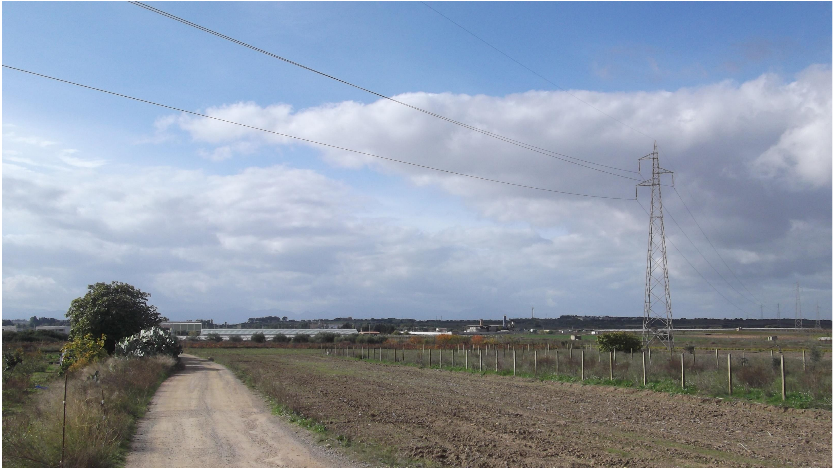
Punto 13: Vista in direzione Sud-Ovest da una strada vicinale, situata a Sud-Est del centro abitato di Maracalagonis. Nell'area fotografata verrà realizzata in rilevato la SS 554, secondo l'asse Est-Ovest