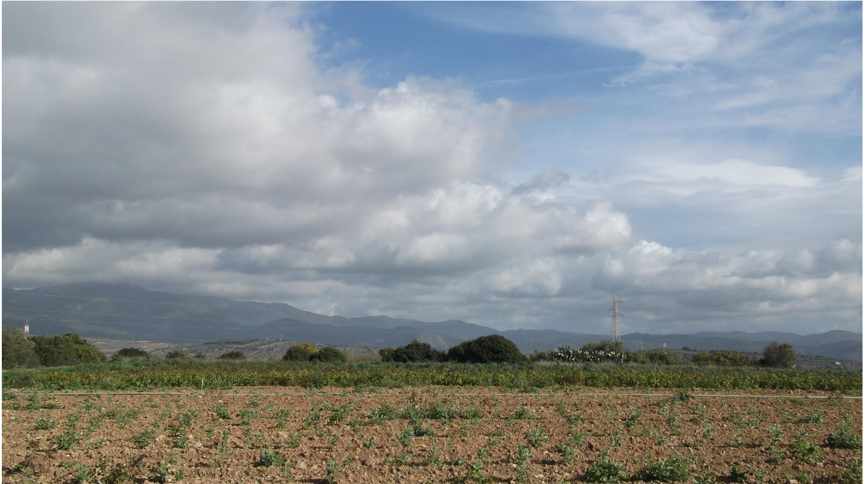
Punto 8: Vista in direzione Nord da una strada vicinale, situata a Nord-Est del centro abitato di Quartucciu. Nell'area fotografata verrà realizzata in rilevato la SS 554, secondo l'asse Est-Ovest