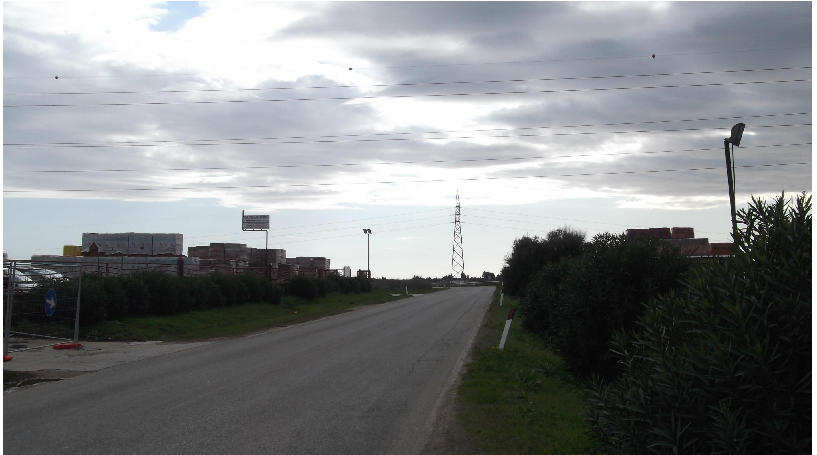
Punto 10: Vista dalla Strada Provinciale 15 in direzione Sud. Il punto di ripresa è situato a Sud del centro abitato di Maracalagonis e si trova in prossimità del luogo in cui verrà realizzata una rotatoria a raso, dalla quale si diramerà uno svincolo verso la SS 554, il cui tracciato si svilupperà circa 300 metri più a Sud lungo l'asse Est-Ovest