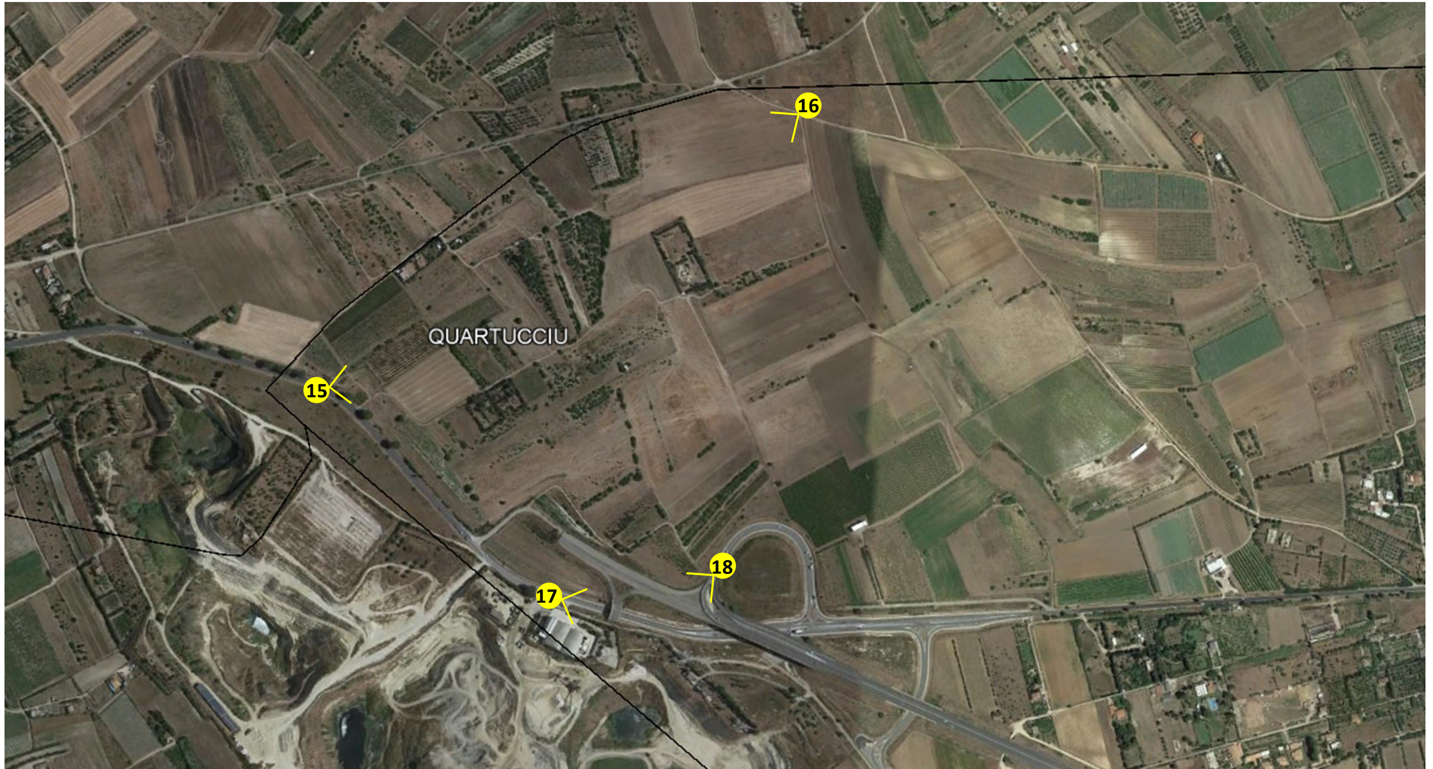
Punti di ripresa fotografici