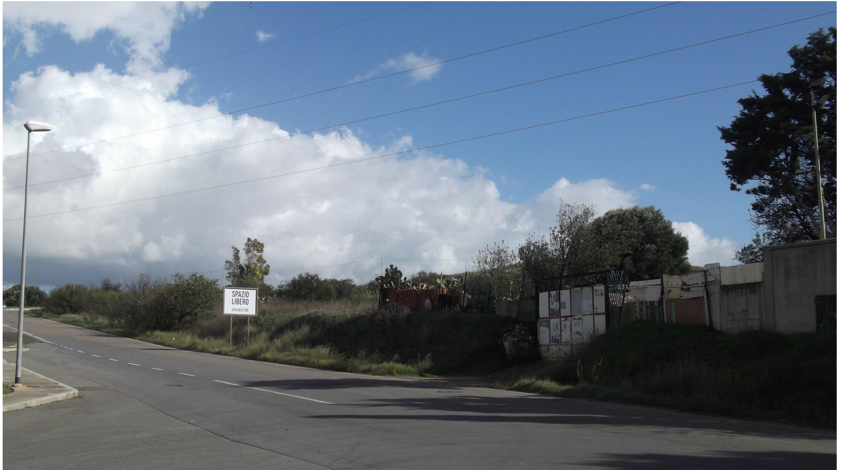
Punto 1: Vista dall'intersezione tra Località Pill' 'e Matta e Strada Ex Provinciale Quartucciu Ganni in direzione della Strada Statale 125 Orientale Sarda, a Nord-Est del centro abitato di Quartucciu