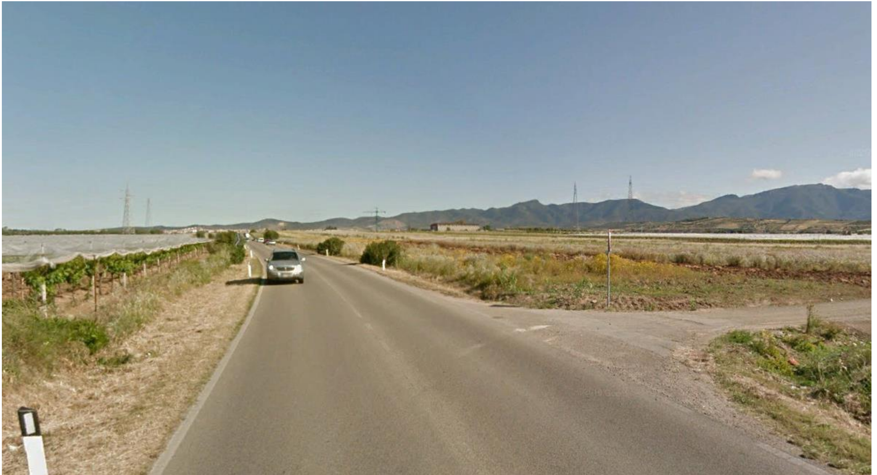
Punto 11: Vista dalla Strada Provinciale 15 in direzione Nord. Il punto di ripresa è situato a Sud del centro abitato di Maracalagonis e si trova in prossimità del luogo in cui verrà realizzata una rotatoria a raso, dalla quale si diramerà uno svincolo verso la SS 554, il cui tracciato sarà realizzato circa 150 metri più a Nord lungo l'asse Est-Ovest