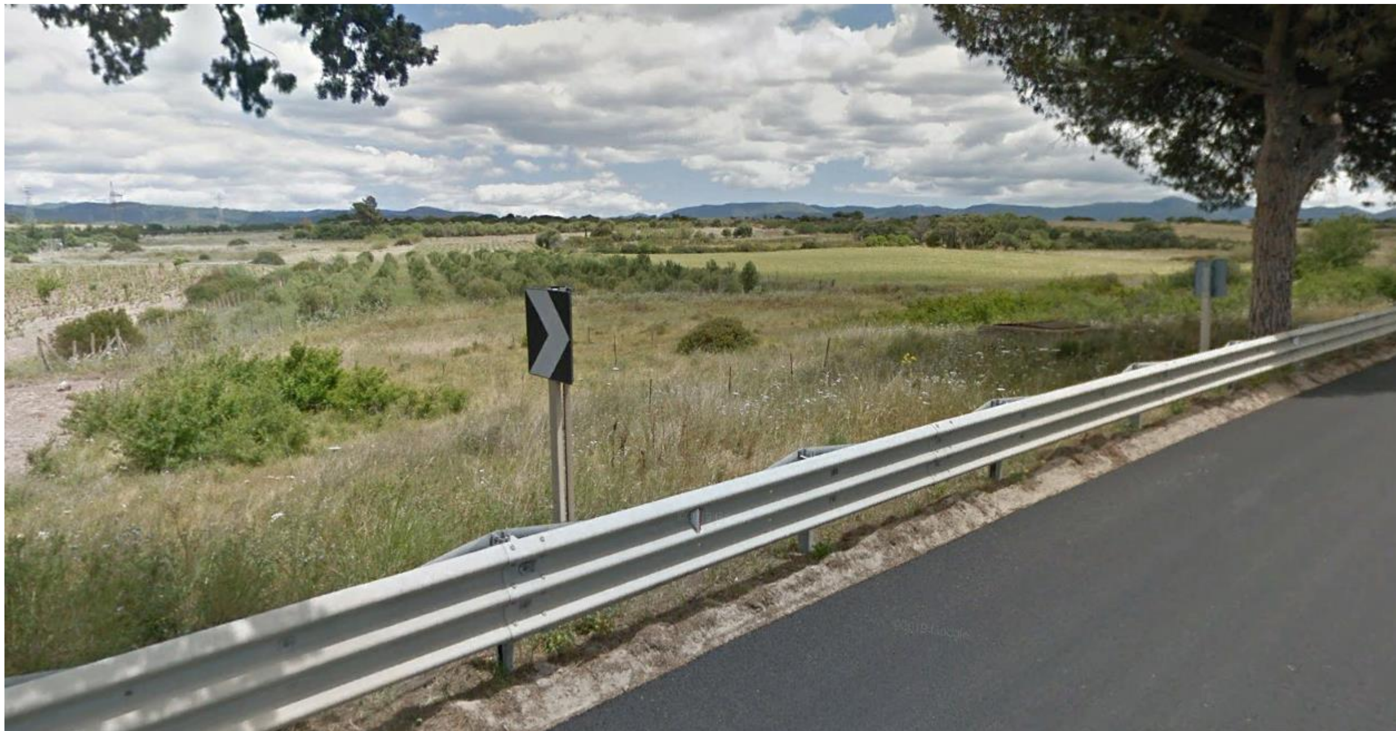
Punto 15: Vista in direzione Nord-Est dalla Strada Statale 125. Nell'area inquadrata, a circa 50 metri dal punto di ripresa, verrà realizzata in rilevato la SS 554