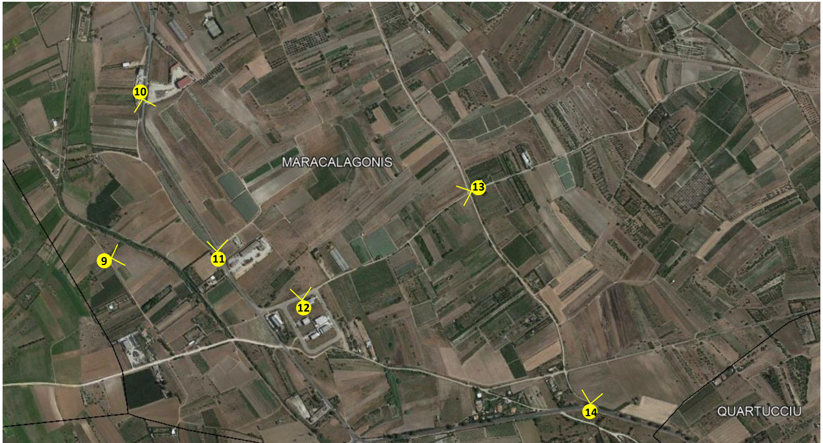
Punti di ripresa fotografici