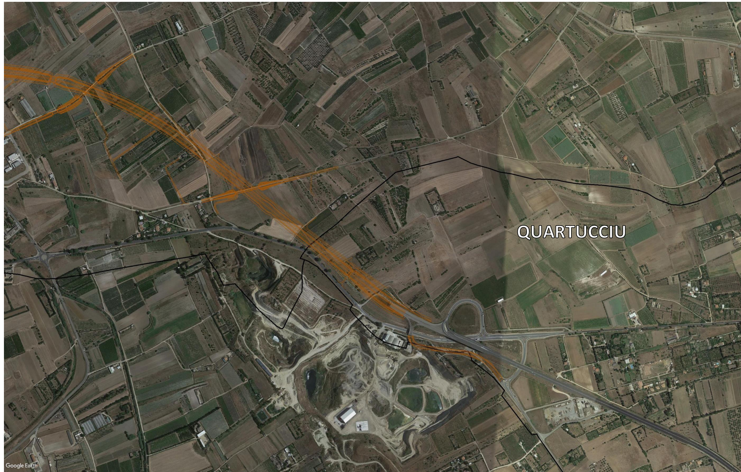
Ortofoto con sovrapposizione del secondo tratto di intervento situato nel Comune di Quartucciu