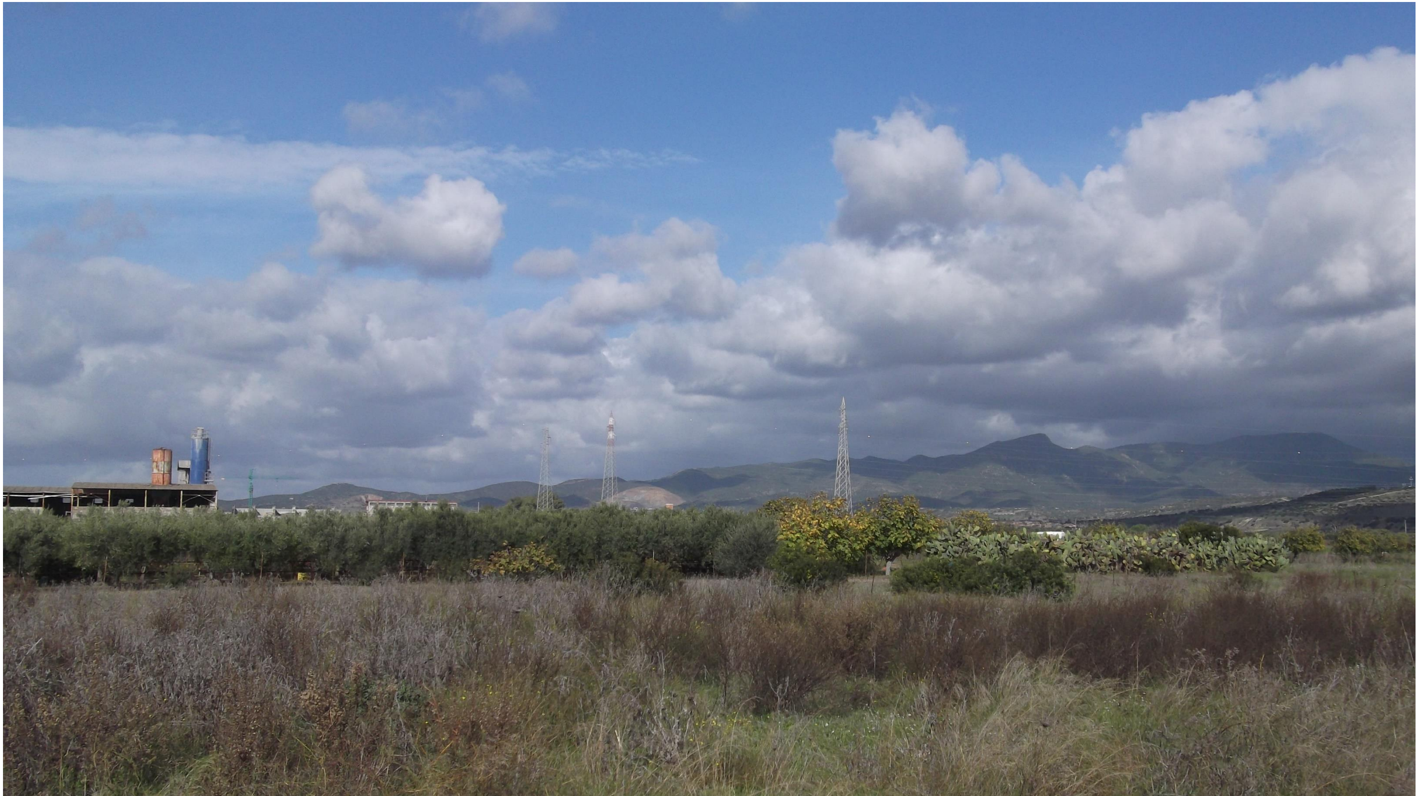
Punto 12: Vista in direzione Nord da una strada vicinale, situata a Sud del centro abitato di Maracalagonis. Nell'area fotografata verrà realizzata in rilevato la SS 554, secondo l'asse Est-Ovest