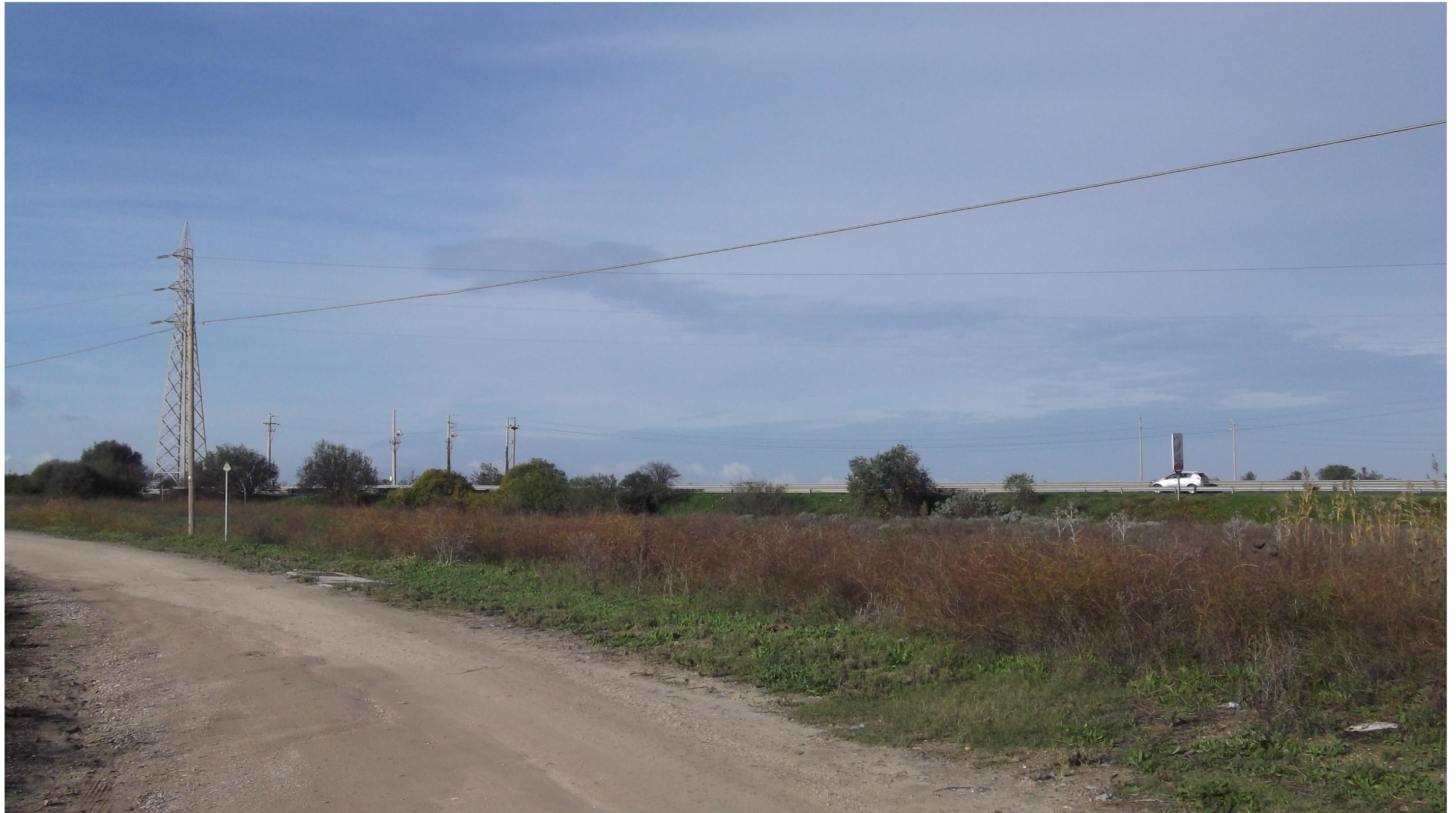
Punto 4: Vista dalla Strada Provinciale 94 in direzione della Strada Statale 125 Orientale Sarda, a Nord-Est del centro abitato di Quartucciu