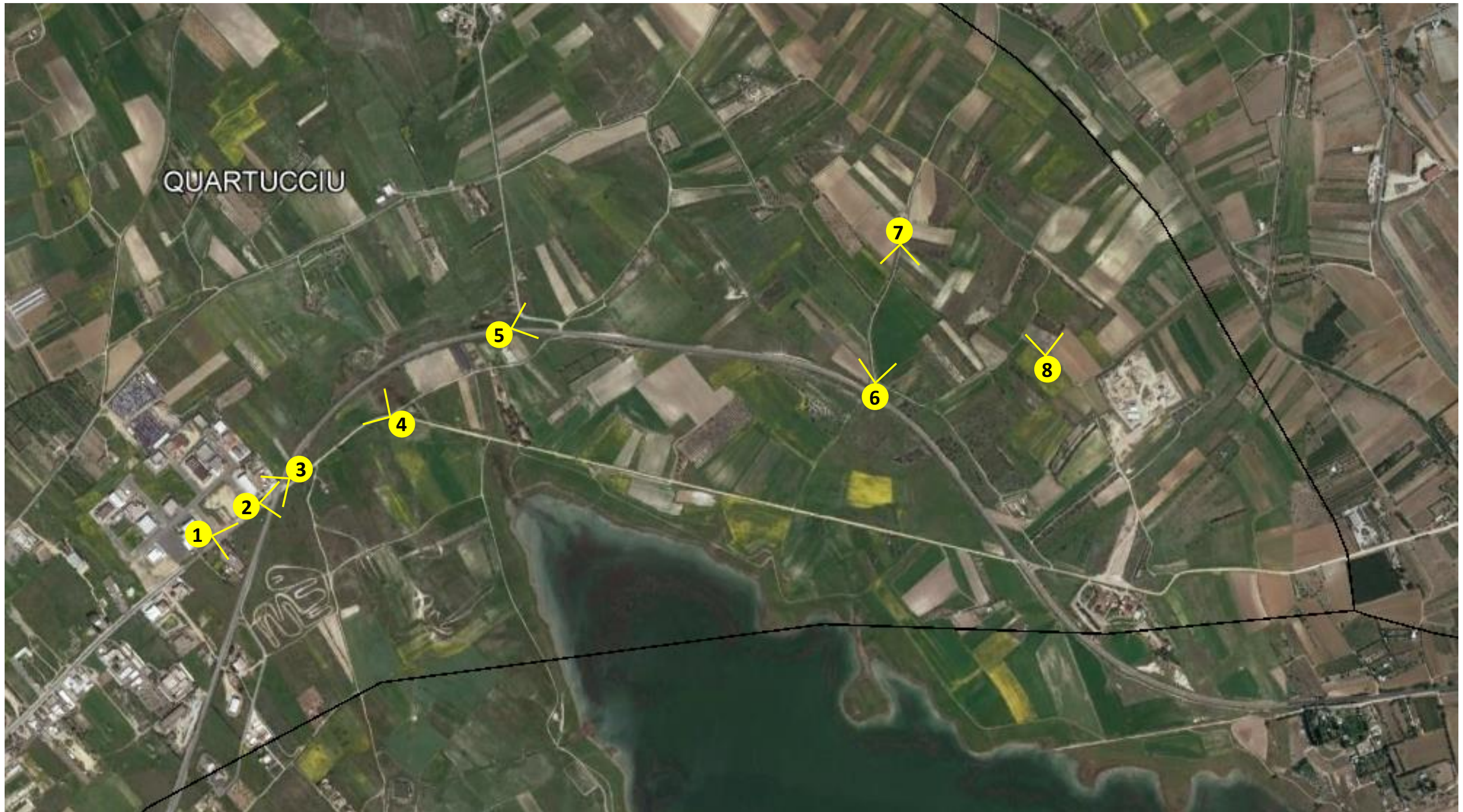
Punti di ripresa fotografici.