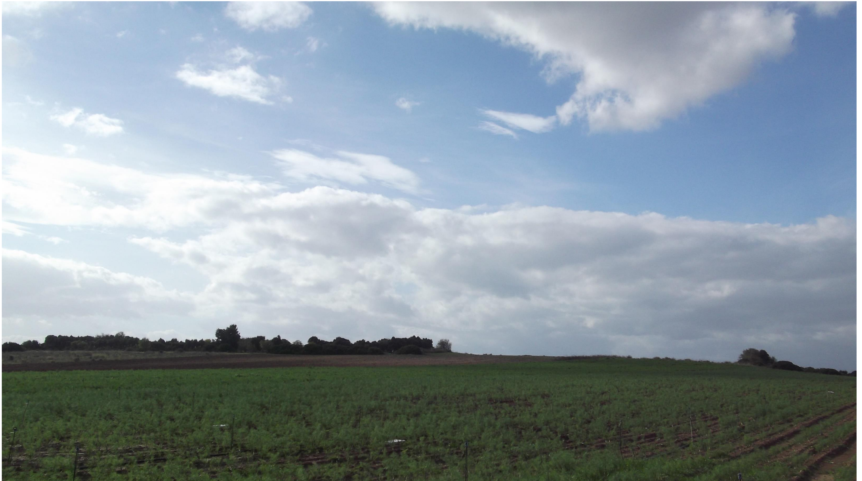
Punto 16: Vista in direzione Sud-Ovest da una strada vicinale, situata a Nord-Ovest della frazione Sant'Isidoro. Nell'area inquadrata, a circa 700 metri dal punto di ripresa, verrà realizzata in rilevato la SS 554