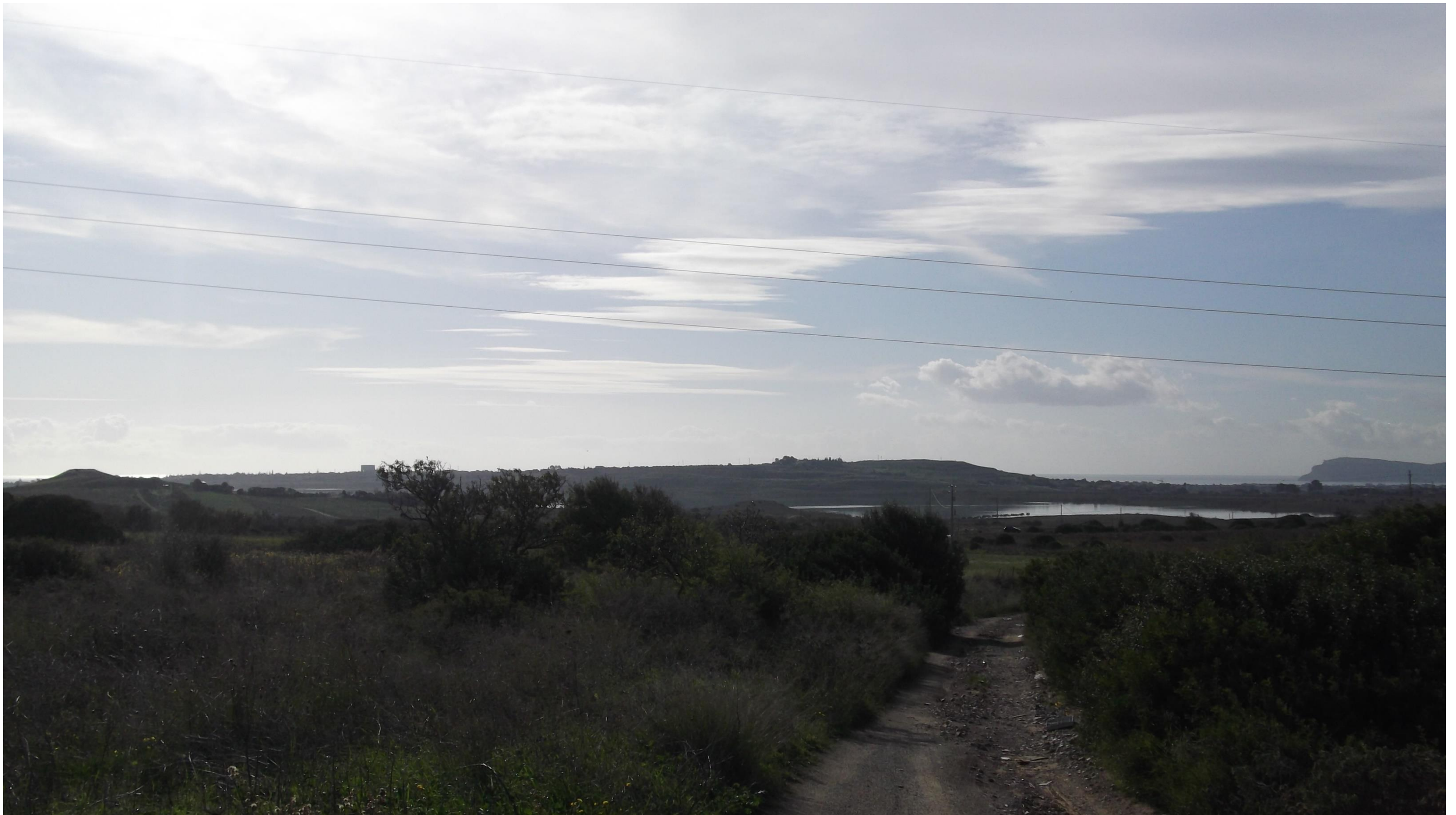
Punto 7: Vista in direzione Sud da una strada vicinale, situata a Nord-Est del centro abitato di Quartucciu. Nell'area fotografata verrà realizzata la SS 554, secondo l'asse Est-Ovest, con attraversamento in sopraelevata della suddetta strada vicinale