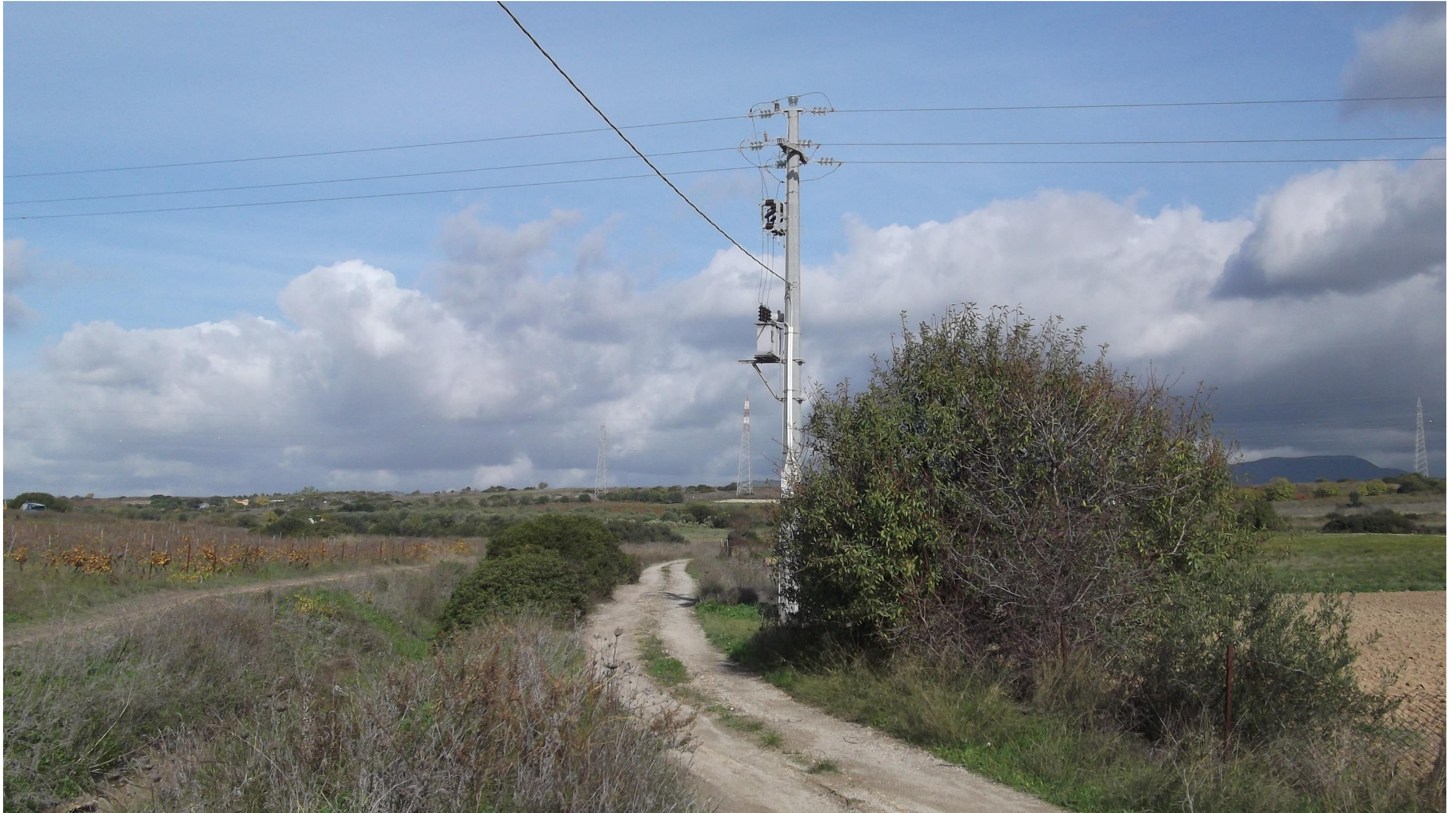
Punto 6: Vista in direzione Nord da una strada vicinale, situata a Nord-Est del centro abitato di Quartucciu. Nell'area inquadrata verrà realizzata la SS 554, secondo l'asse Est-Ovest, con attraversamento in sopraelevata della strada vicinale fotografata