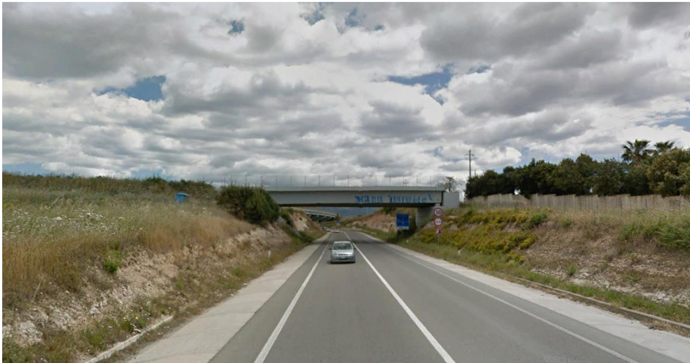
Punto 17: Vista in direzione Est dalla Strada Statale 125. Nella foto sono visibili il viadotto che verrà raccordato allo svincolo di accesso alla SS 554 e, sullo sfondo oltre il viadotto, una porzione della SS 554 bis