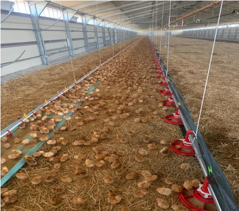
ALLEGATO n. 5 (Allevamento avicolo)