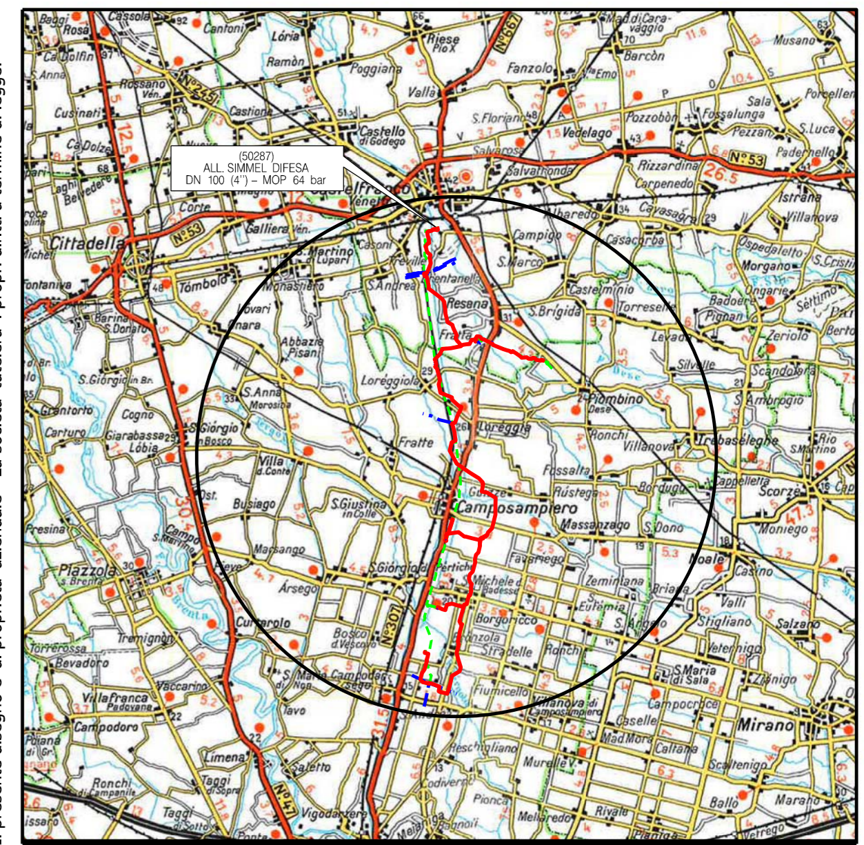
COROGRAFIA SCALA 1: 200.000