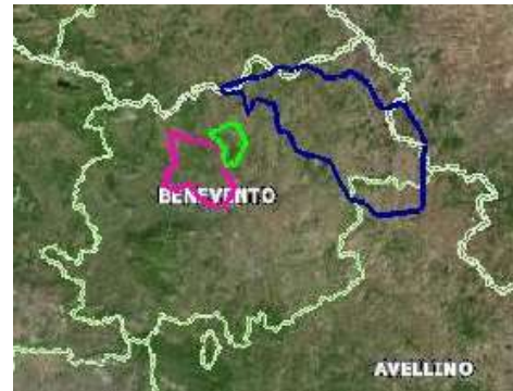
Mappa di inquadramento territoriale

Questa Associazione, quale ente gestore dell'oasi WWF "Lago di Campolattaro", parzialmente coincidente con la Zona di Protezione Speciale (ZPS) codice IT8020015 ( Invaso del Fiume Tammaro ), evidenzia la criticità verso cui sta evolvendo il territorio circostante, come mostra la mappa seguente.