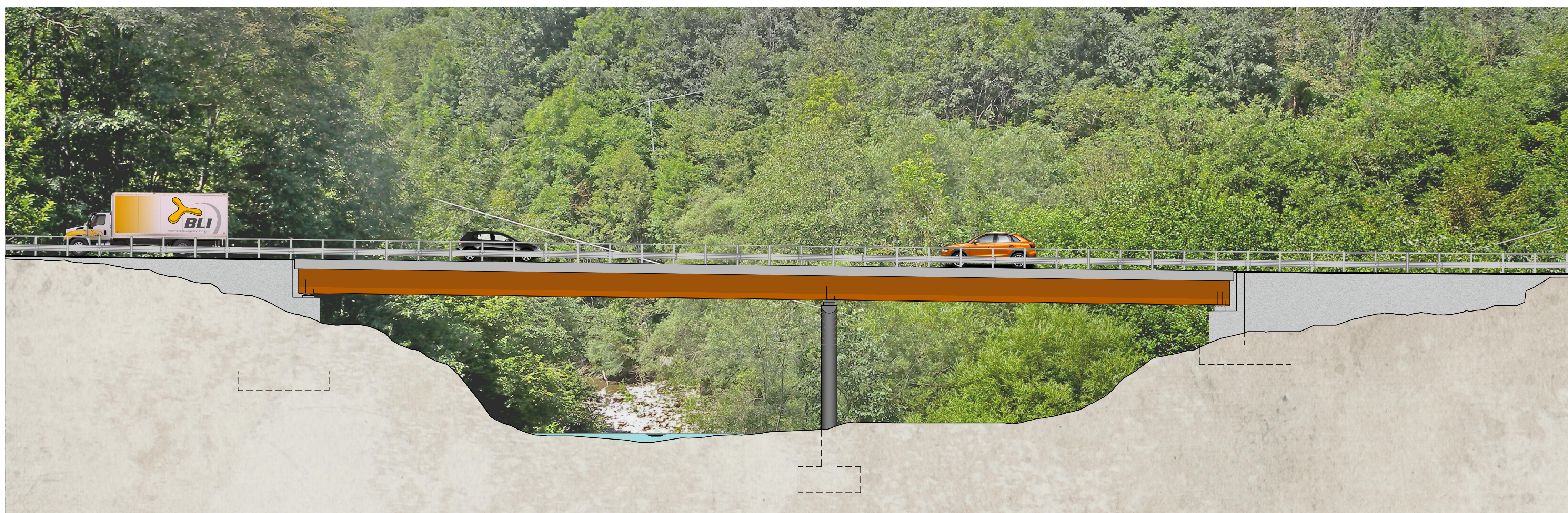
PROSPETTO PONTE SUL TREBBIA da km 0+000 a km 0+174 scala 1:200