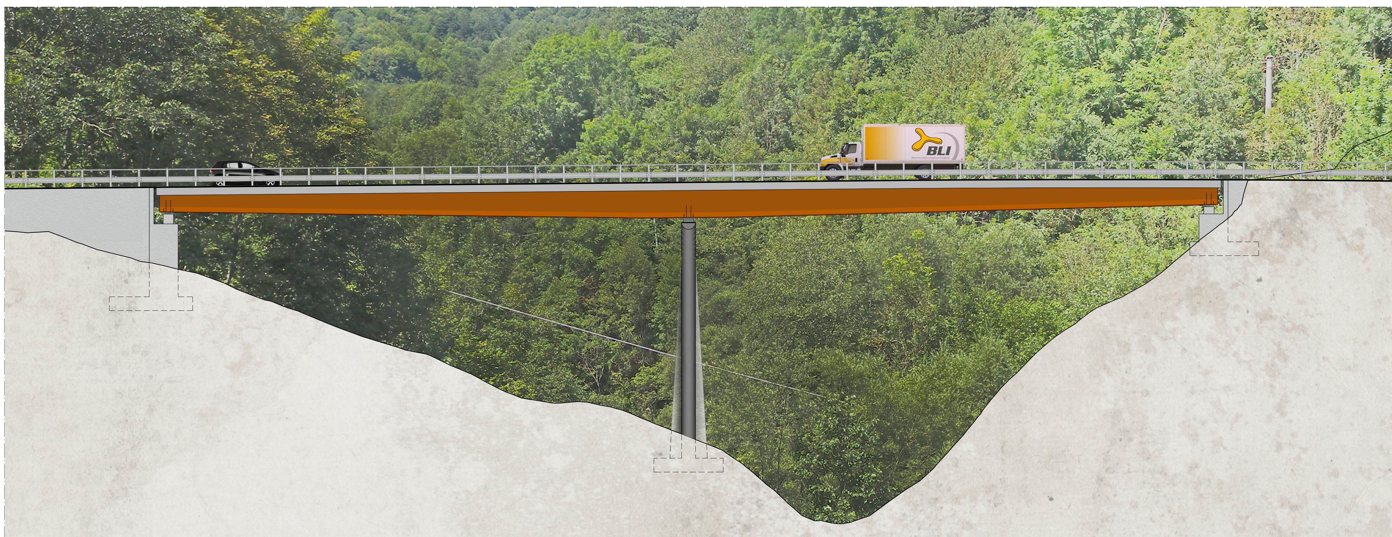
PROSPETTO VI01 da km 0+455 a km 0+545 scala 1:200