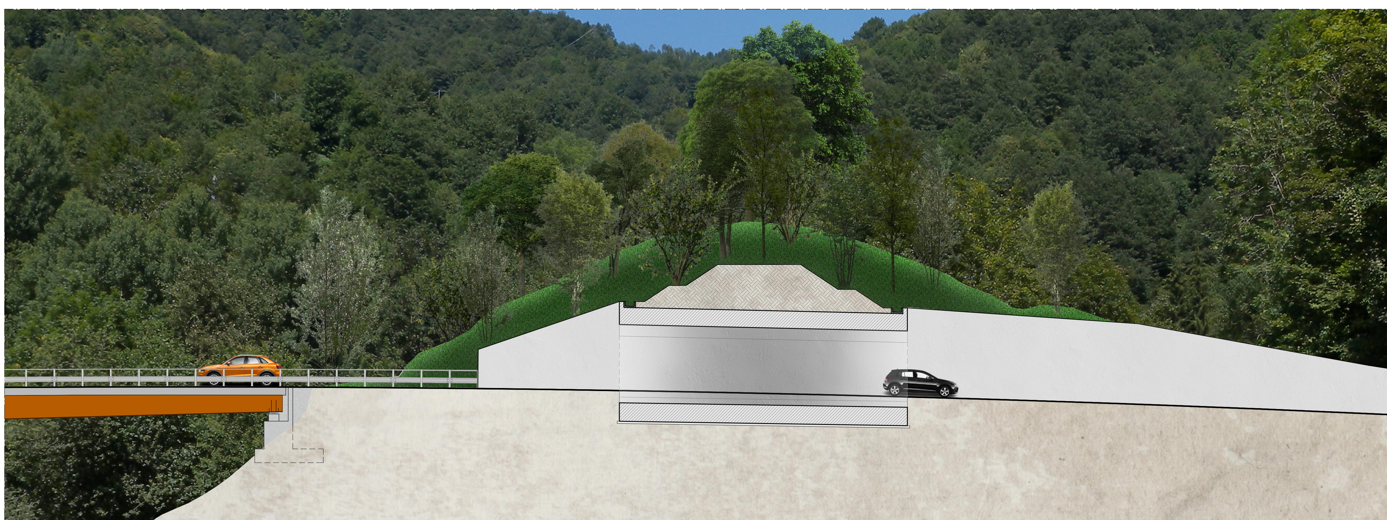
SEZIONE SULLA GALLERIA da km 0+590 a km 0+615 scala 1:200