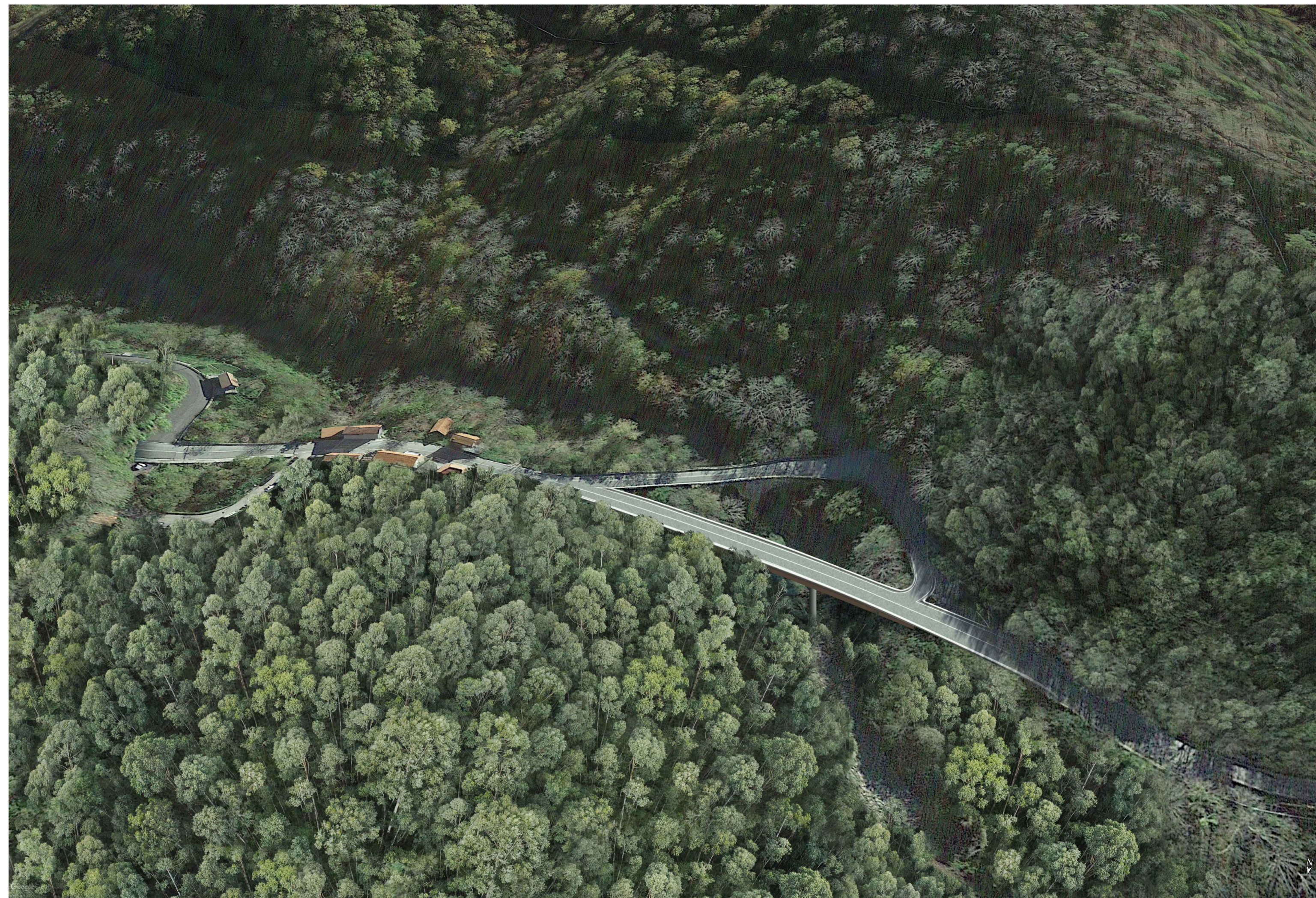
01 - POST OPERAM - Vista a volo d'uccello da NE verso SO