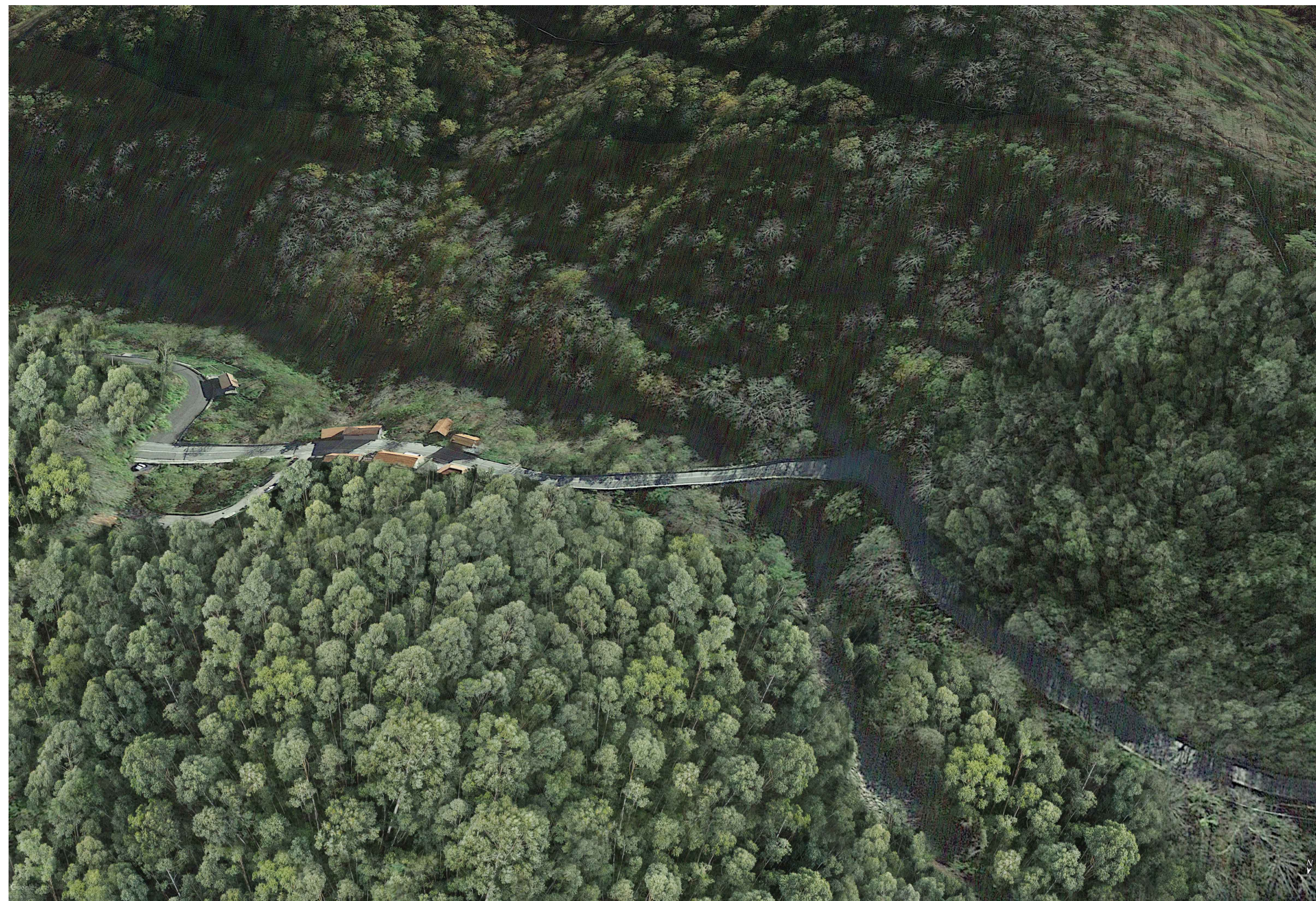
01 - ANTE OPERAM - Vista a volo d'uccello da NE verso SO