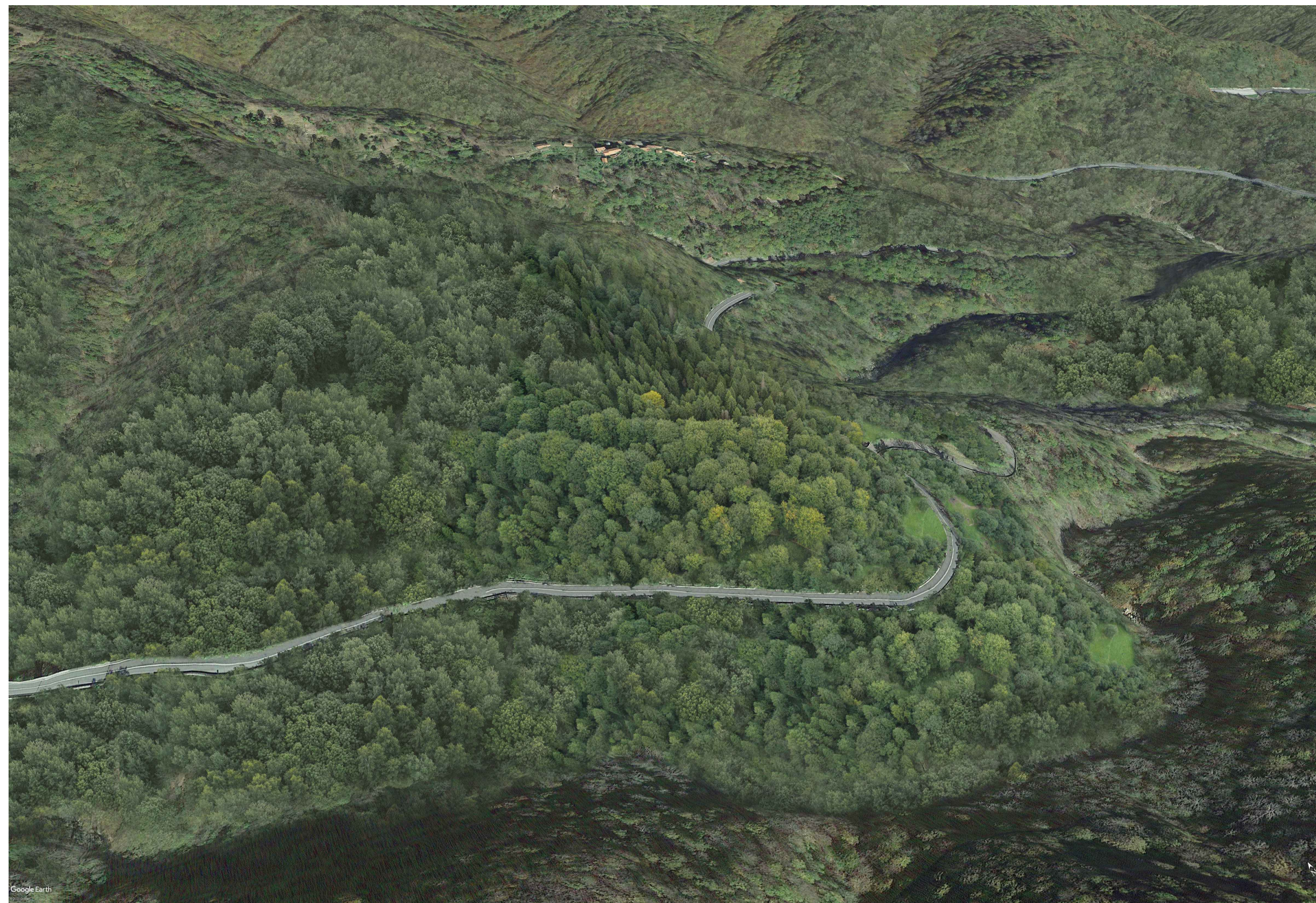
02 - ANTE OPERAM - Vista a volo d'uccello da SO verso NE