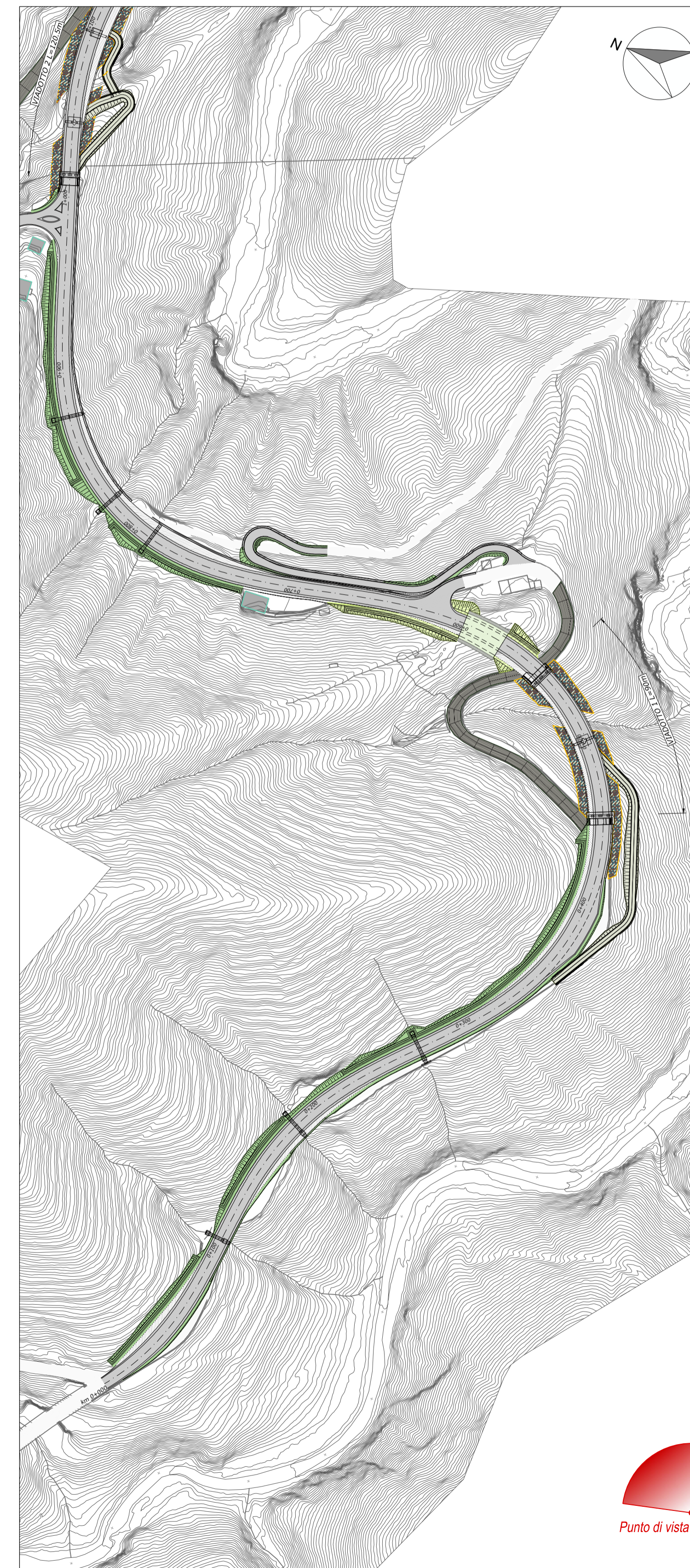
PROGETTO DI MITIGAZIONE AMBIENTALE (elaborato TO0AI01AMBPP01A)