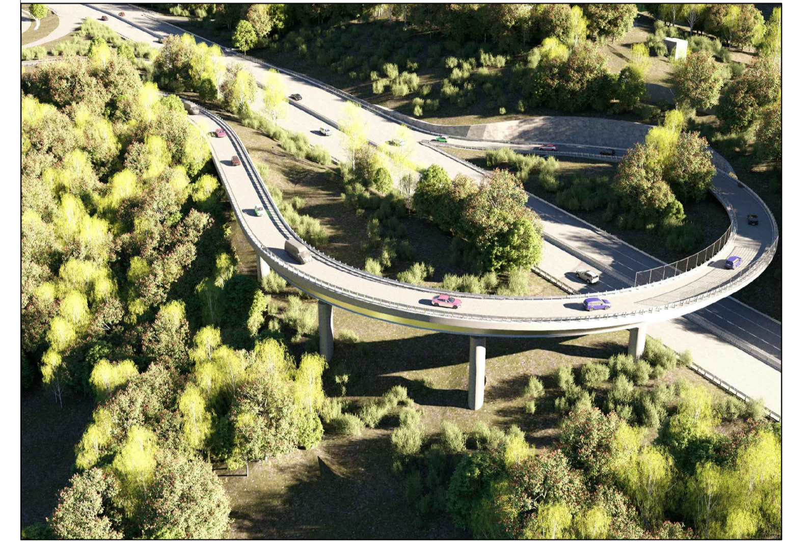
RENDERING NUOVE OPERE