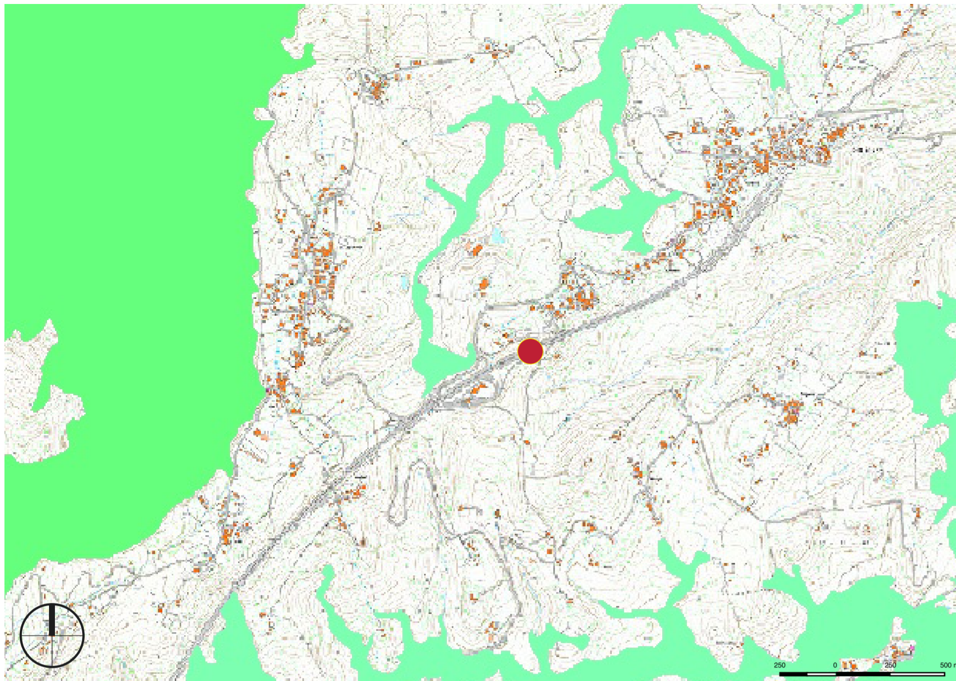
FIG. 1 Estratto della carta delle categorie forestali all'interno dell'areale paesistico di riferimento