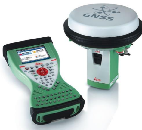
Figura 2: GPS GNSS Leica – Controller ed antenna

La campagna di misurazione delle coordinate relative al punto d'indagine, è stata condotta tramite dispositivo GPS GNSS Leica mod. CS15 – GS15 (Fig. 2).