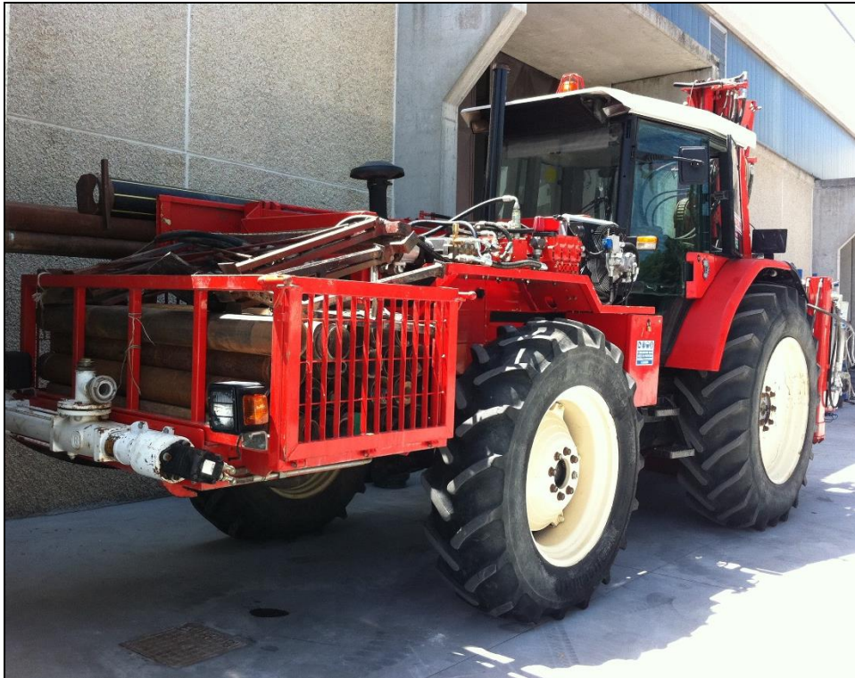
Figura 1: Sonda Modello EK 650 – Trattore Same Antares

La perforazione e l'infissione del rivestimento provvisorio (casing \varnothing 127 mm) sono stati condotti in modo da minimizzare la variazione di stato dei terreni attraversati. Sono stati utilizzati inoltre La perforazione è stata condotta a carotaggio continuo, utilizzando un carotiere semplice (T1) avente diametro nominale pari a 101 mm.