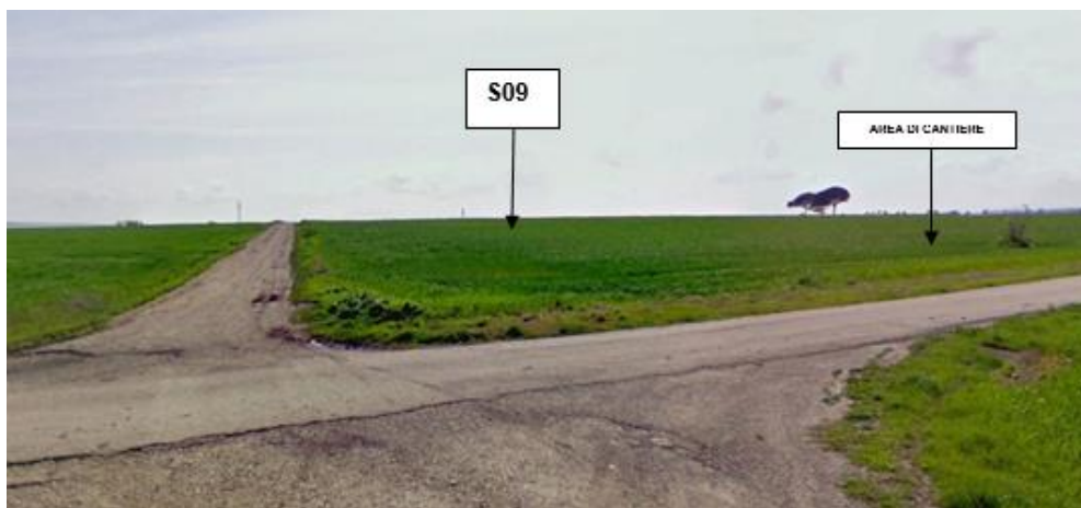
Figura 1 – Posizione aerogeneratori