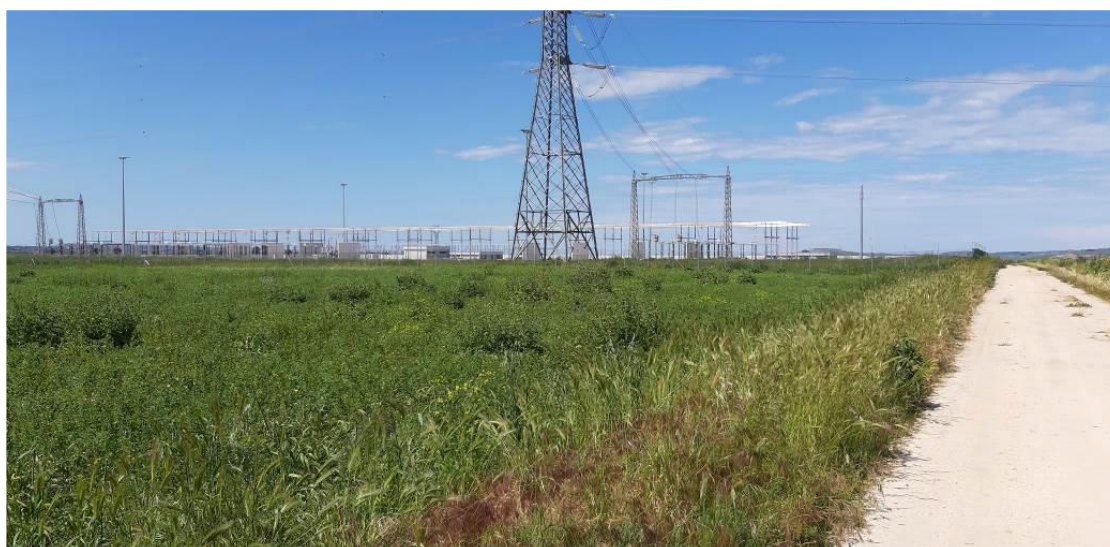
Figura 5 – Stazione RTN 380 kV "Rotello" di proprietà Terna