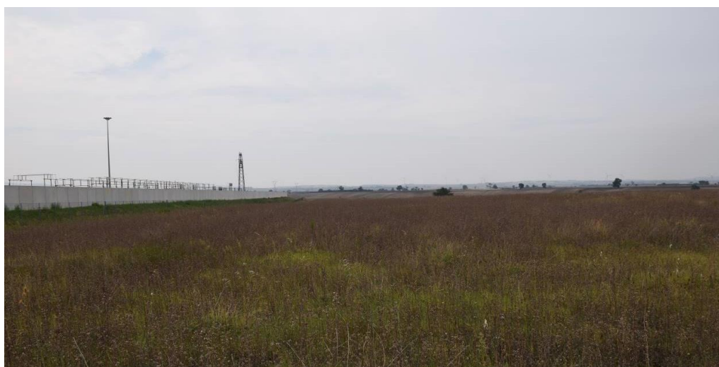
Figura 4– Aree prossime a quelle d'installazione della stazione elettrica.