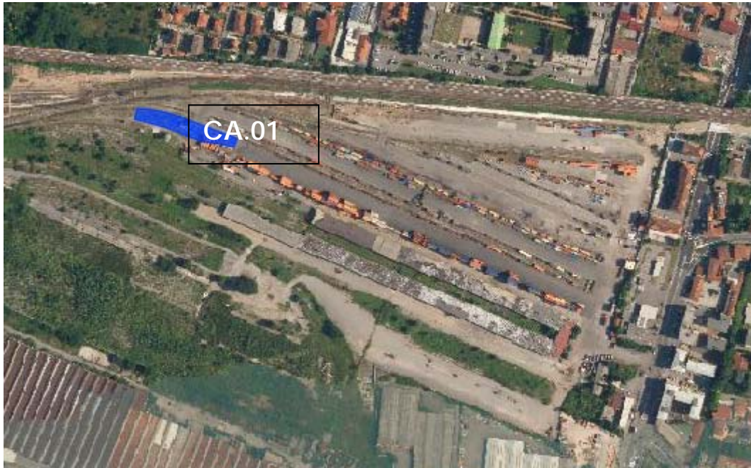
Vista aerea della CA.01

Il cantiere è posizionato all'interno dello scalo ferroviario di Brescia.