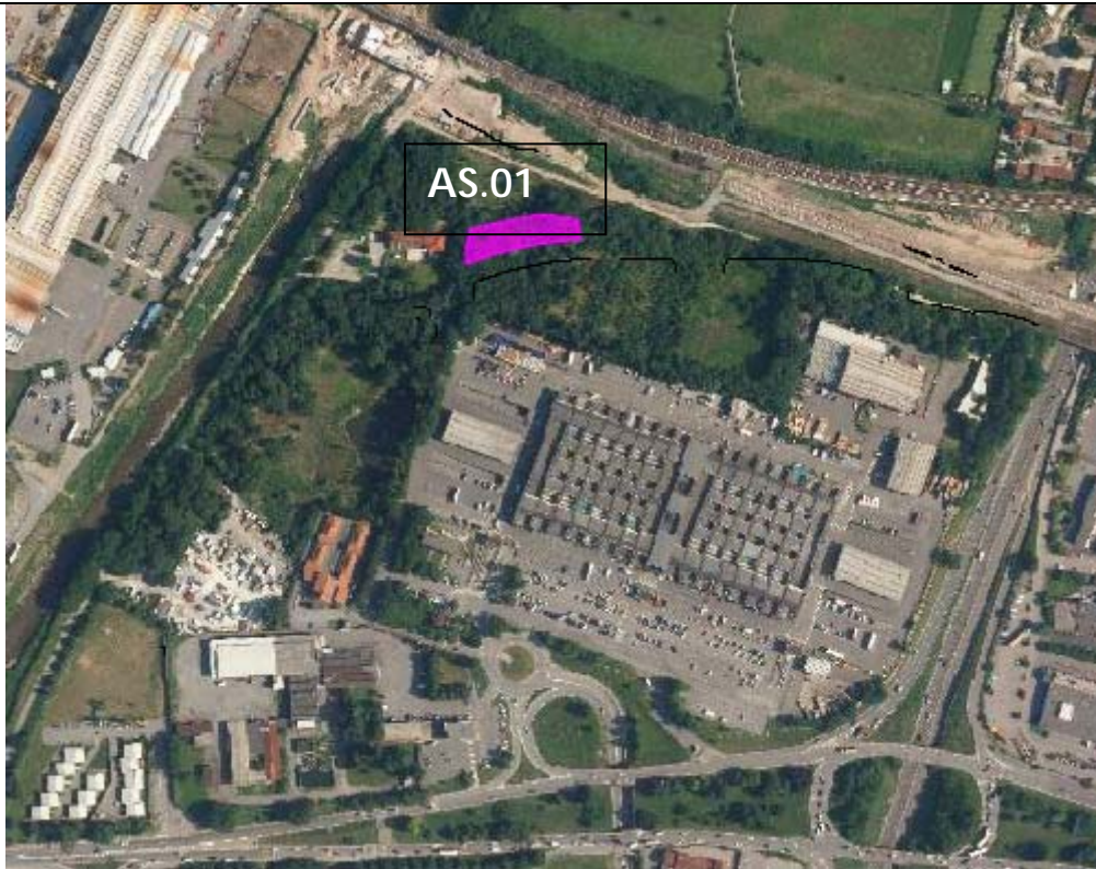
Vista aerea dell' AS.01