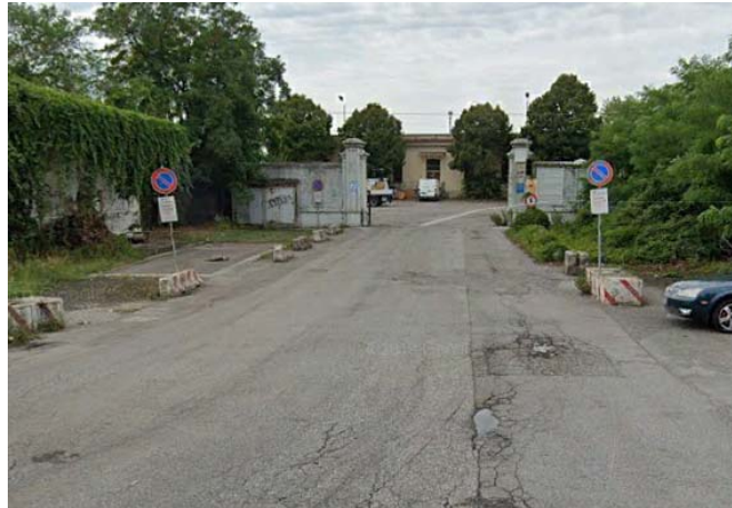
Accesso alle aree di cantiere da via Dalmazia

Nelle schede descrittive delle singole aree di cantiere di seguito riportate sono illustrati i percorsi che verranno impiegati dai mezzi di lavoro per l'accesso; detti percorsi sono altresì riportati sulla planimetria in scala 1:2.000.