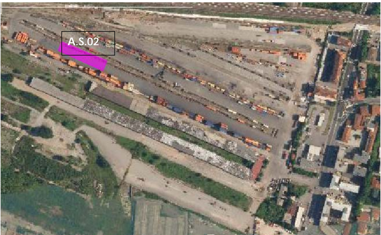
Vista aerea dell'AS.02

L'area di stoccaggio si trova all'interno di un piazzale ferroviario