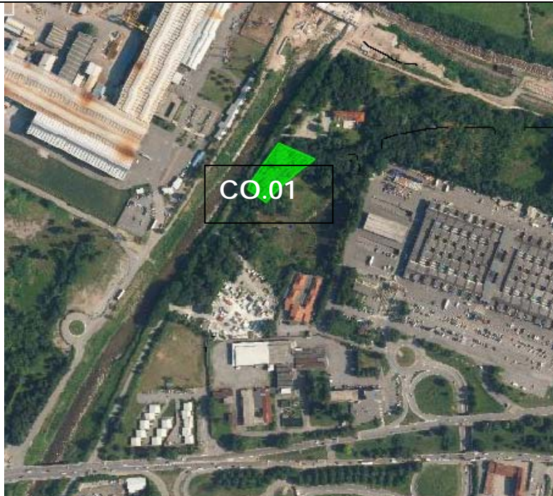
Vista aerea del CO.01