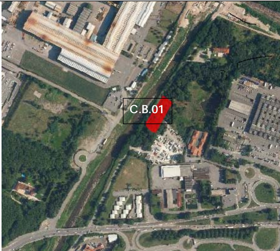
Vista aerea del C.B.01