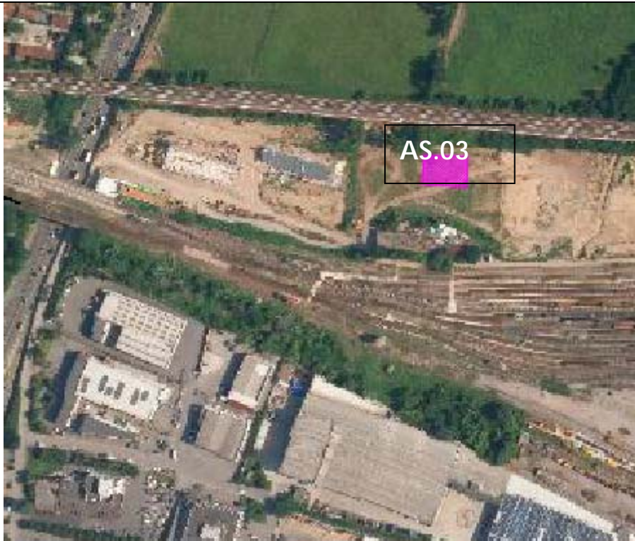
Vista aerea dell'AS.03