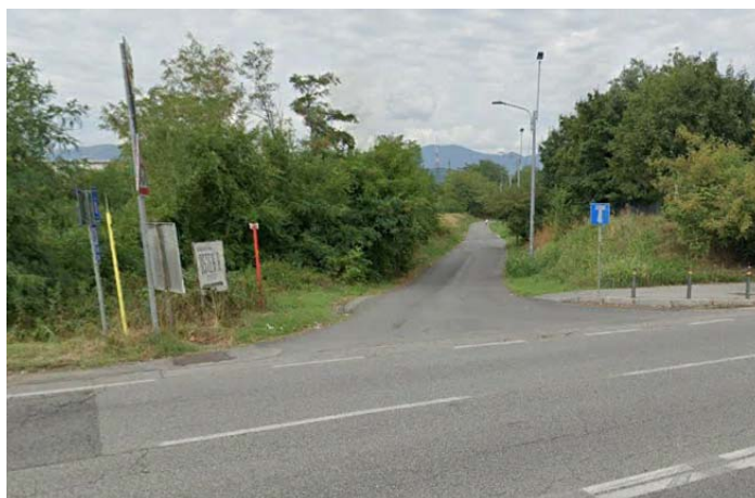
Accesso alle aree di cantiere da via Orzinuovi (fonte Google Earth)

Le viabilità primarie identificate per il trasporto dei materiali sono costituite da via Orzinuovi, dalla tangenziale Ovest e Via Dalmazia.