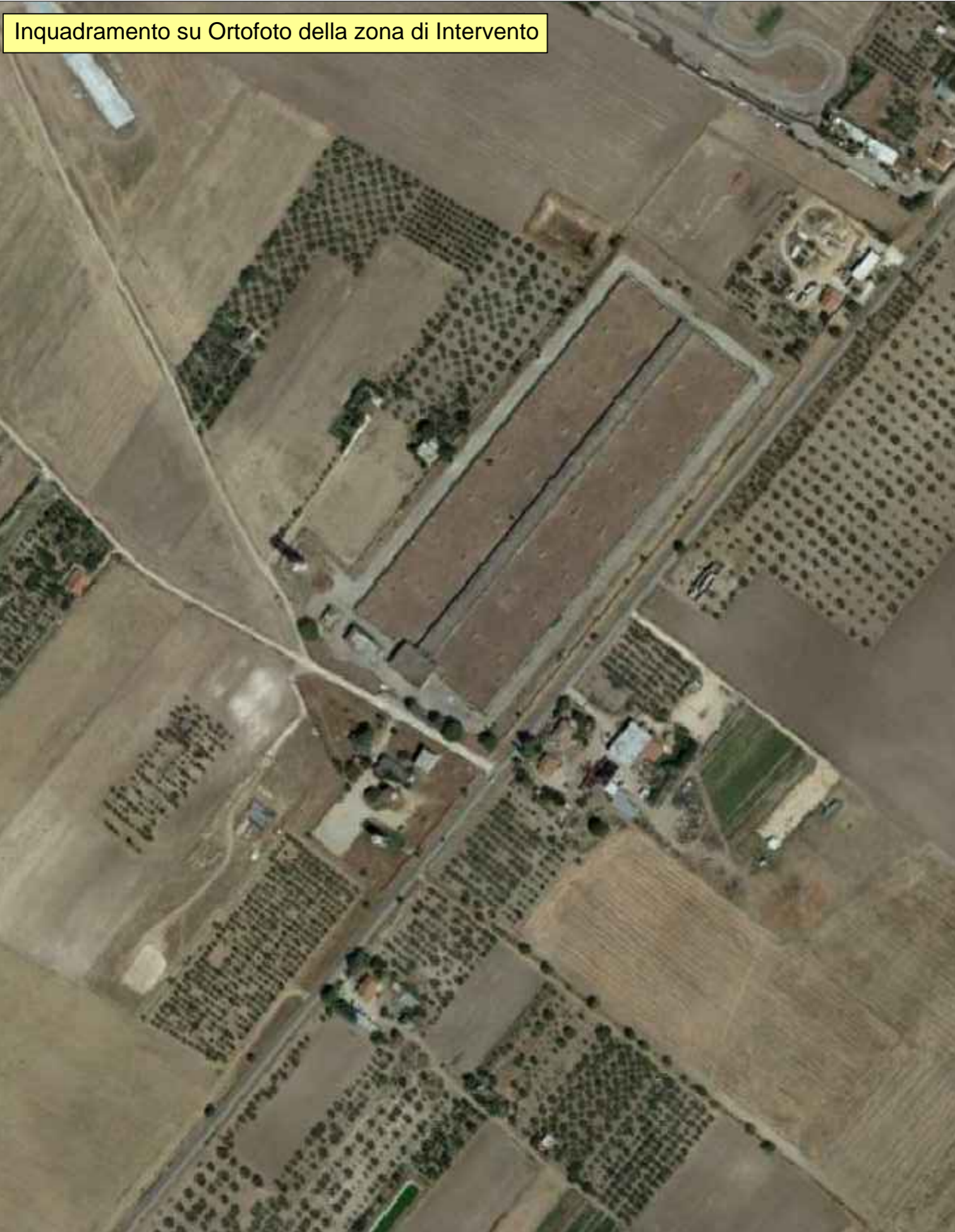
Inquadramento su Ortofoto della zona di intervento