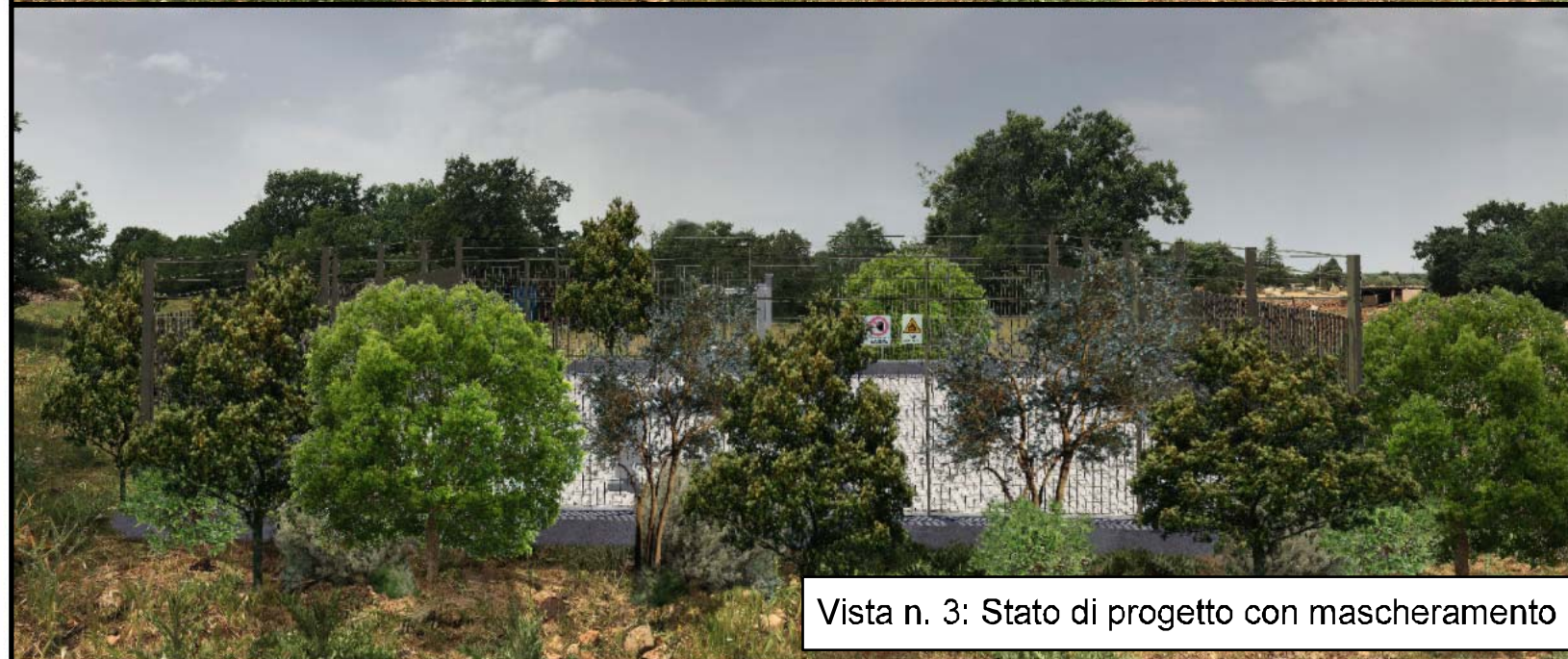
Vista n. 3: Stato di progetto con mascheramento