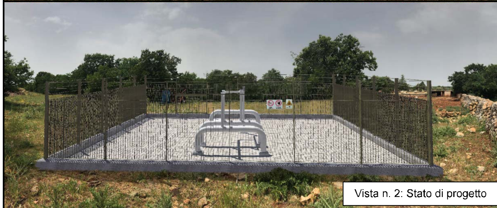
Vista n. 2: Stato di progetto