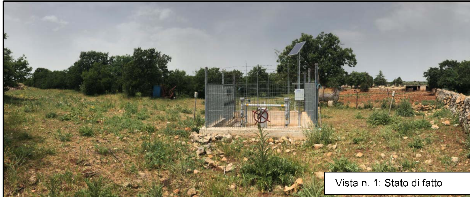
Vista n. 1: Stato di fatto