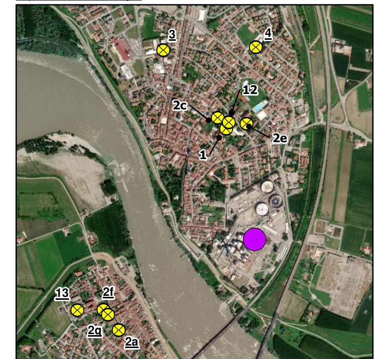
Inquadramento di dettaglio