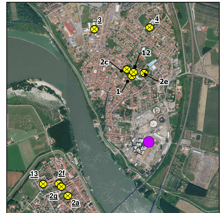
Inquadramento di dettaglio