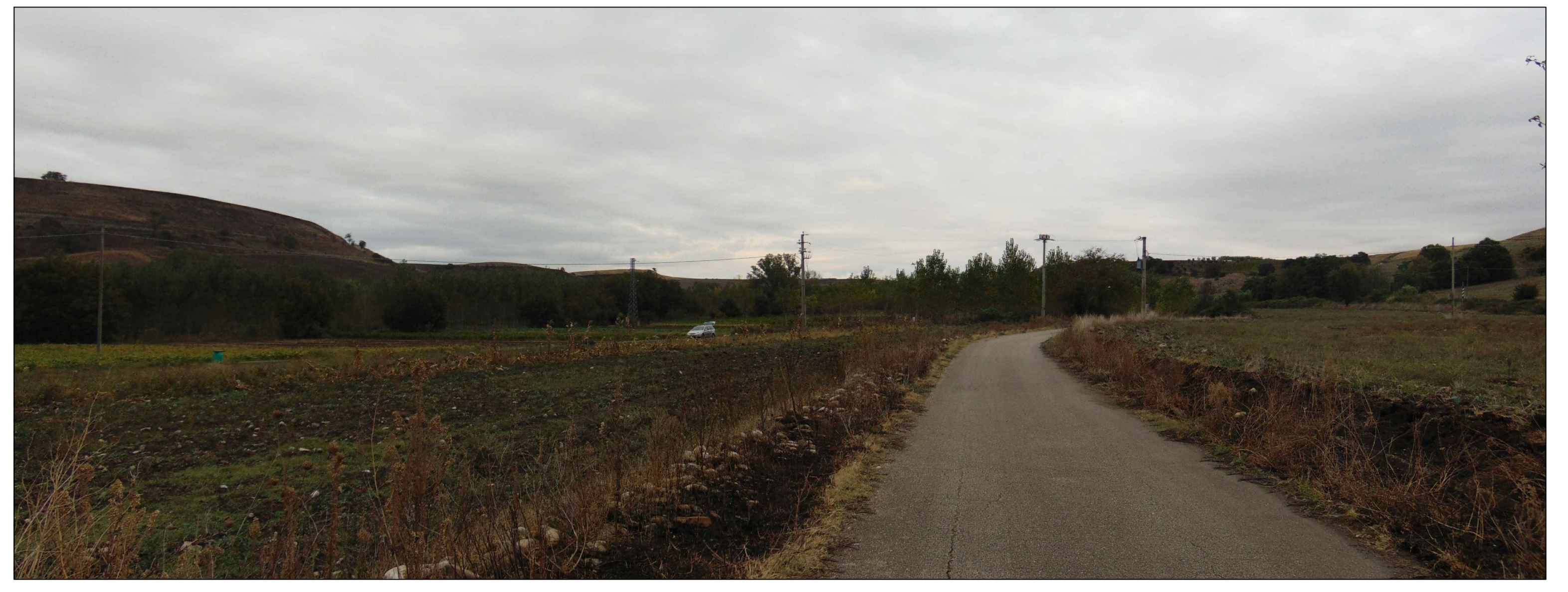
Panoramica - Stato di Fatto - Stato di progetto

DESCRIZIONE DELLA SCENA E DEGLI IMPATTI L'area archeologica Tufarello si trova a circa 9 km dall'impianto di progetto, ai limiti più esterni dell'area di impatto potenziale. L'area non è una zona archeologica delineata, ma considerata potenziale, anche se ad oggi non presenta rinvenimenti archeologici visibili. La scena visibile a partire dal punto in esame non presenta alcun elemento di particolare pregio, infatti si tratta di una vista molto ricorrente nell'ampia zona esaminata caratterizzata da colori uniformi, tipici dei terreni arati, con alternanza di qualche alberatura sparsa, e nessun elemento di particolare pregio arricchisce la vista. La scena si presenta particolarmente piatta e statica, senza elementi che possano attrarre l'osservatore verso una vista in profondità. L'impianto di progetto è coperto dai rilievi posti sul fondo della scena, pertanto non risulta visibile.