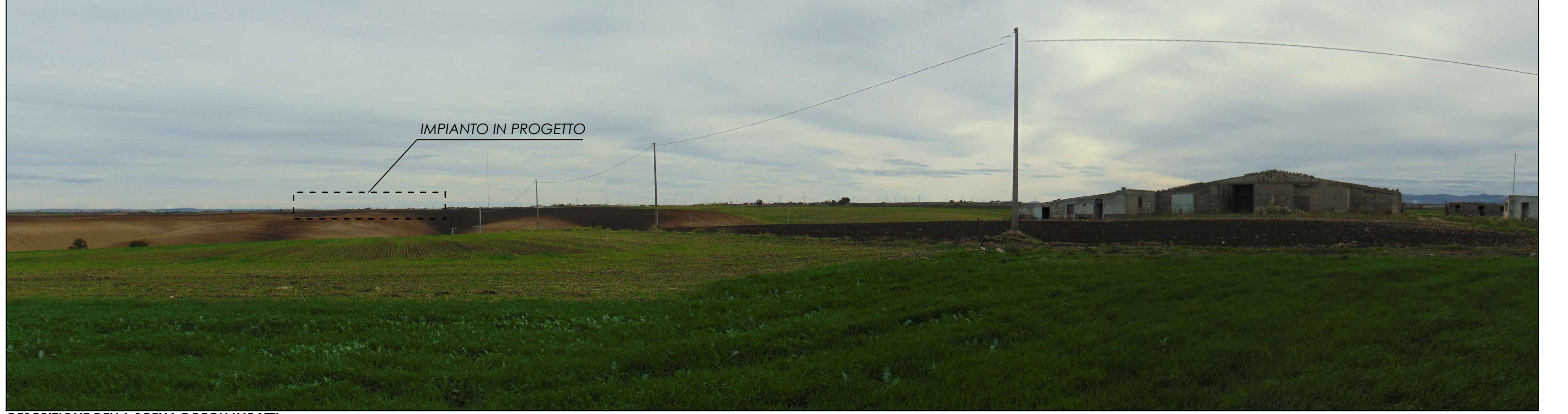
Panoramica - Stato di Progetto