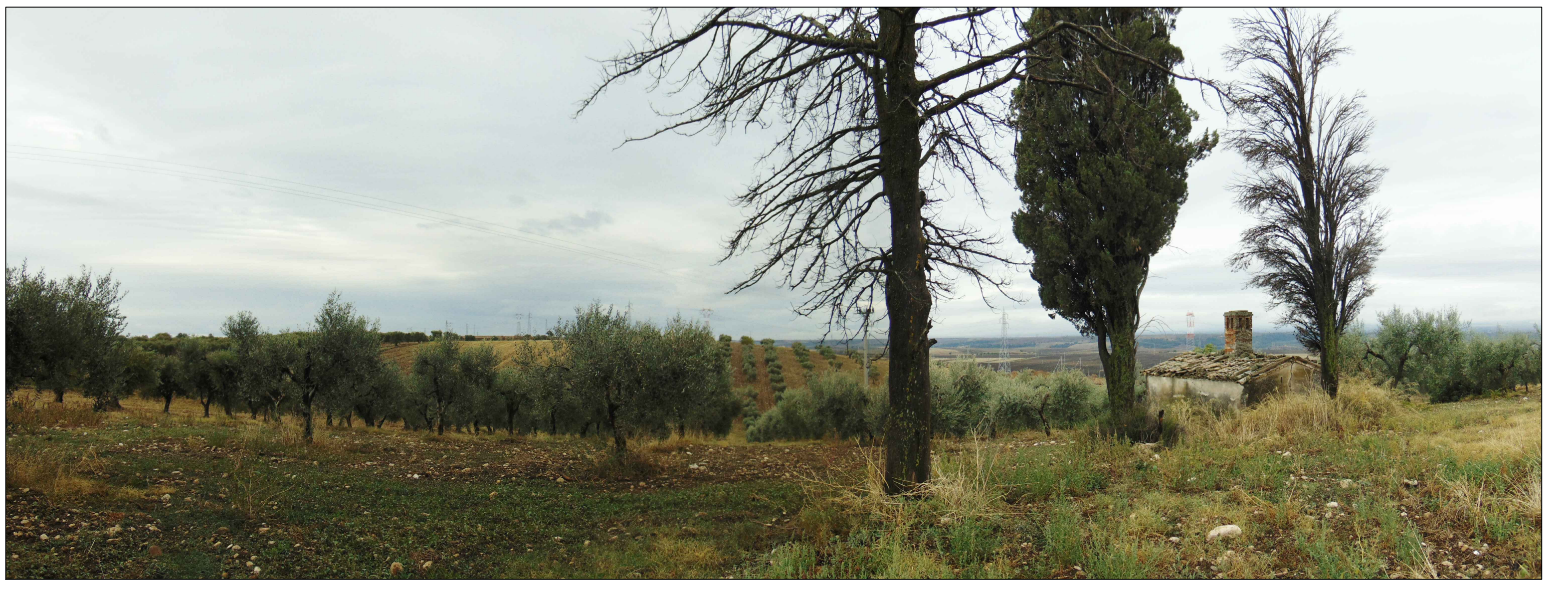
Panoramica - Stato di Fatto - Stato di progetto

DESCRIZIONE DELLA SCENA E DEGLI IMPATTI La masseria Trentangeli è un bene monumentale ubicato nel comune di Venosa, distante circa 4 km dal centro urbano e circa 10,5 km dalle turbine più vicine dell'impianto eolico proposto. Anche in questo caso la masseria, pur essendo ubicata all'esterno dell'AIP è stata presa in considerazione perché ricadente all'interno di uno dei comuni più rilevanti dal punto di vista storico-architettonico della zona. Come si può osservare dalla panoramica proposta a partire dalla masseria, la vista offre una scena di discreta qualità visuale, comprendendo numerosi elementi di caratteristiche diverse. In primo piano è possibile ammirare un terreno coltivato ad uliveto, ed altri uliveti posti in maniera ordinata sul secondo piano di visuale costituito da un piccolo pianoro posto a sinistra della scena. Sullo sfondo, verso la destra, lo sguardo arriva molto in profondità dove è possibile ammirare l'enorme pianoro tipica delle aree in esame. Quest'ultimo è caratterizzato anche da una discreta qualità scenica dovuta all'alternanza di aree boschive ad aree seminative. Tuttavia anche in questa scena numerosi elementi verticali antropici costruiti dai tralicci dell'alta tensione sono disseminati ovunque, disturbando leggermente la vista. In ogni caso, per questa immagine, l'impianto eolico proposto non è visibile, trovandosi sulla sinistra della scena e coperto dal pianoro in primo piano.