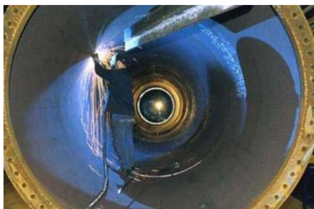
Figura 10 - interno di una torre

All'interno delle torri si installano vari componenti come scale, cavi elettrici di connessione dell'aerogeneratore, porta della torre e casse di connessione. Tali torri sono fabbricate con piastre di acciaio di spessore tra i 16 e i 36 mm, che alla fine sono ricoperte al loro esterno e al loro interno da strati di pittura per proteggerli dalla corrosione. All'interno delle torri si installano una serie di piattaforme, scale e linee di vita per l'accesso degli operai all'interno della navicella. Tali componenti sono fabbricati in acciaio o ferro galvanizzato visto che all'interno sono protetti dalla corrosione.