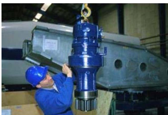
Figura 6 - Motori e riduttori di giri

Nel caso in cui tali componenti si trovino in forte stato di deterioramento verranno riciclati come rottame.