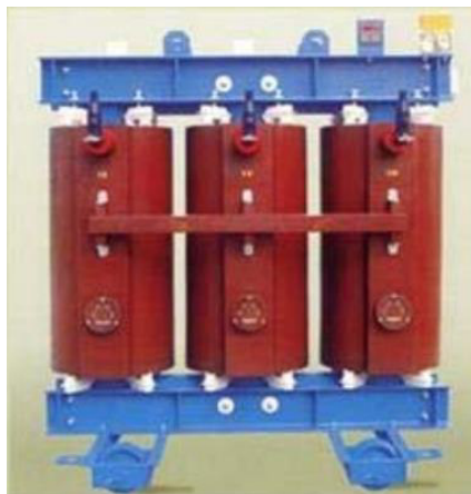
Figura 8 - Trasformatore