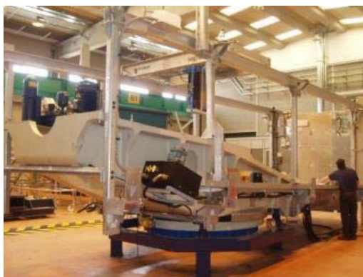
Figura 9 - Telaio anteriore e posteriore

Il telaio anteriore si compone di un pezzo e il telaio posteriore di due pezzi. Tutti questi pezzi si assemblano tra di loro per formare la base sulla quale si posiziona la totalità dei componenti meccanici, elettrici ed idraulici che formano la navicella. Allo stesso modo, al telaio anteriore si assembla la corona di giro e gli ancoraggi di supporto alla torre di appoggio dell'aerogeneratore. I telai sono fabbricati in acciaio meccanizzato saldato e la sua struttura è progettata specificatamente per il supporto della struttura della navicella, pertanto una volta arrivati alla fine della vita utile dell'aerogeneratore vengono riciclati come rottame.