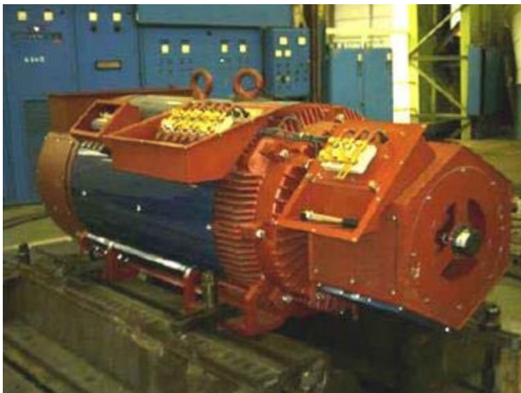
Figura 5 - Generatore