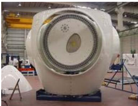
Figura 1 - Il mozzo