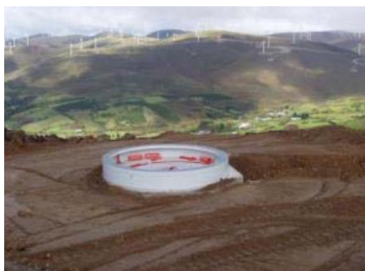
Figura 12 - Fondazione

La base in calcestruzzo si può eliminare tramite il deposito in discarica dei rifiuti inerti o può essere riciclata come agglomerato per usi nelle costruzioni civili.