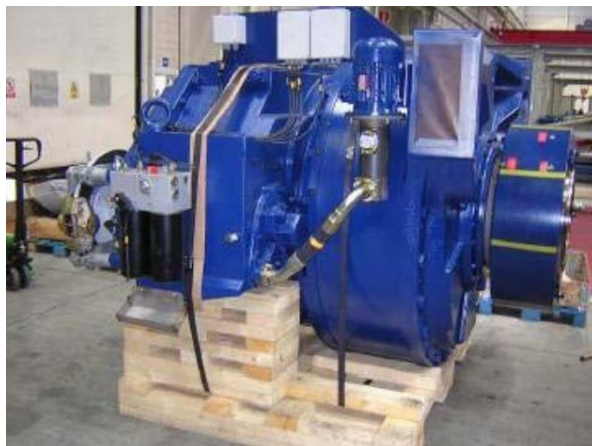
Figura 3 - Moltiplicatore