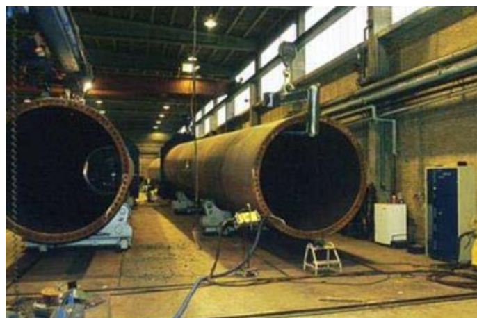
Figura 11 - torri in acciaio

Nel caso in cui questi componenti vengano smantellati, il loro riutilizzo nell'ambito nel settore eolico si presenta poco fattibile, a causa delle esigenze di resistenza strutturale che richiede l'installazione degli aerogeneratori. Allo stesso modo, i nuovi aerogeneratori installati richiedono strutture più grandi e resistenti, per cui non è fattibile lo sfruttamento di strutture obsolete.