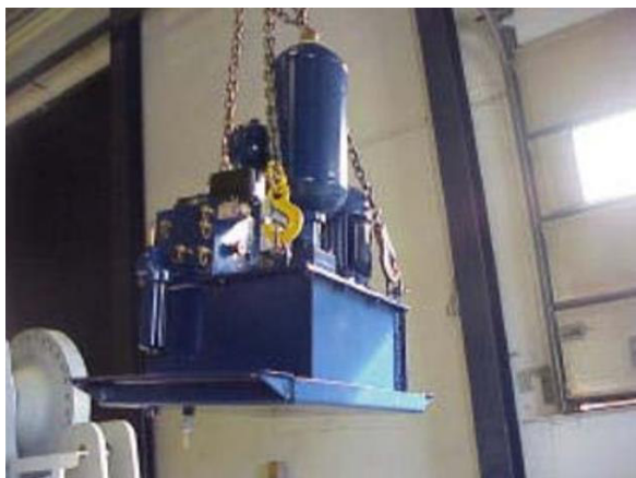
Figura 7 - Gruppo di pressione

Ha il compito di somministrare fluido idraulico ad una determinata pressione per consentire l'azionamento del sistema di captazione, orientazione e trasmissione. Lo stesso dispone di un deposito di azoto. Il sistema è fabbricato totalmente in acciaio e viene riciclato come rottame. Nel caso in cui si trovi in buono stato potrà essere riutilizzato come ricambio.