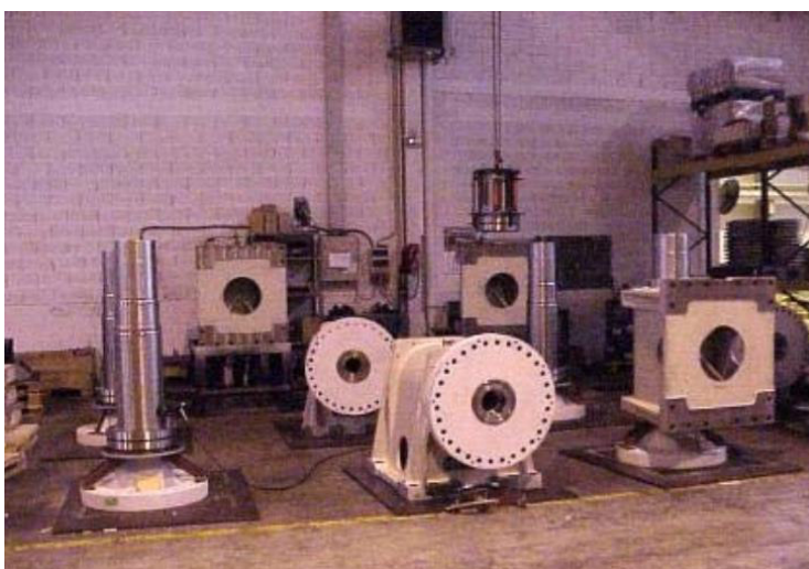
Figura 2 - Asse di bassa velocità

A causa delle sue dimensioni e della sua forma specifica differente per ogni modello di aerogeneratore e, poiché è un componente sottoposto a continua usura, non è possibile il suo riutilizzo in applicazioni parallele.