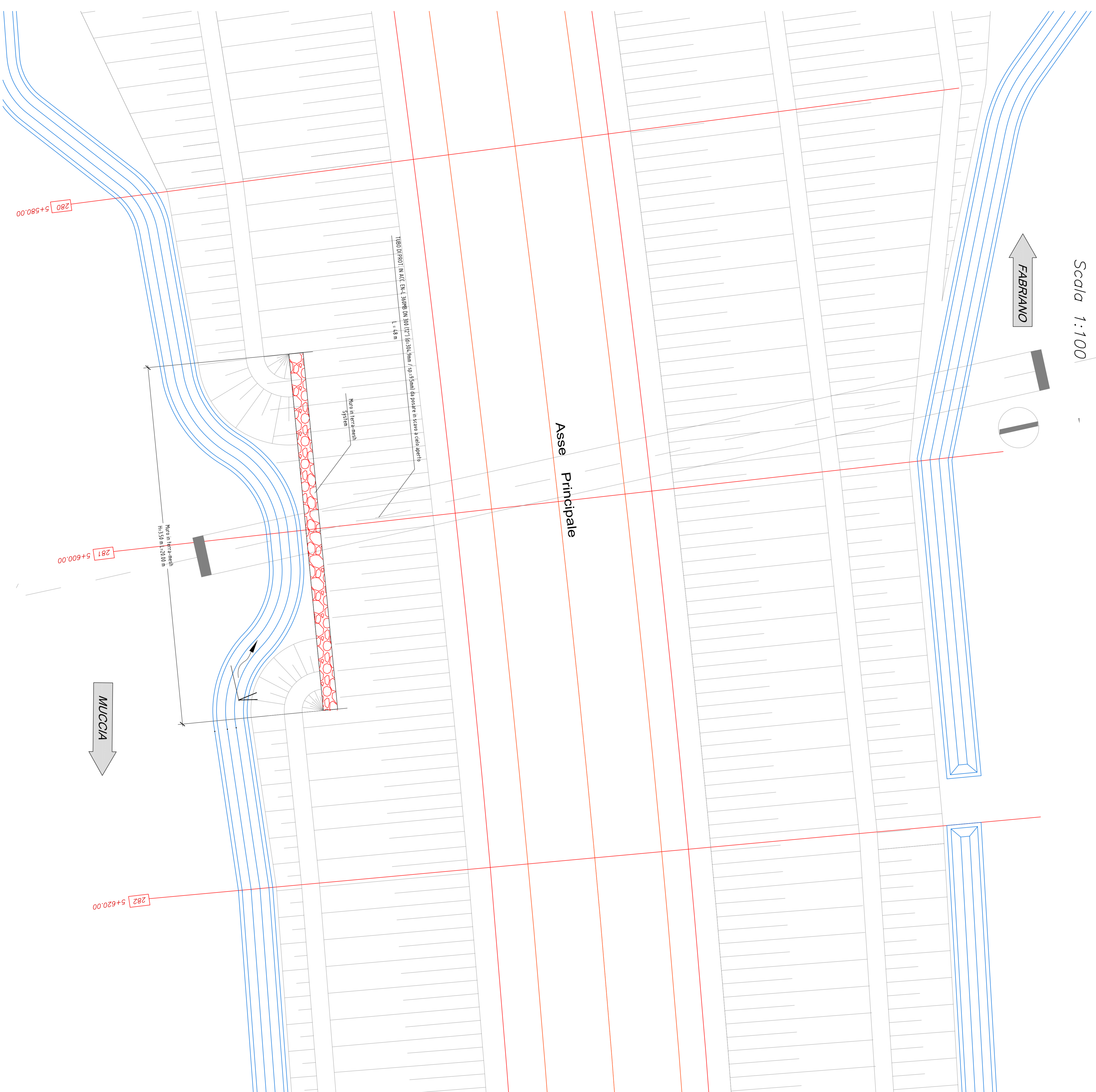
UNITA' TERRAMESH SYSTEM ASSEMBLATA IN CANTIERE