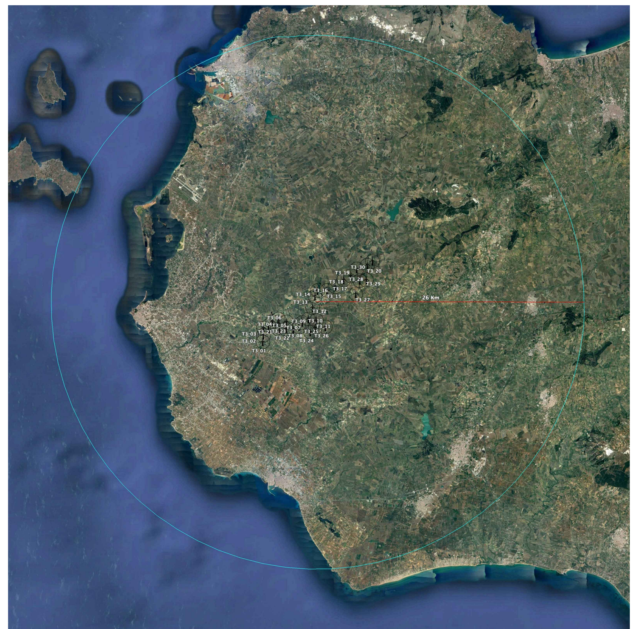
Area impatto potenziale