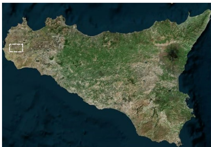
Figura 2-1: Inquadramento generale dell'area di progetto

Di seguito è riportato l'inquadramento territoriale dell'area di progetto e la configurazione proposta su ortofoto: