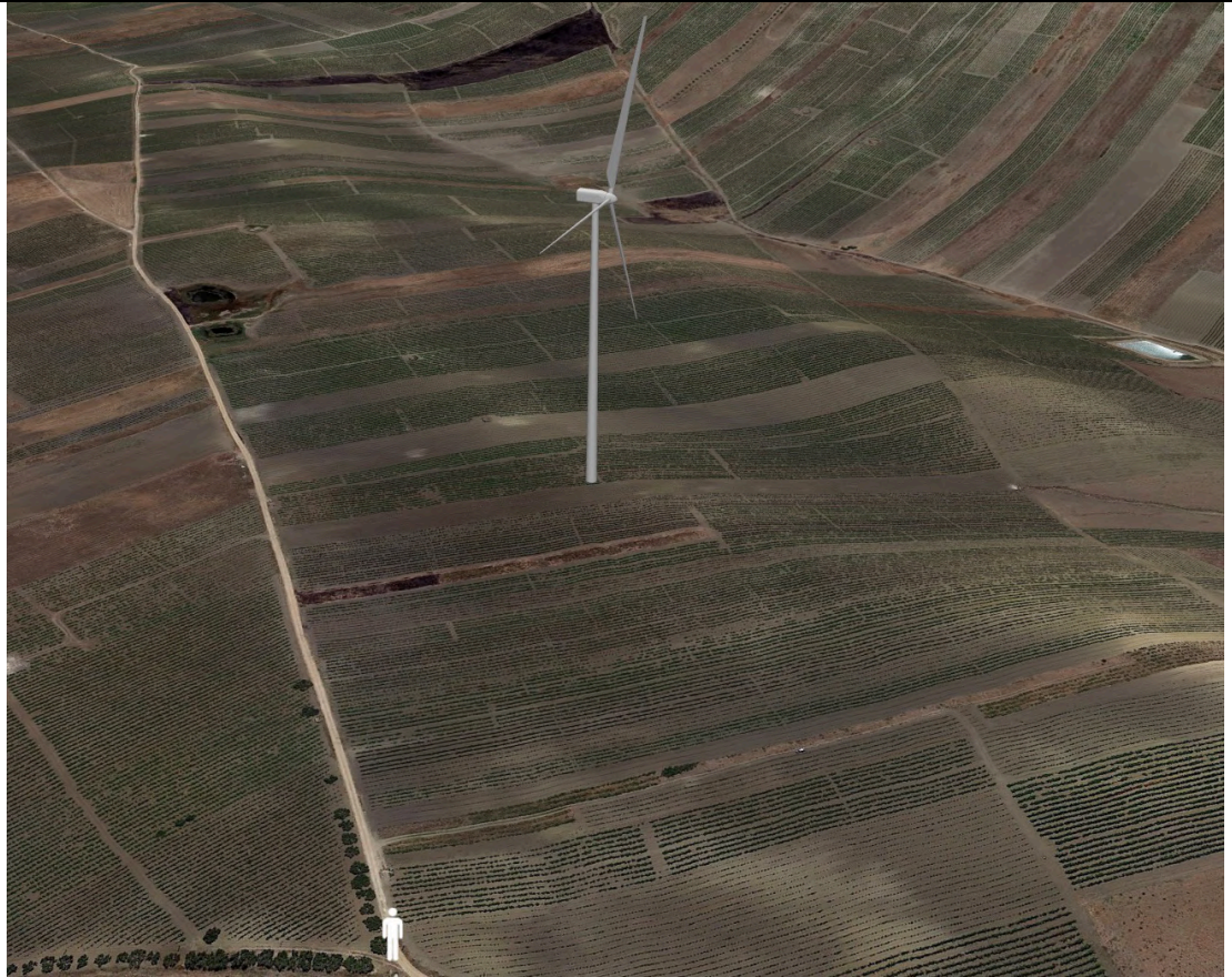
Punto di ripresa con proiezione 3D