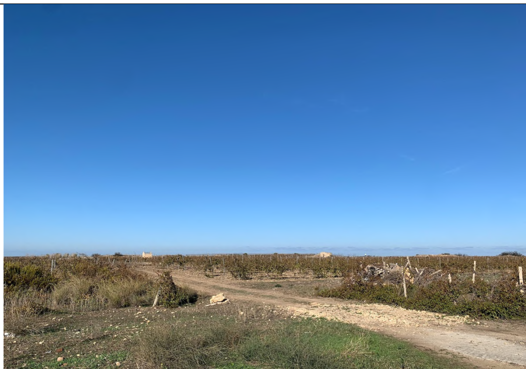
Ripresa ante operam