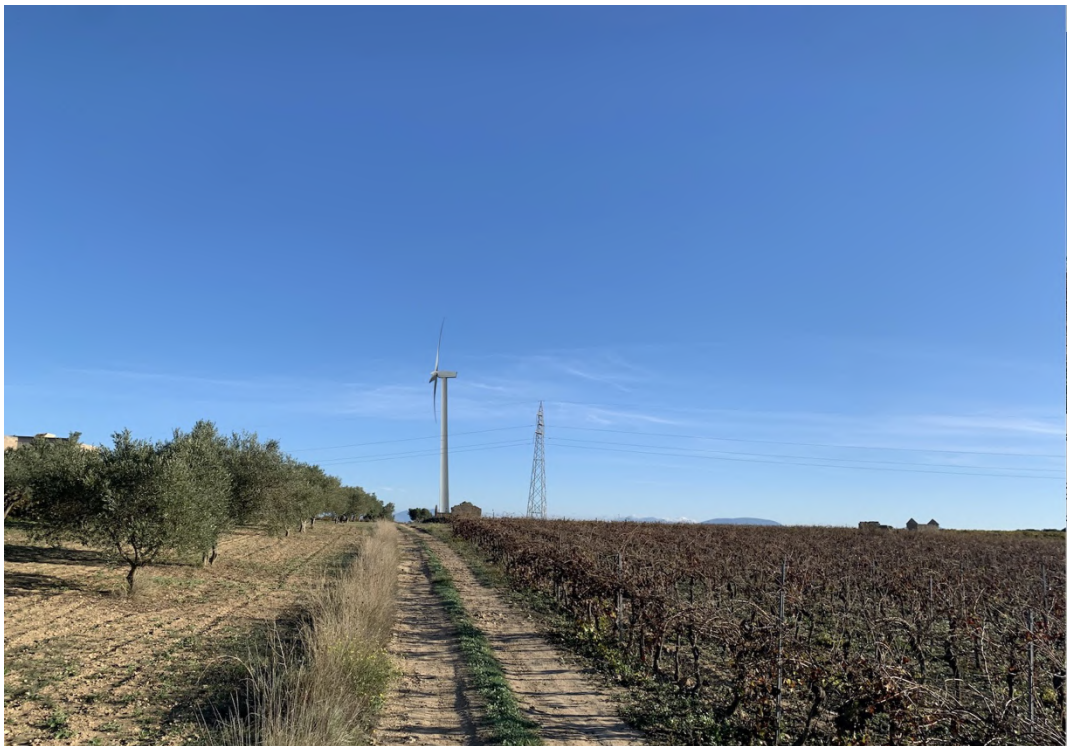
Ripresa post operam