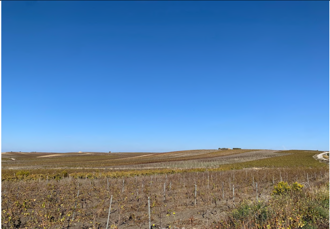
Ripresa ante operam