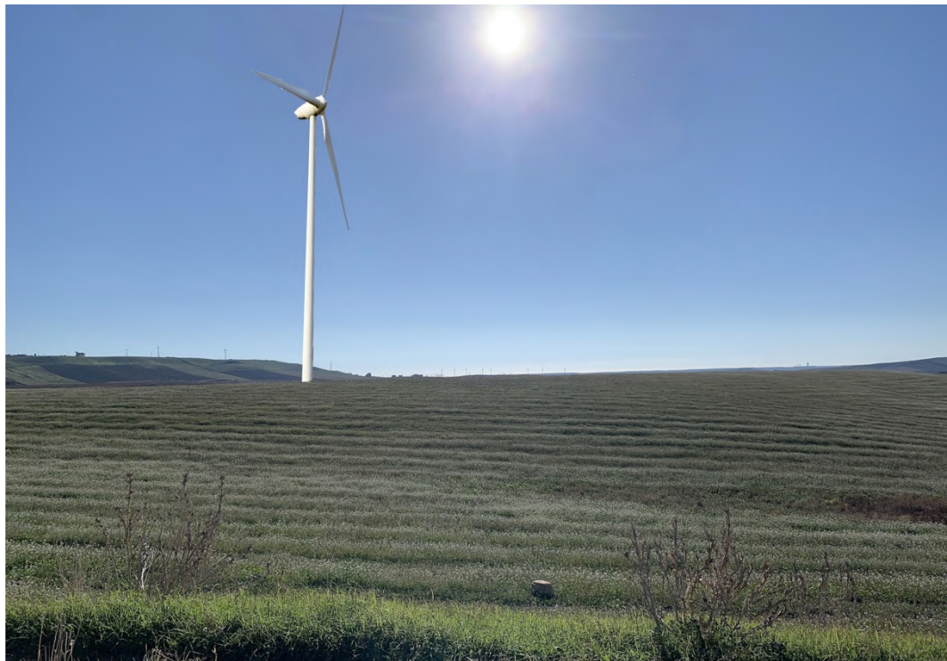
Ripresa post operam