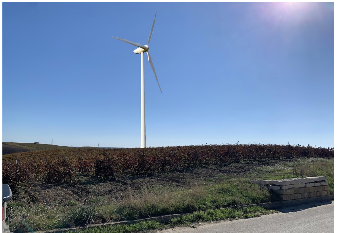
Ripresa post operam