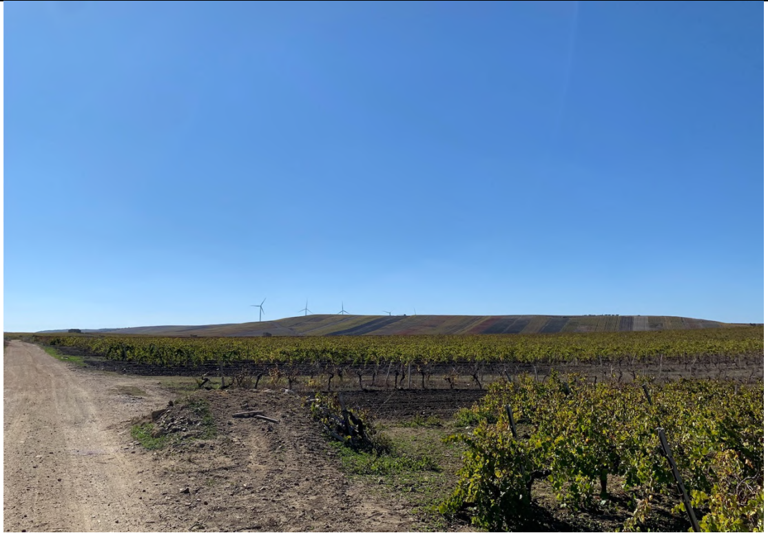
Ripresa ante operam