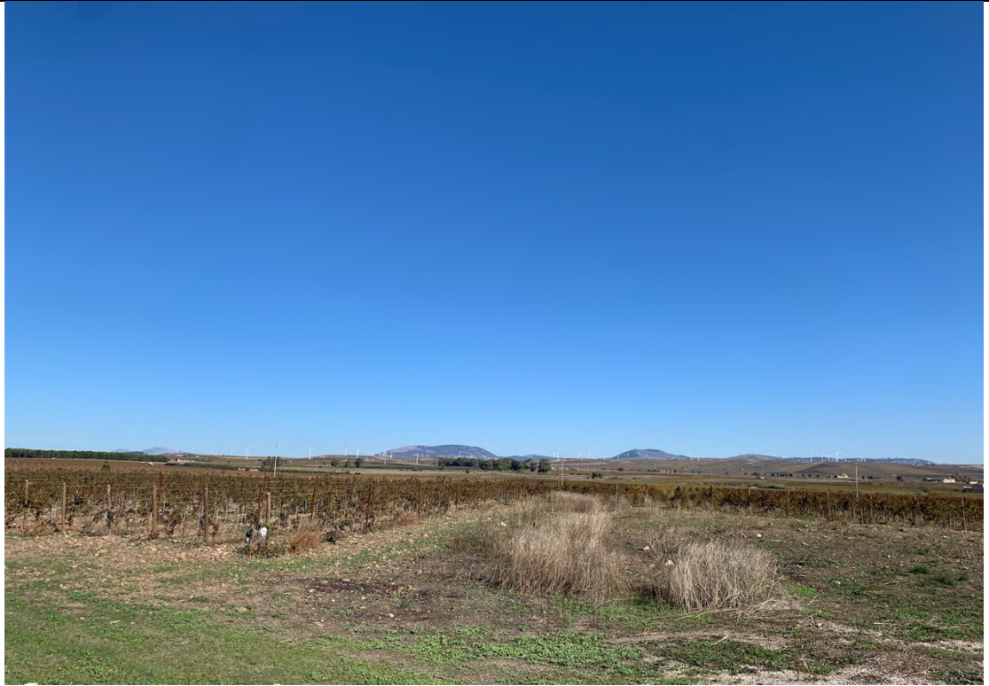
Ripresa ante operam