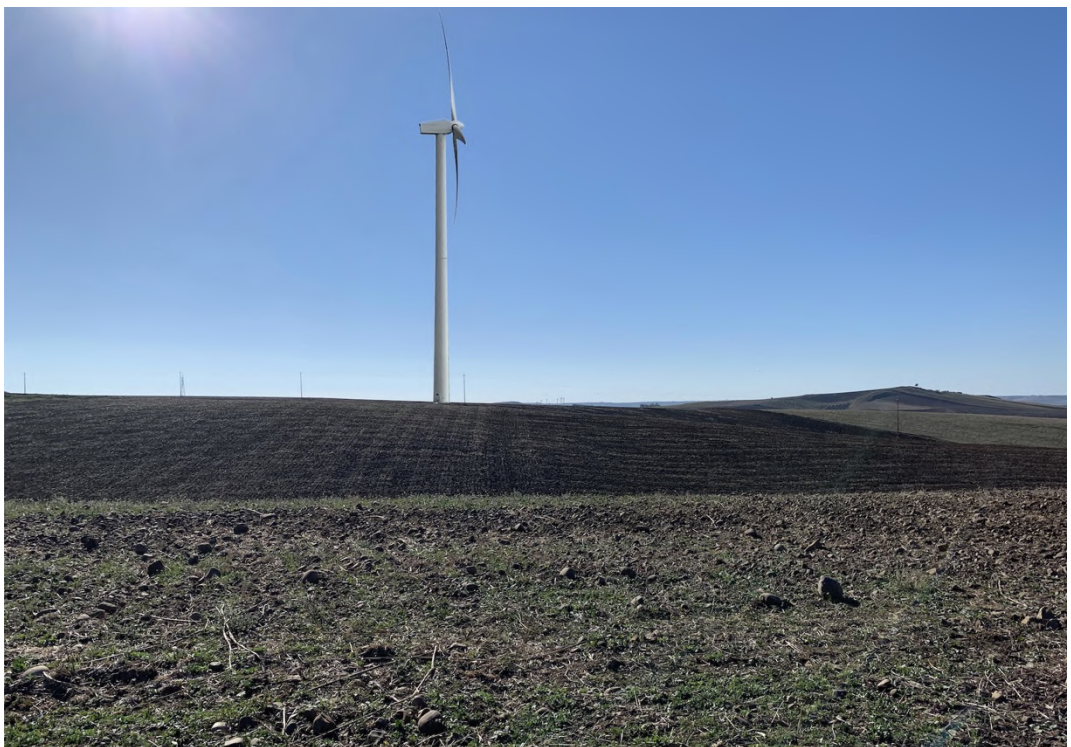
Ripresa post operam