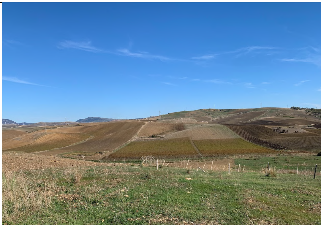
Ripresa ante operam