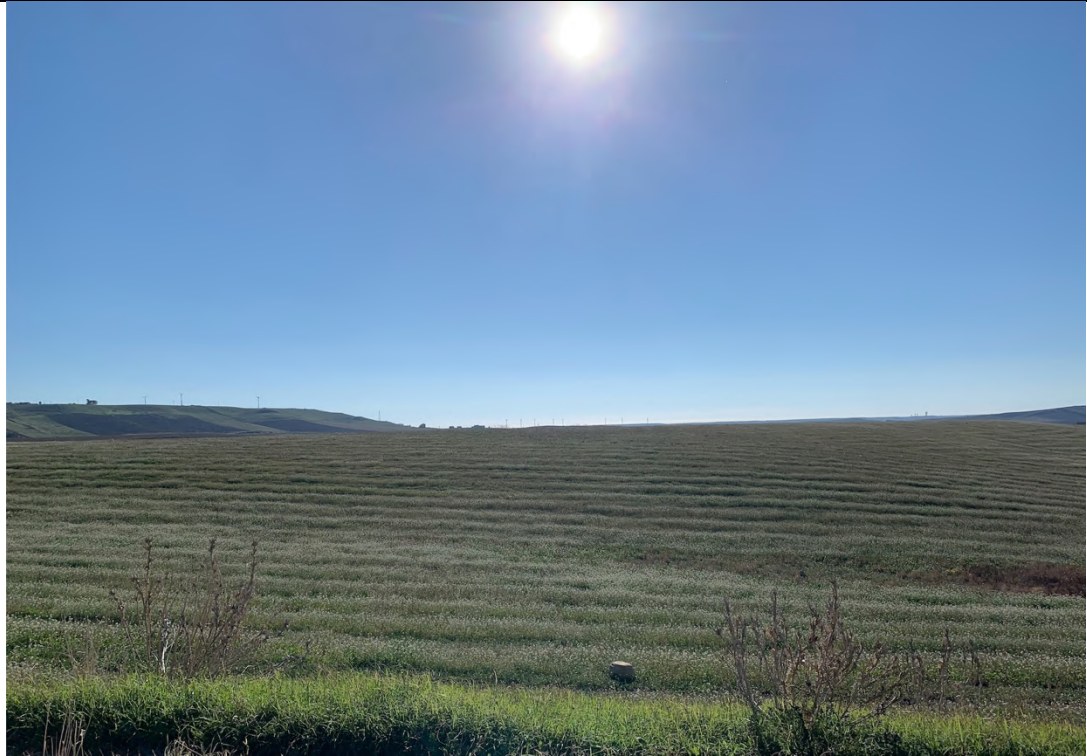
Ripresa ante operam