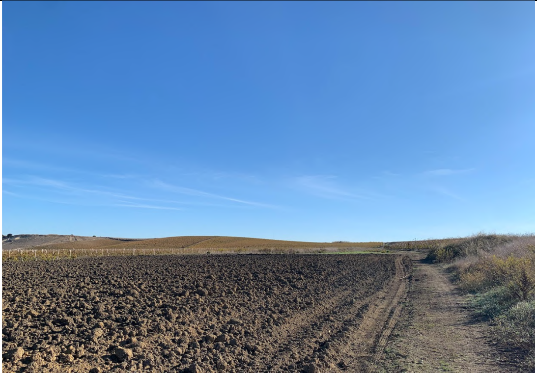
Ripresa ante operam