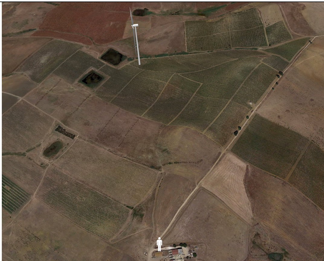
Punto di ripresa con proiezione 3D