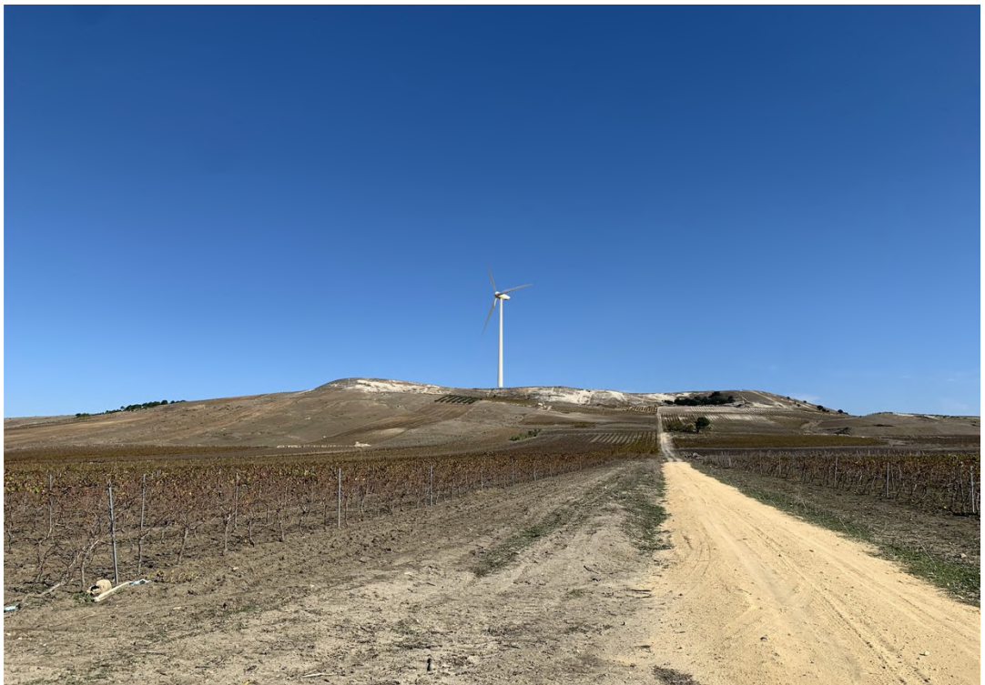
Ripresa post operam