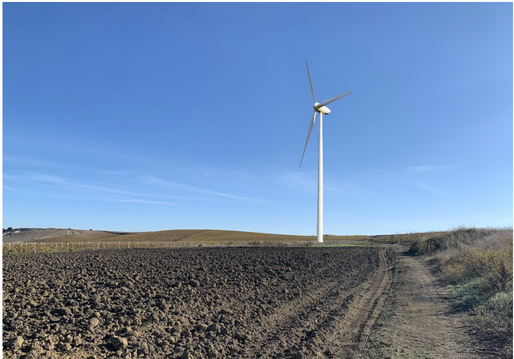
Ripresa post operam