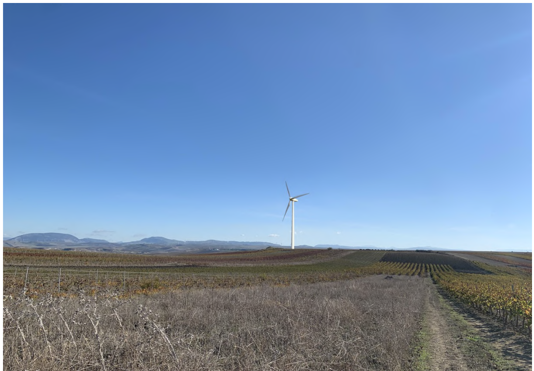
Ripresa post operam