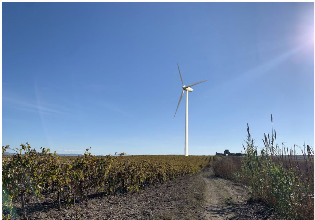
Ripresa post operam