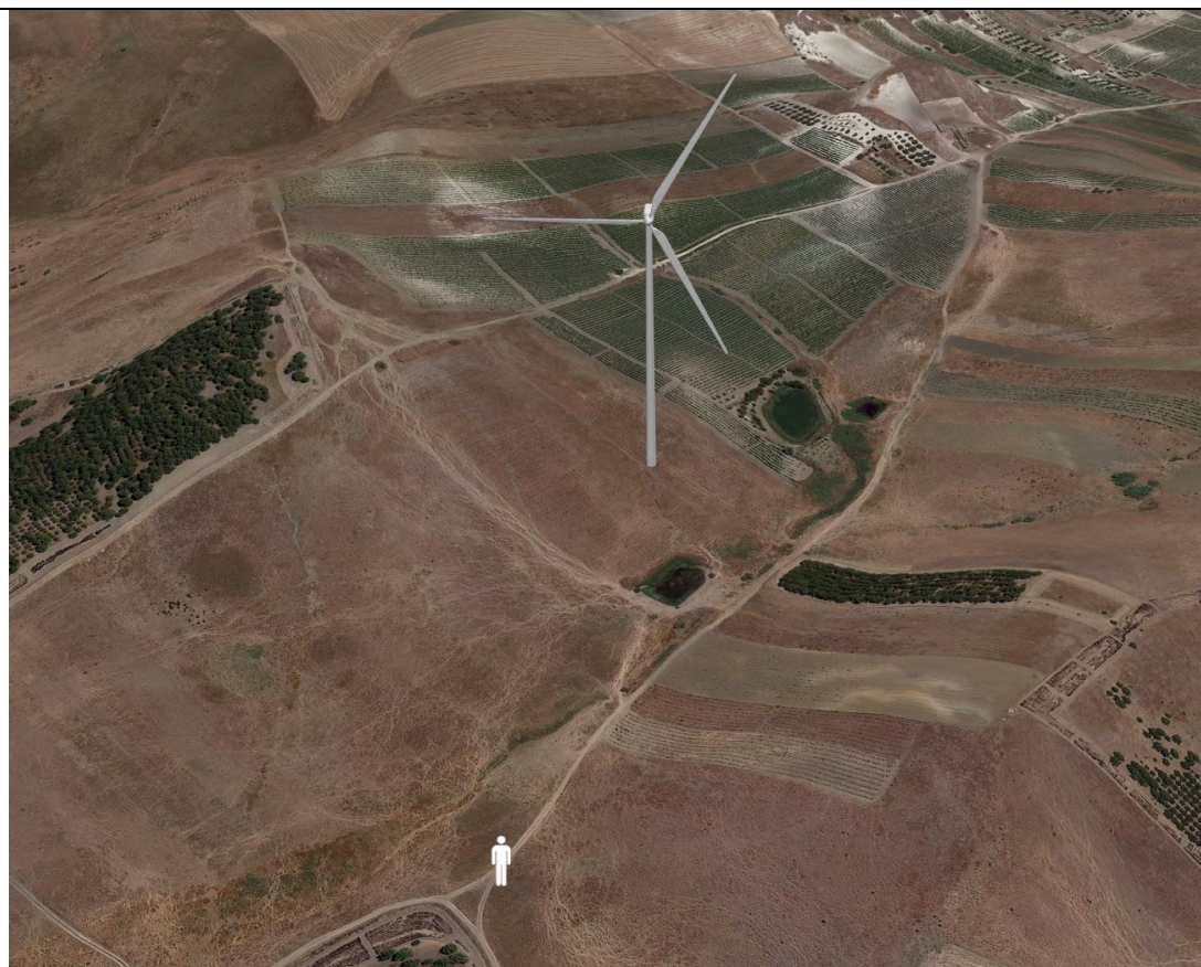
Punto di ripresa con proiezione 3D