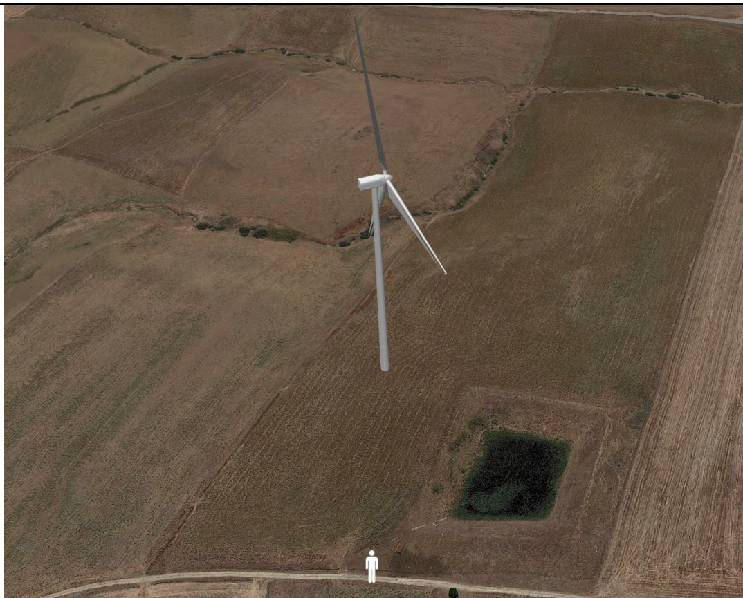
Punto di ripresa con proiezione 3D