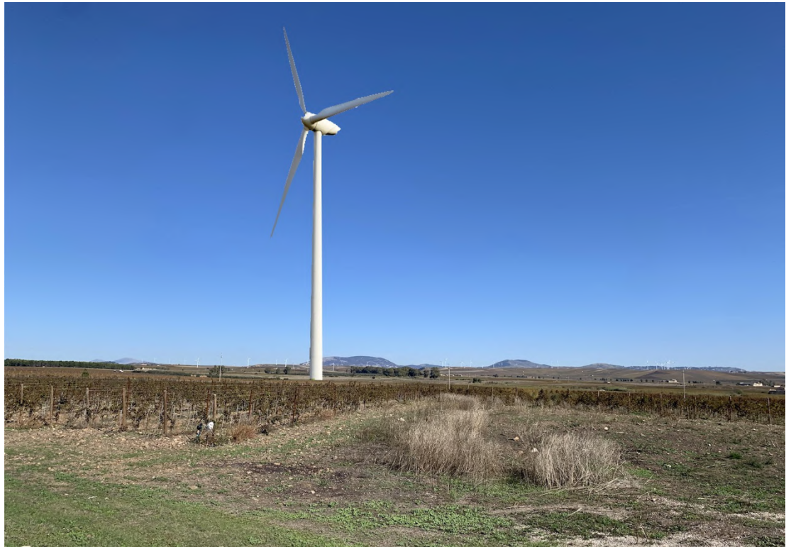
Ripresa post operam