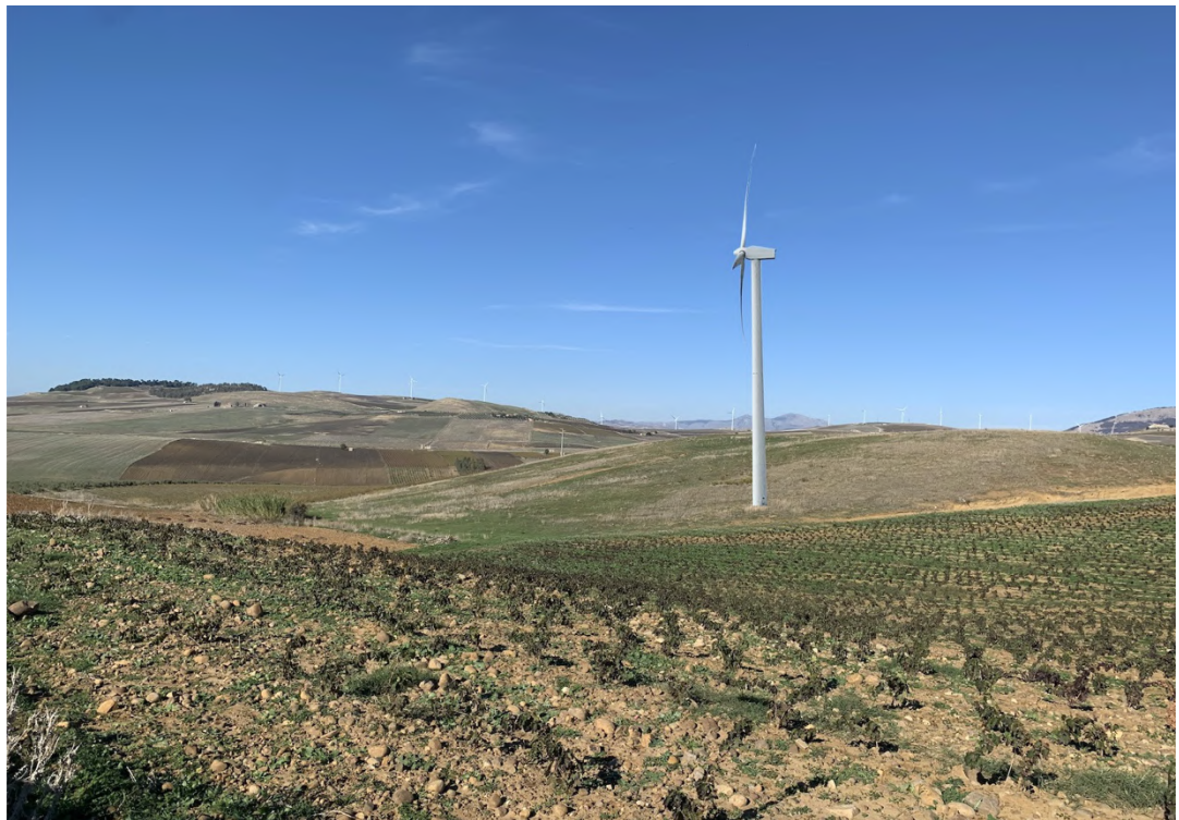
Ripresa post operam