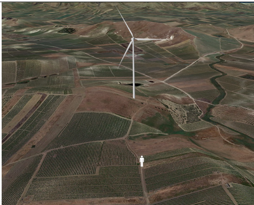
Punto di ripresa con proiezione 3D