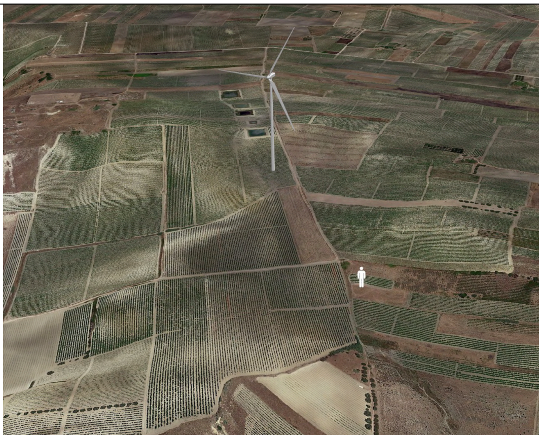
Punto di ripresa con proiezione 3D