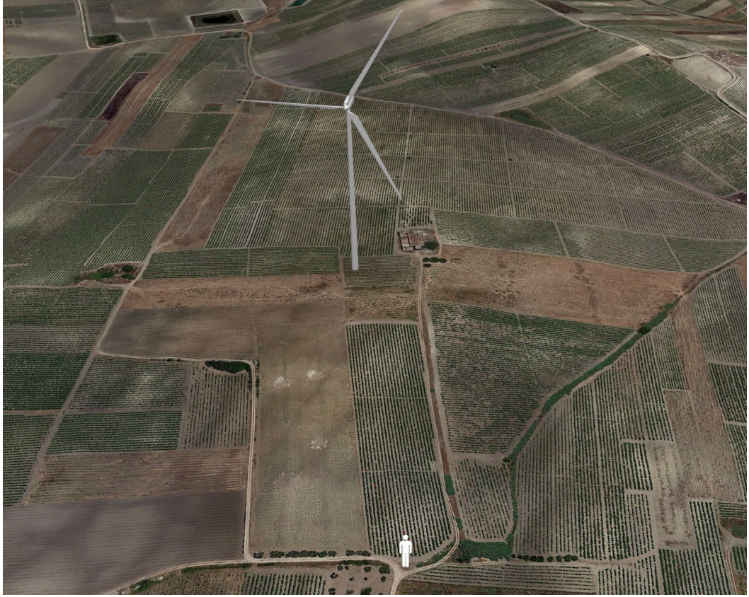
Punto di ripresa con proiezione 3D