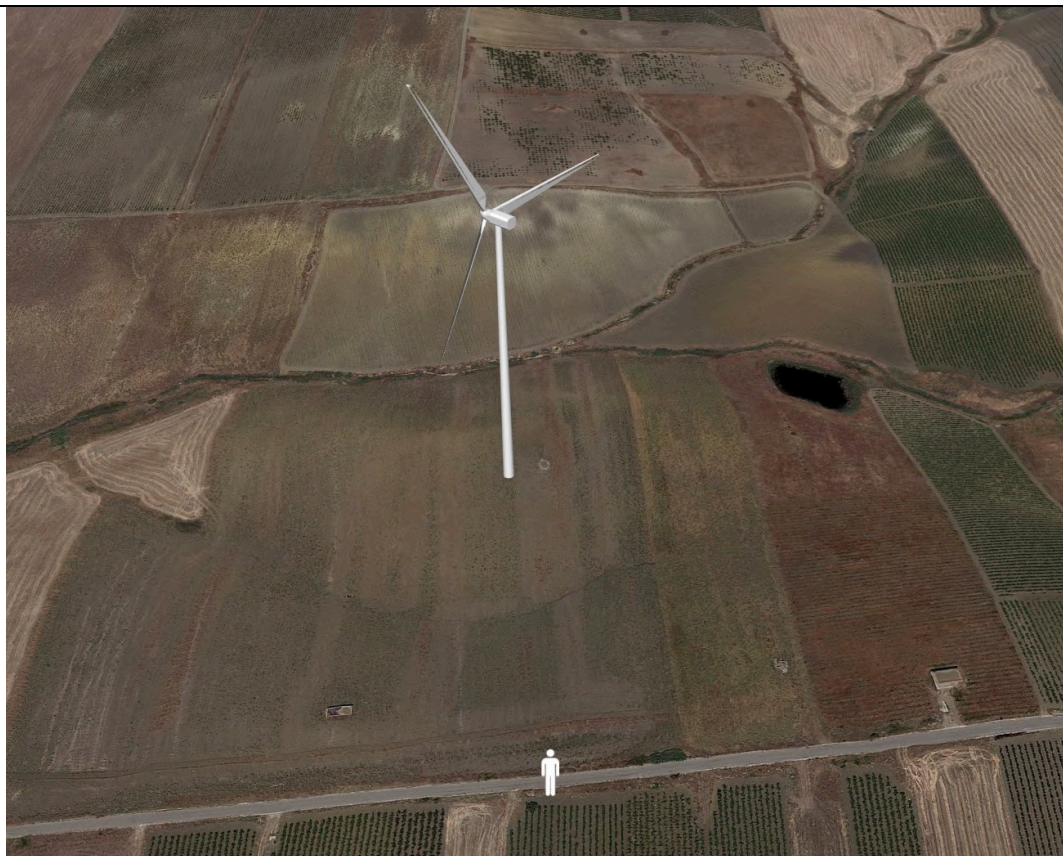
Punto di ripresa con proiezione 3D