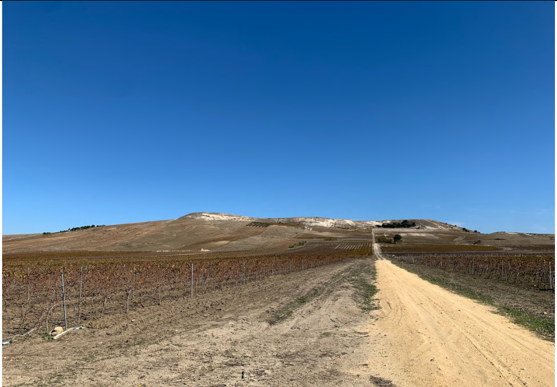
Ripresa ante operam