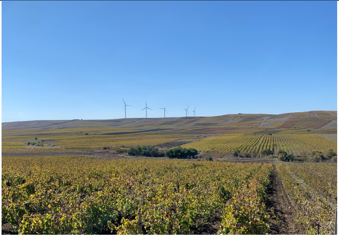
Ripresa ante operam