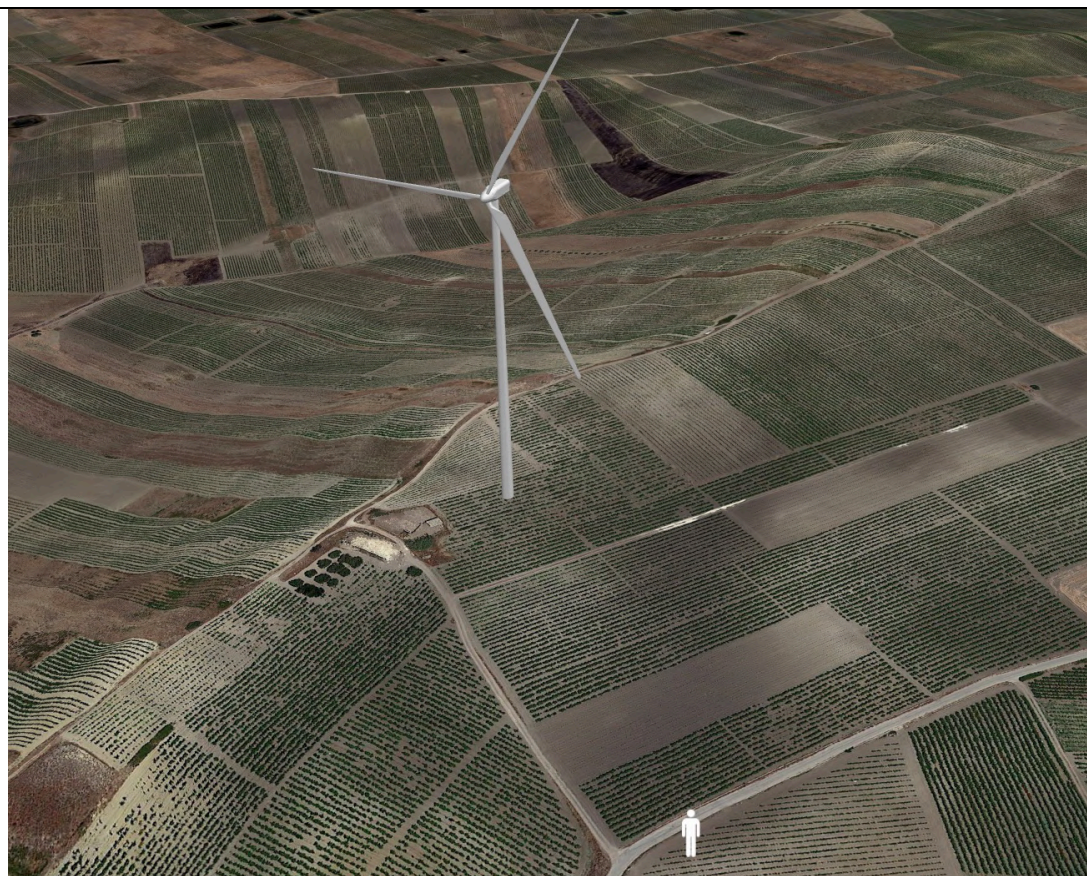
Punto di ripresa con proiezione 3D