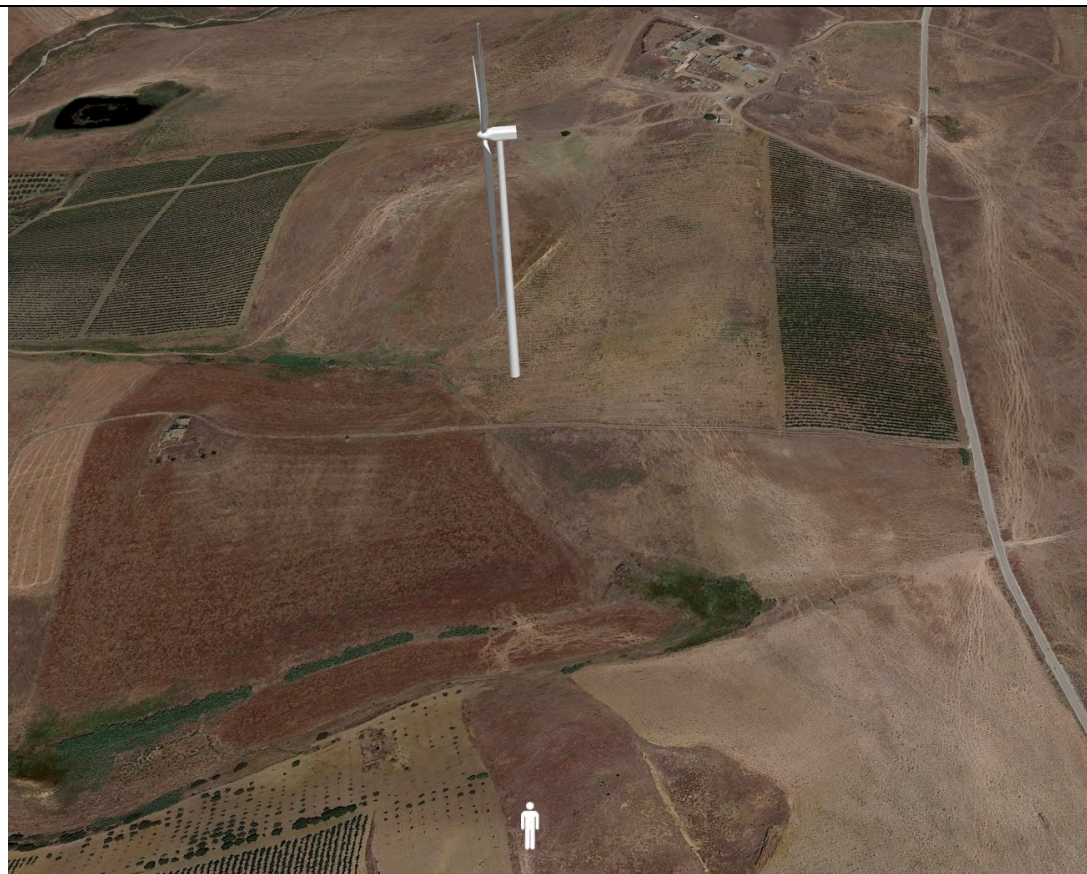
Punto di ripresa con proiezione 3D