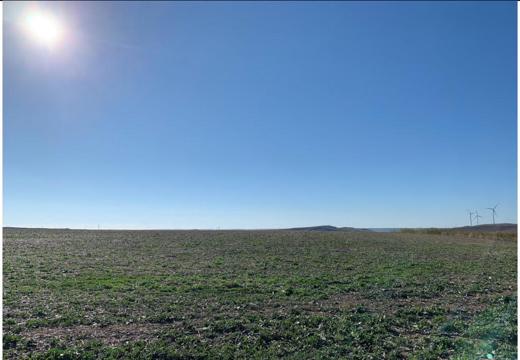
Ripresa ante operam