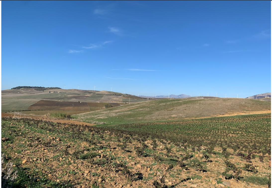
Ripresa ante operam