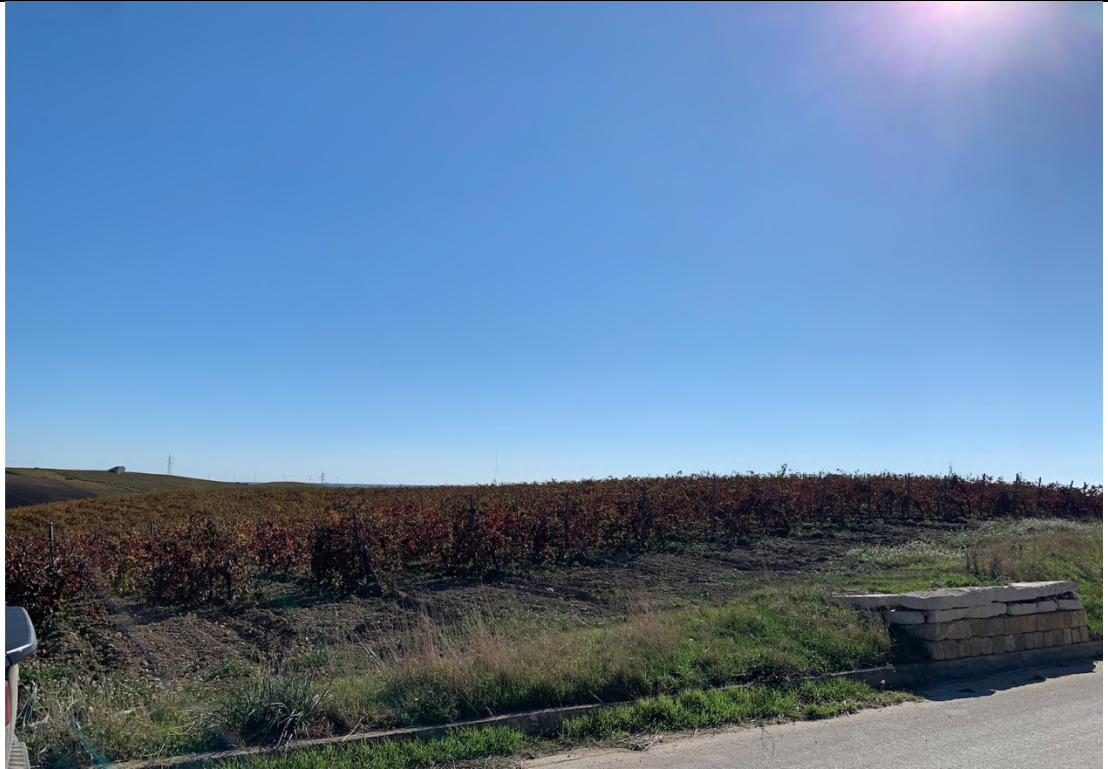
Ripresa ante operam