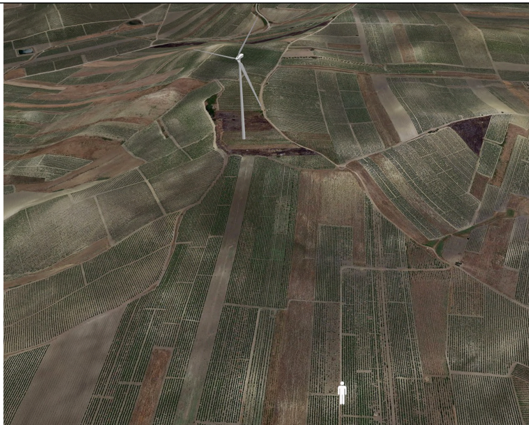
Punto di ripresa con proiezione 3D