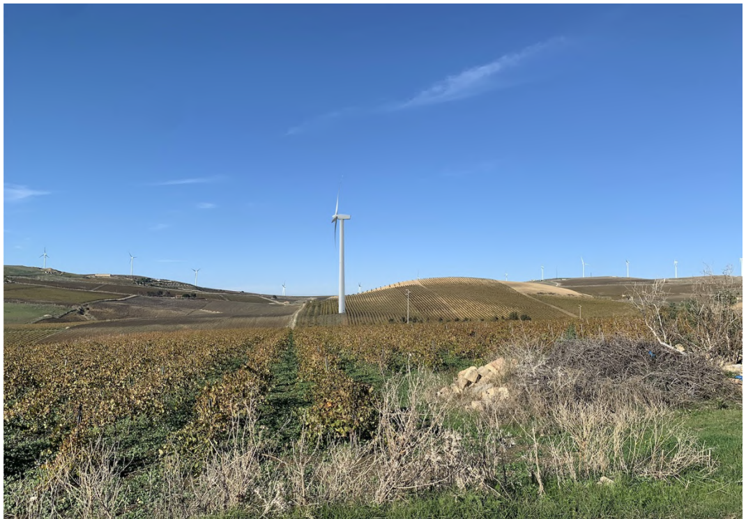
Ripresa post operam