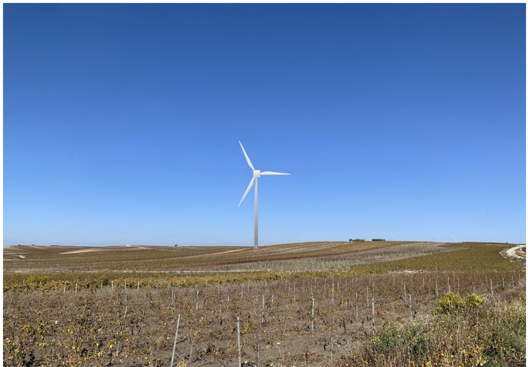
Ripresa post operam