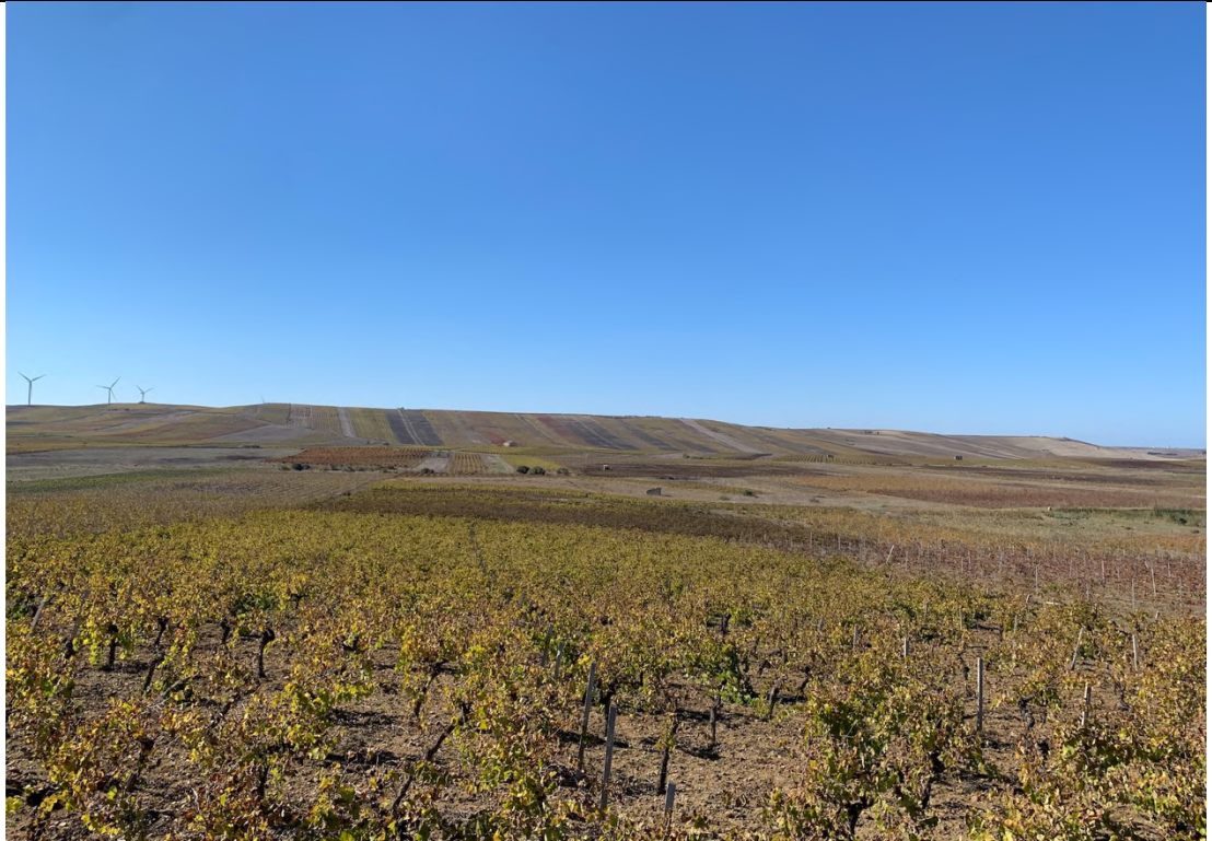
Ripresa ante operam