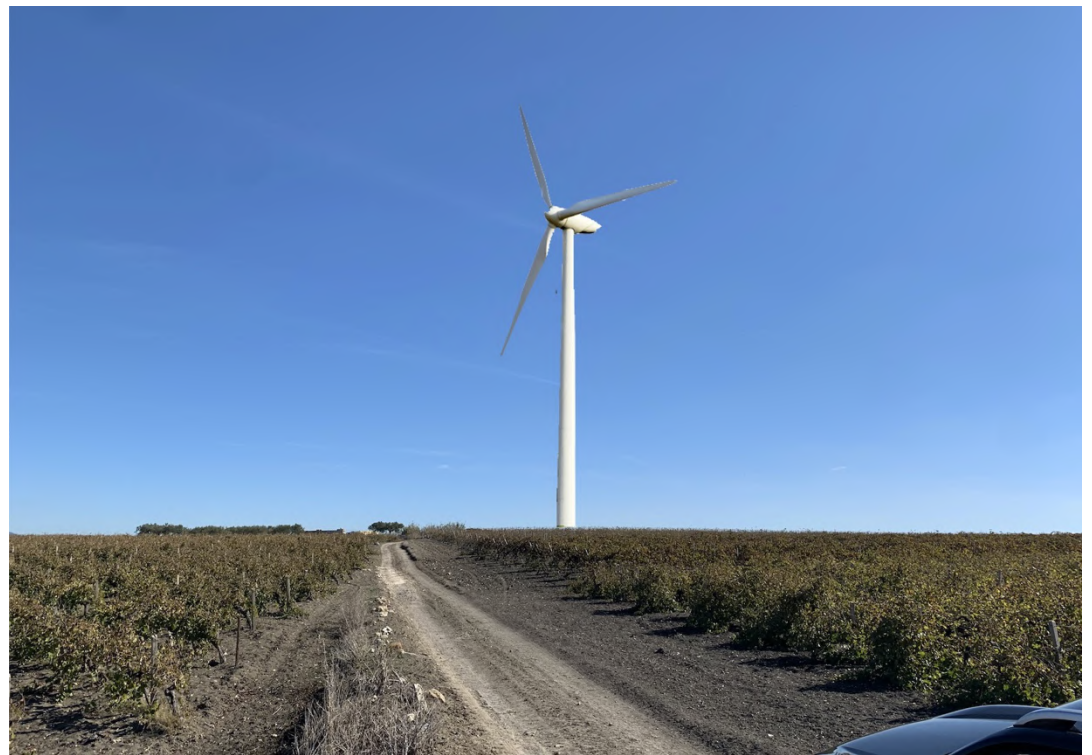
Ripresa post operam