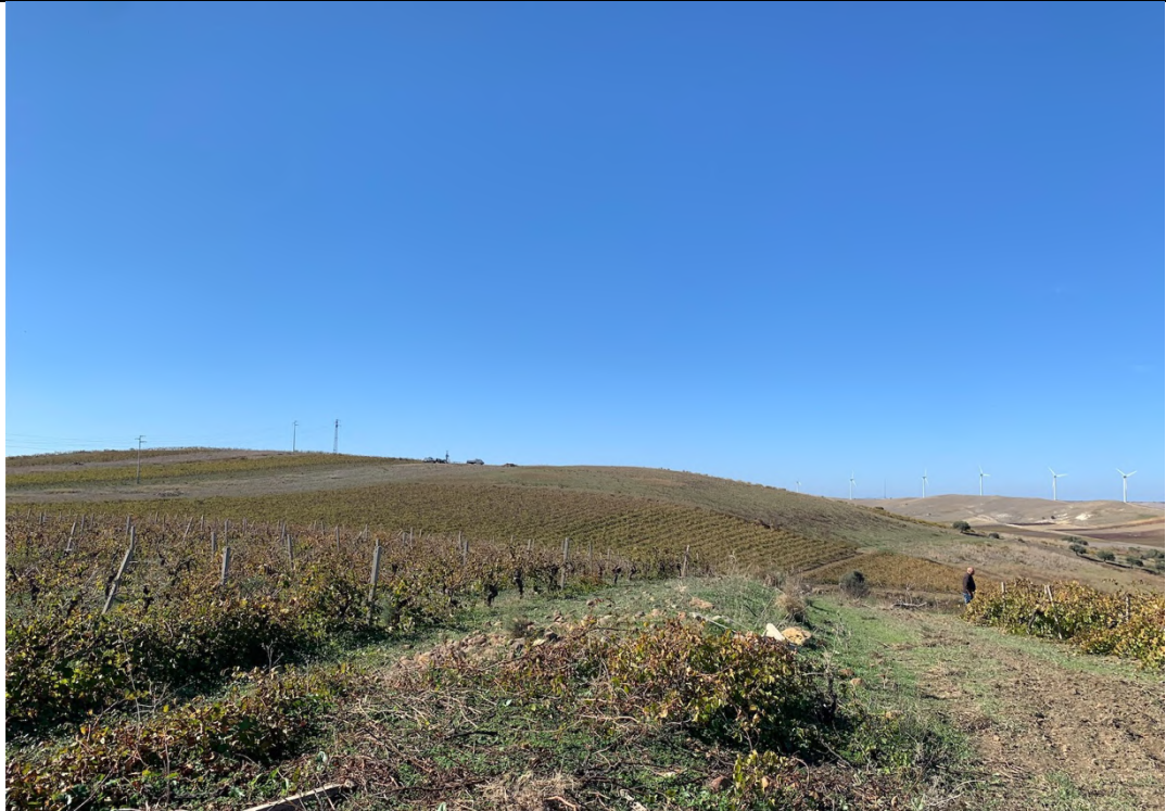
Ripresa ante operam