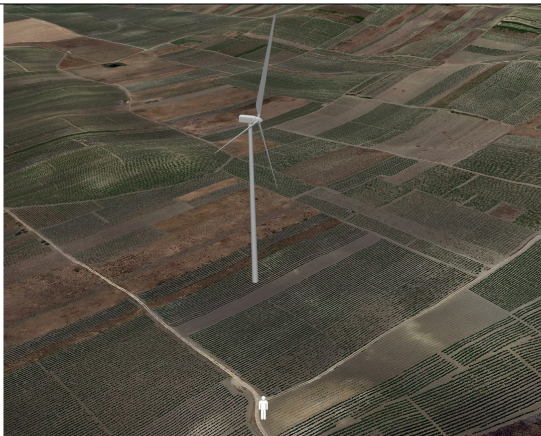
Punto di ripresa con proiezione 3D