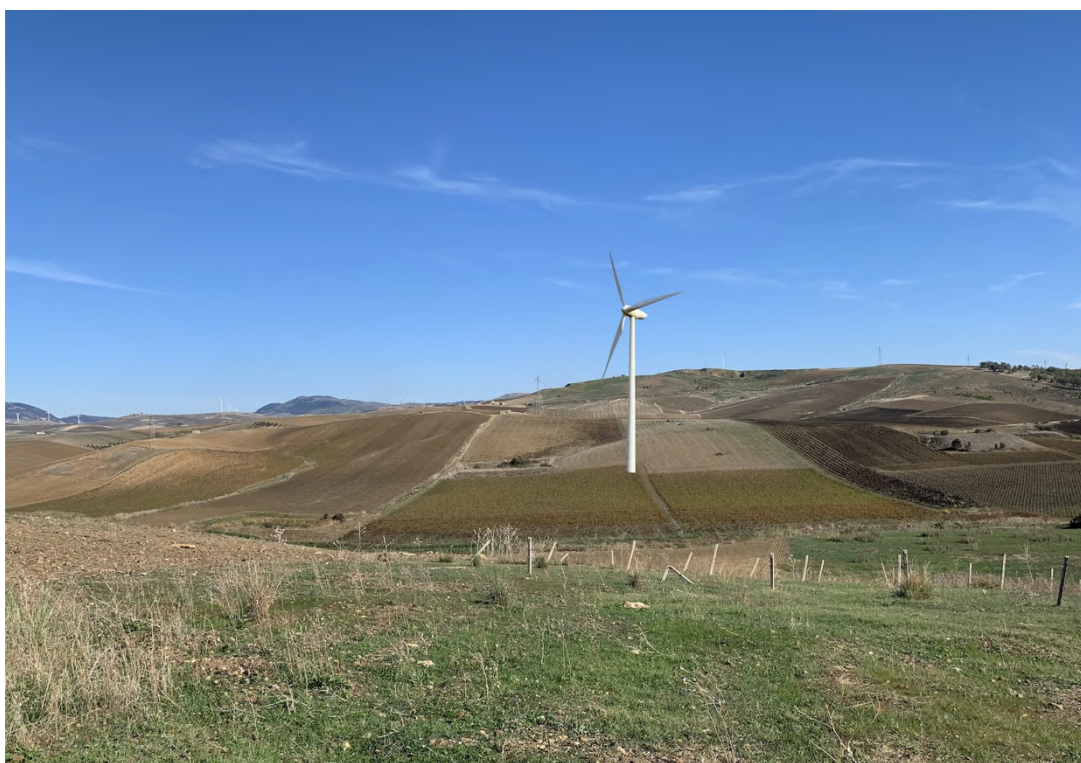
Ripresa post operam