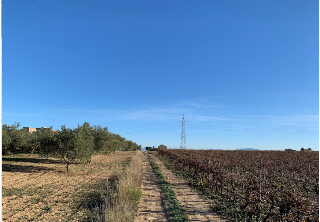
Ripresa ante operam