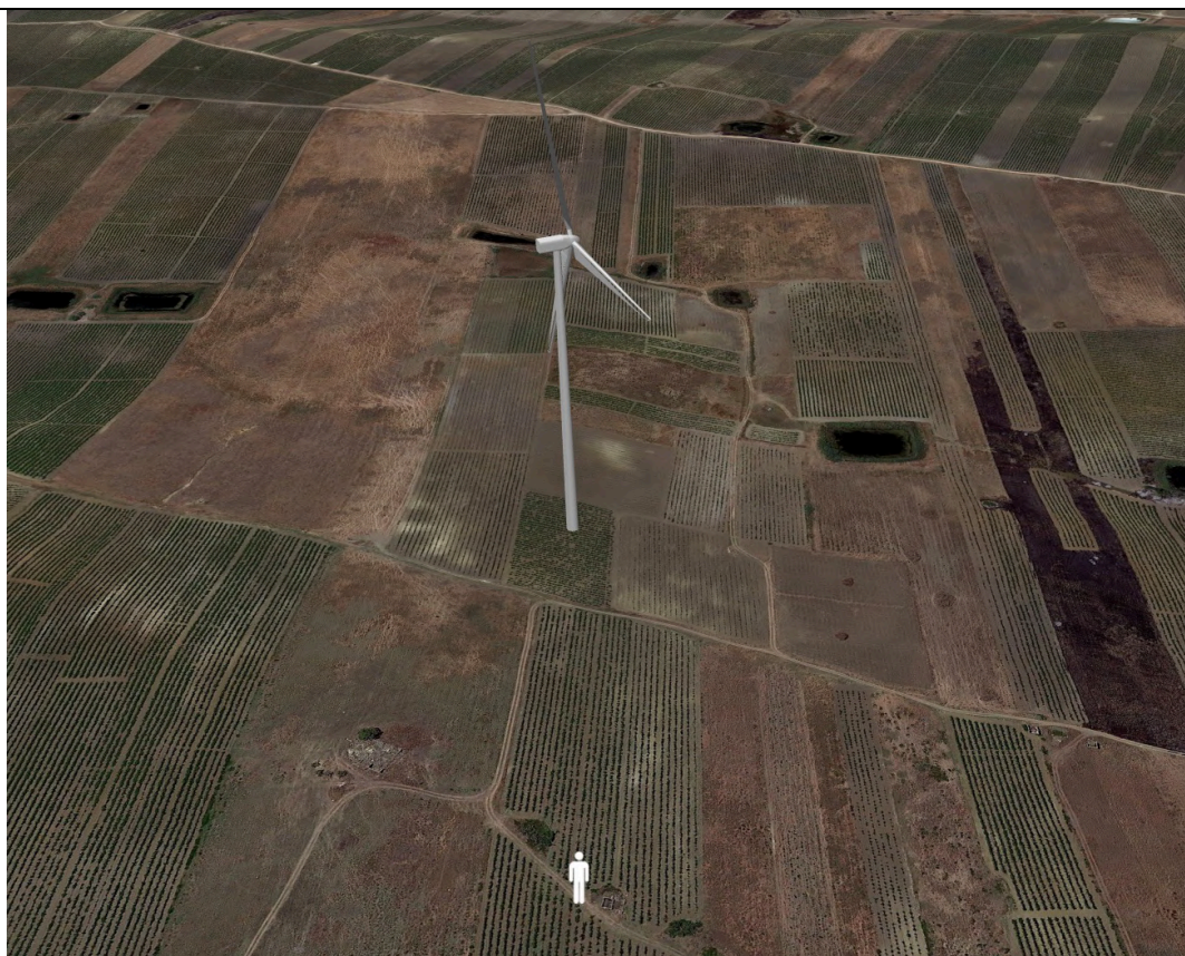
Punto di ripresa con proiezione 3D