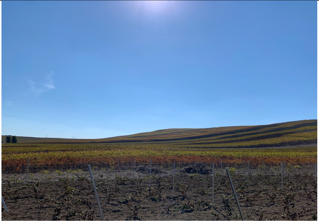
Ripresa ante operam