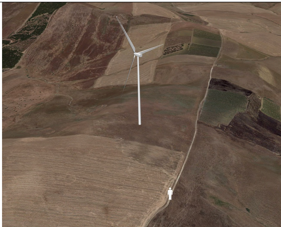
Punto di ripresa con proiezione 3D