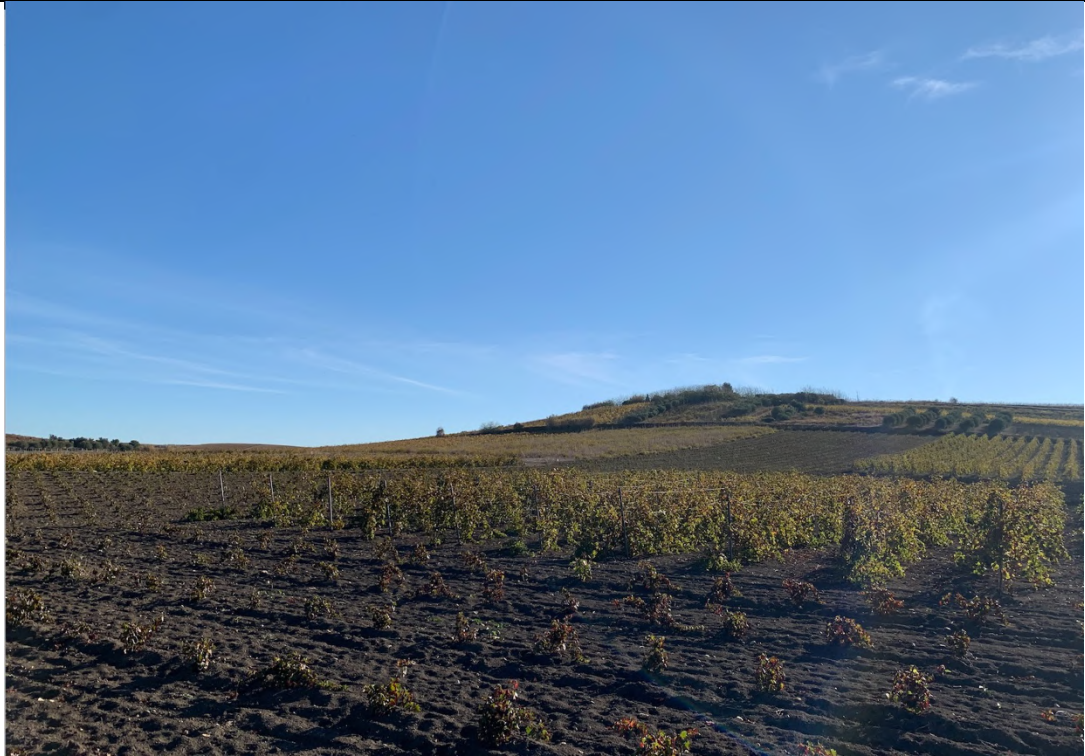
Ripresa ante operam