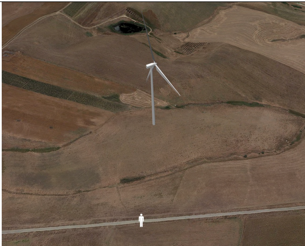
Punto di ripresa con proiezione 3D