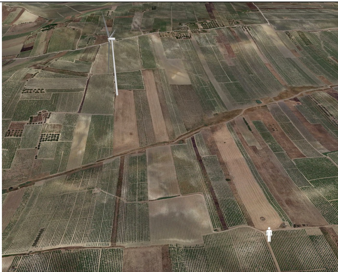
Punto di ripresa con proiezione 3D