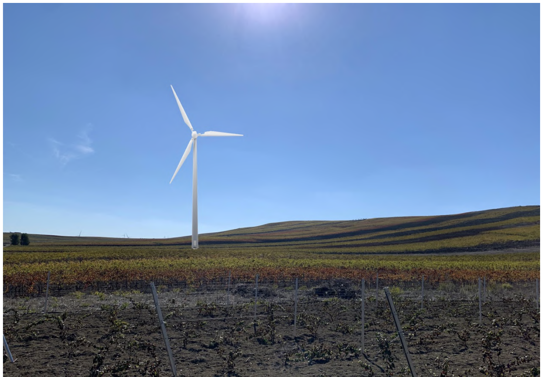
Ripresa post operam