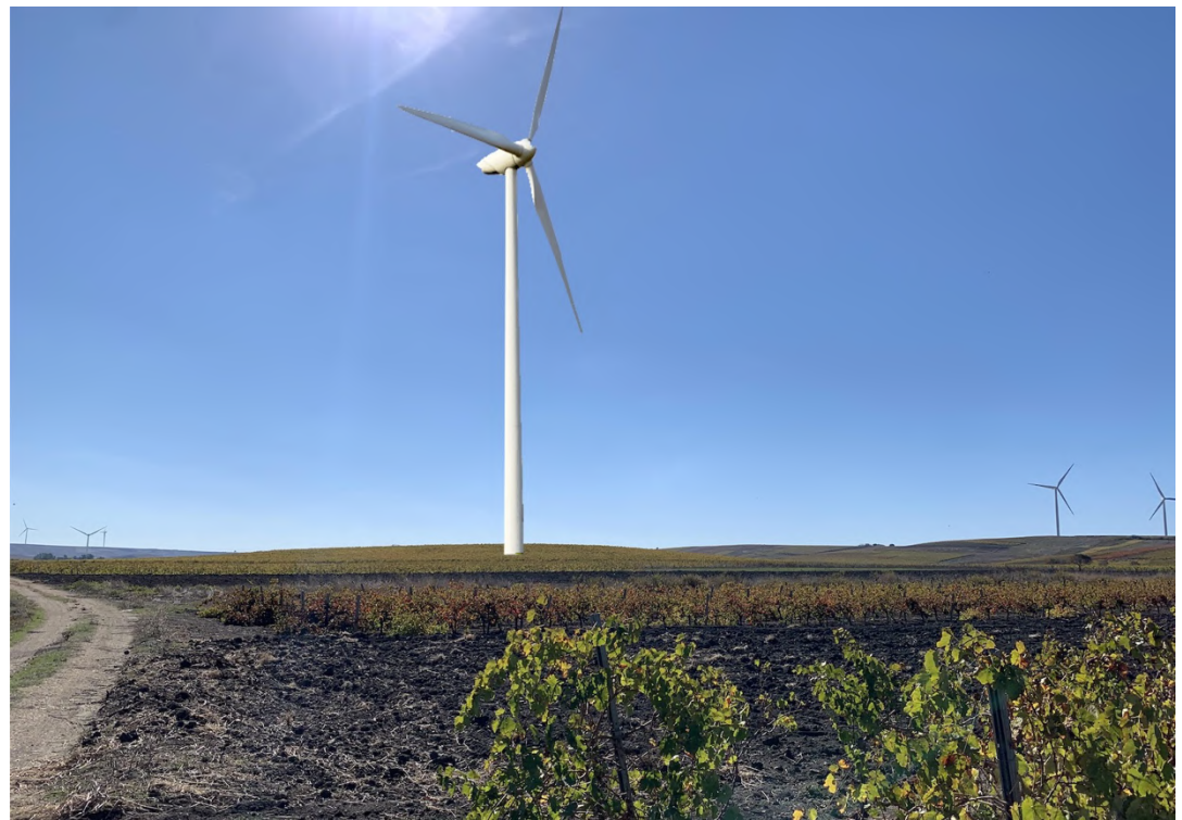
Ripresa post operam