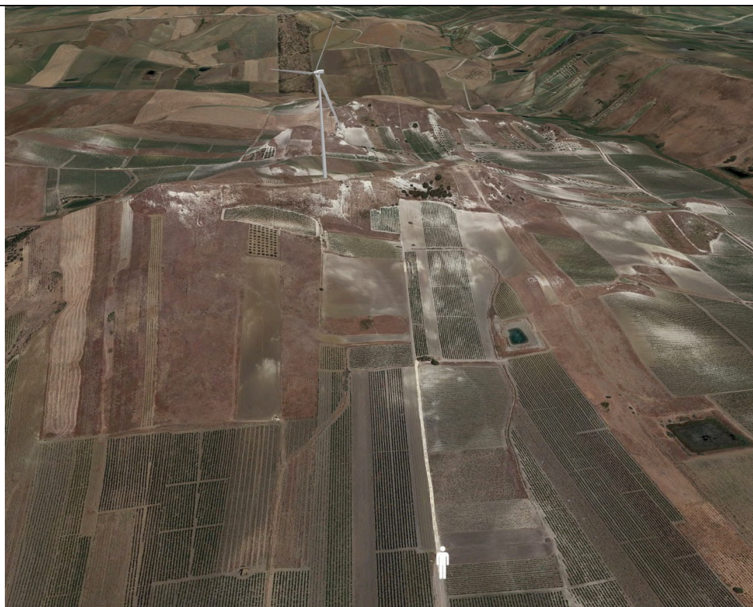
Punto di ripresa con proiezione 3D