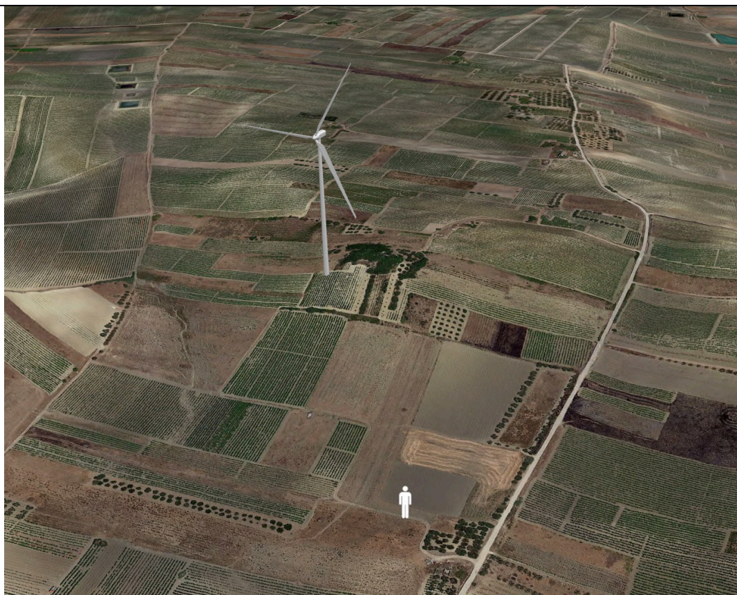
Punto di ripresa con proiezione 3D