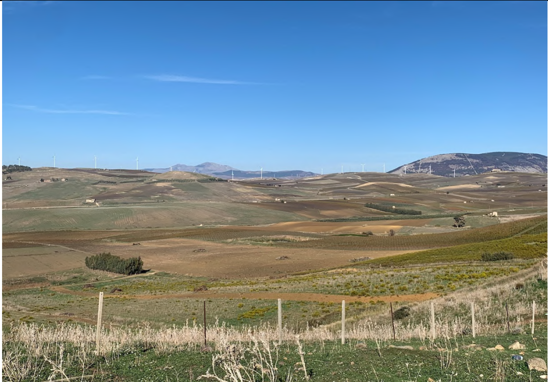
Ripresa ante operam