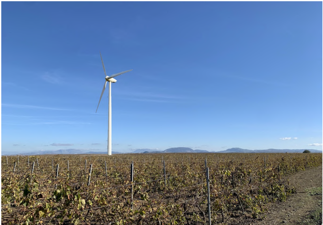
Ripresa post operam