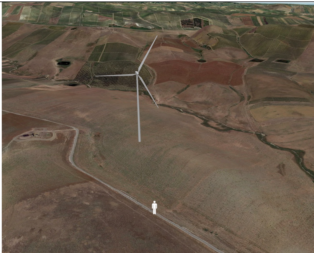
Punto di ripresa con proiezione 3D