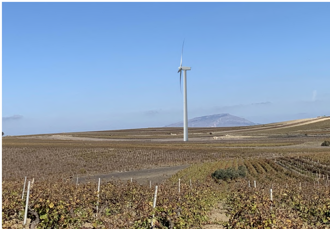
Ripresa post operam