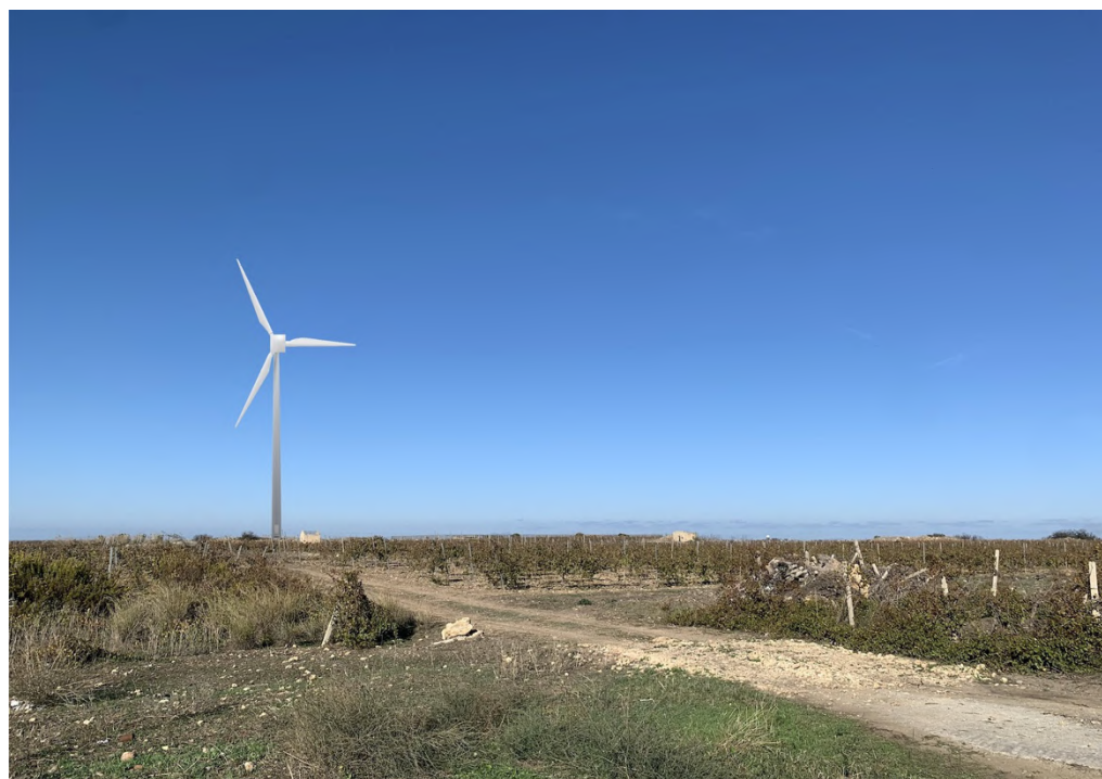
Ripresa post operam