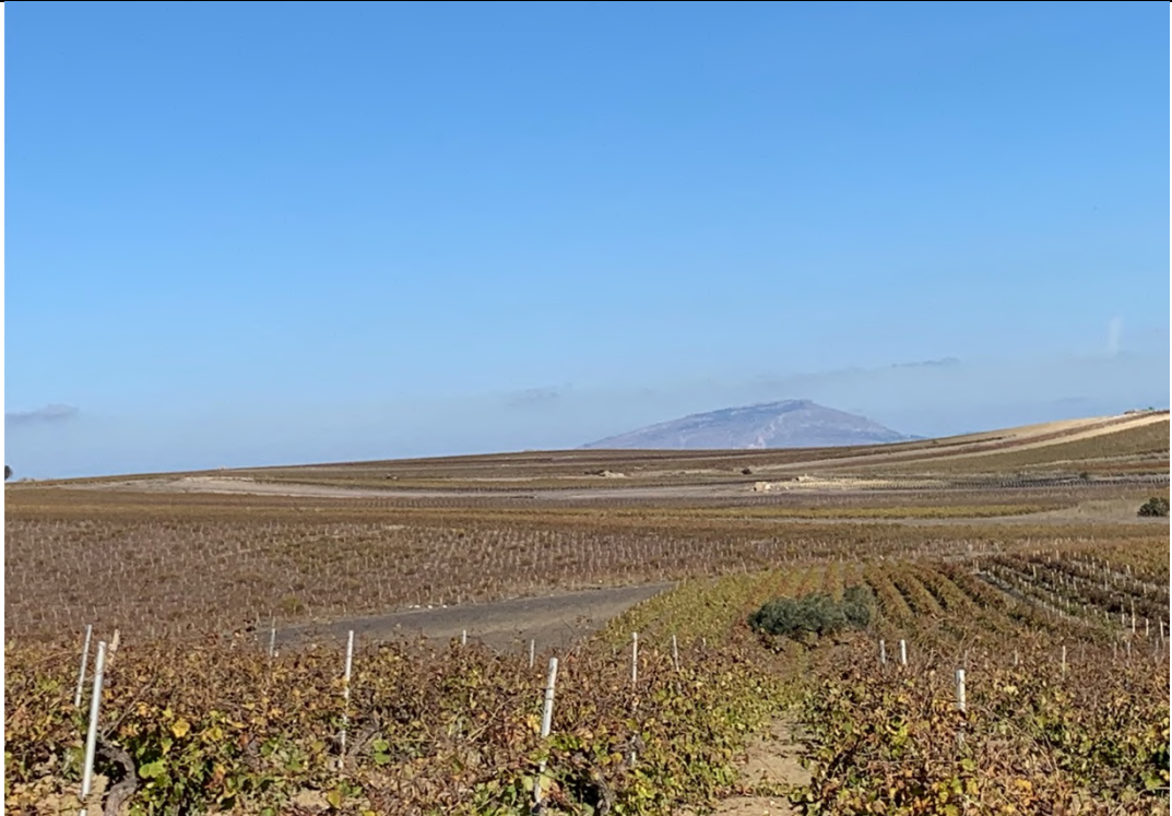
Ripresa ante operam