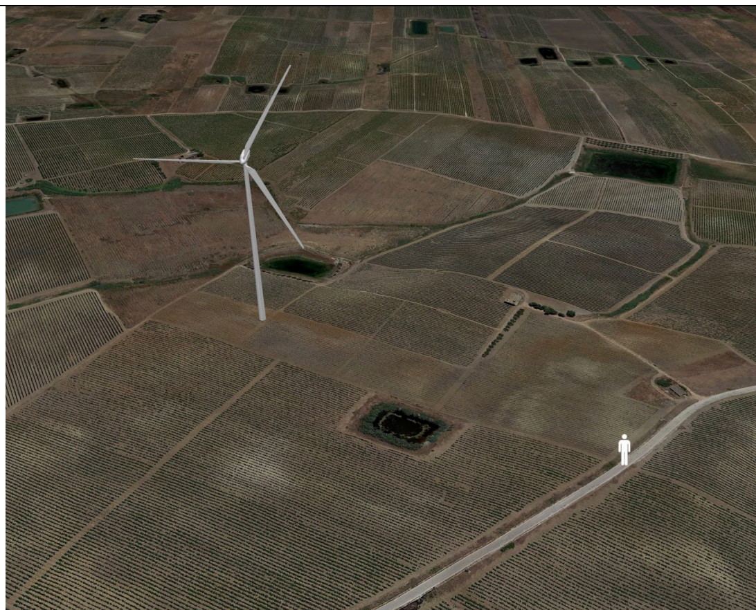
Punto di ripresa con proiezione 3D