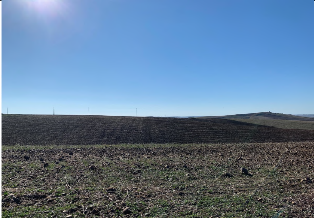
Ripresa ante operam