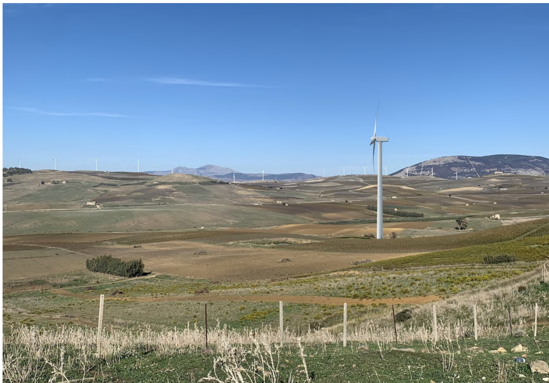
Ripresa post operam