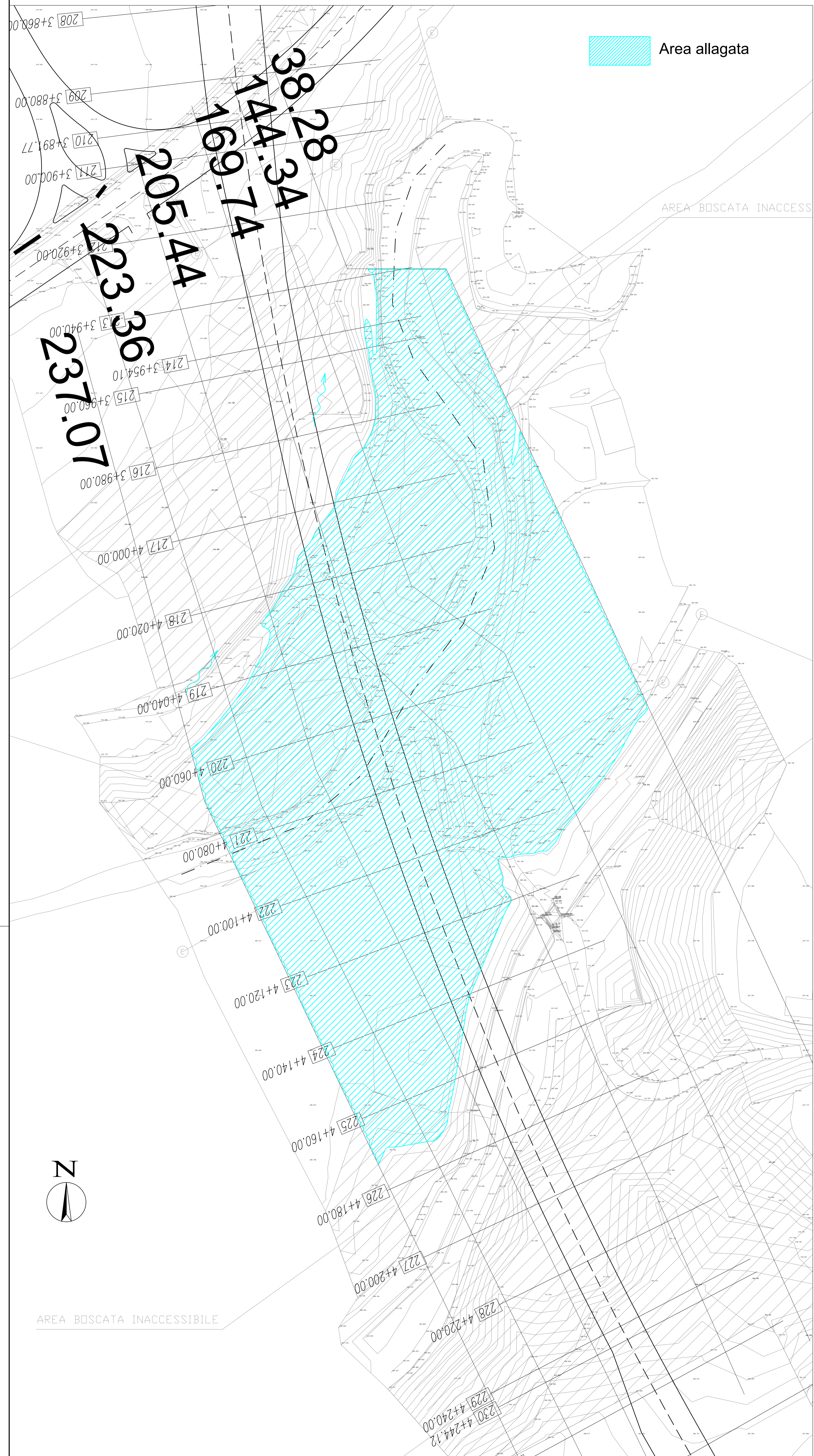
Potenza Ante Operam - Scala 1:500 -