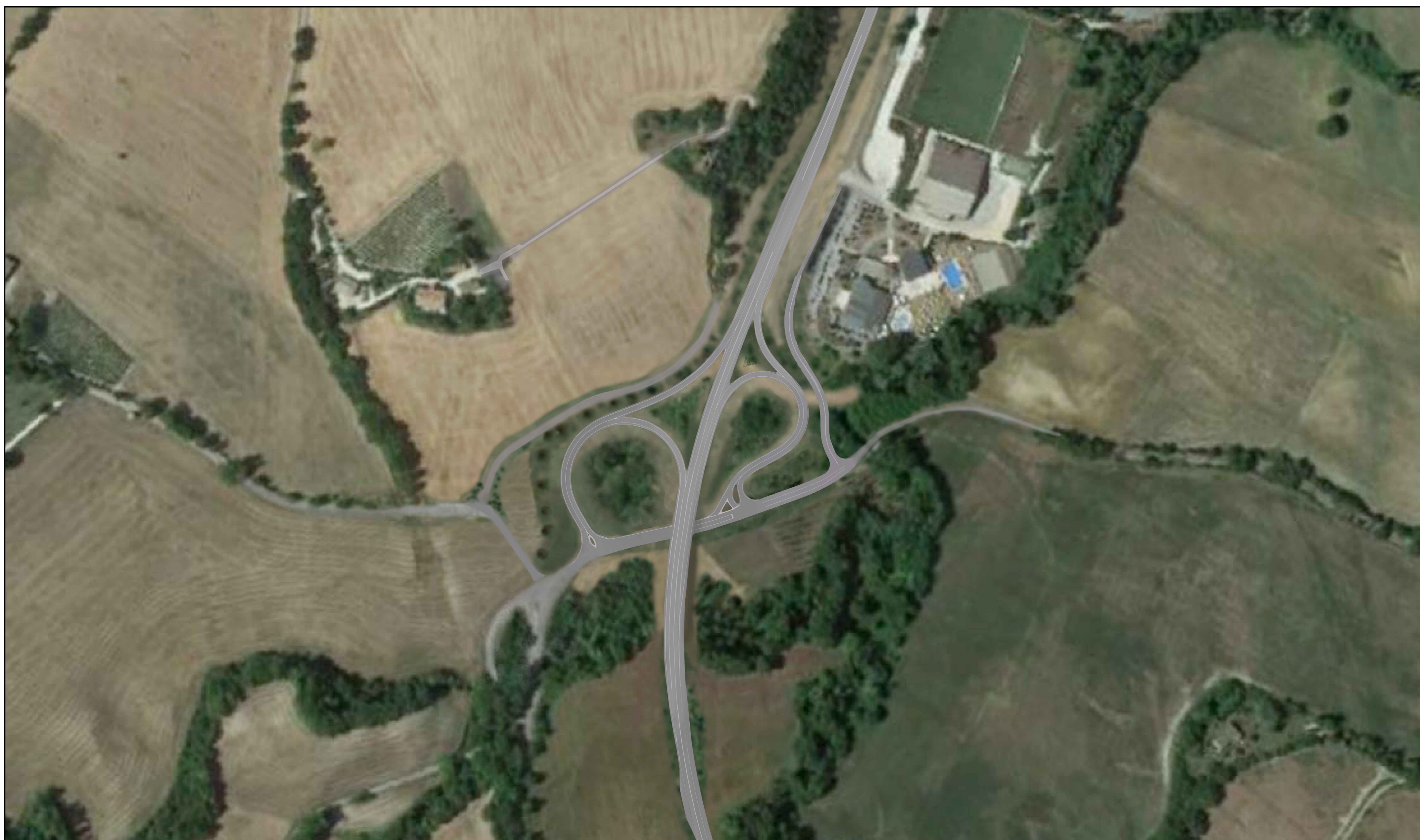
Fotoinserimento paesaggistico 1:2000 – Svincolo di Camerino Nord