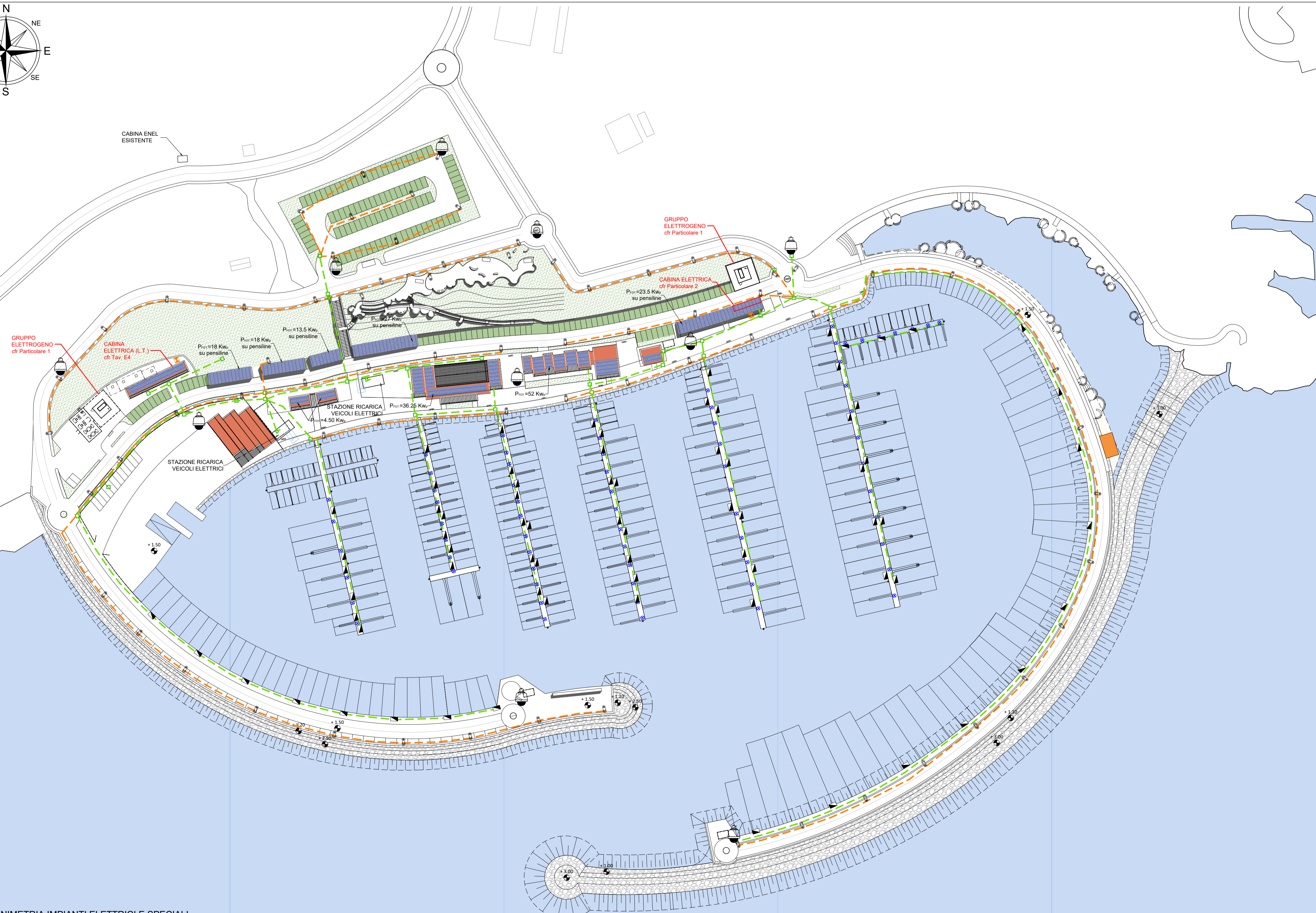
PLANIMETRIA IMPIANTI ELETTRICI E SPECIALI SCALA 1:1000