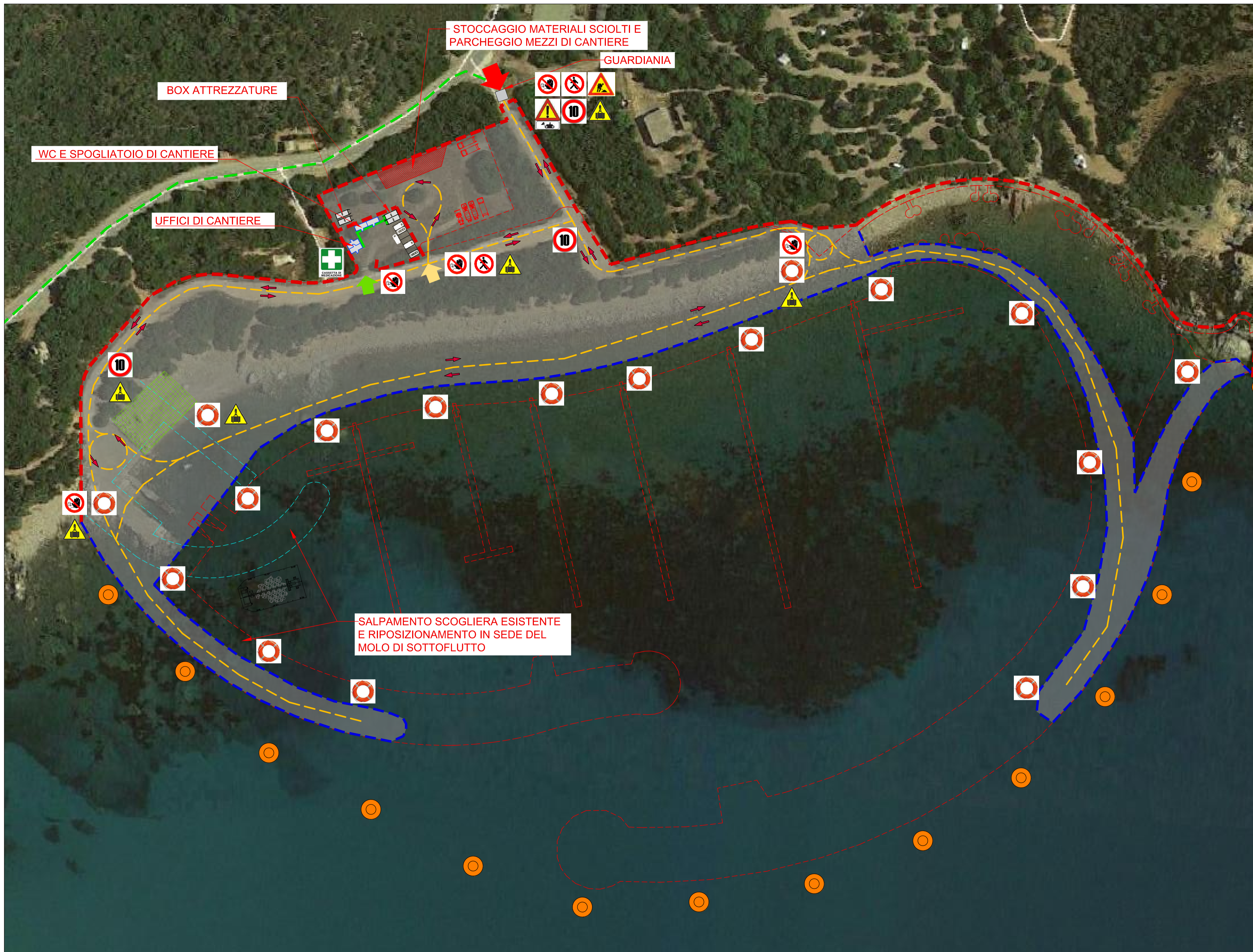
PLANIMETRIA GENERALE DI CANTIERE - FASE 1 - SCALA 1:1000