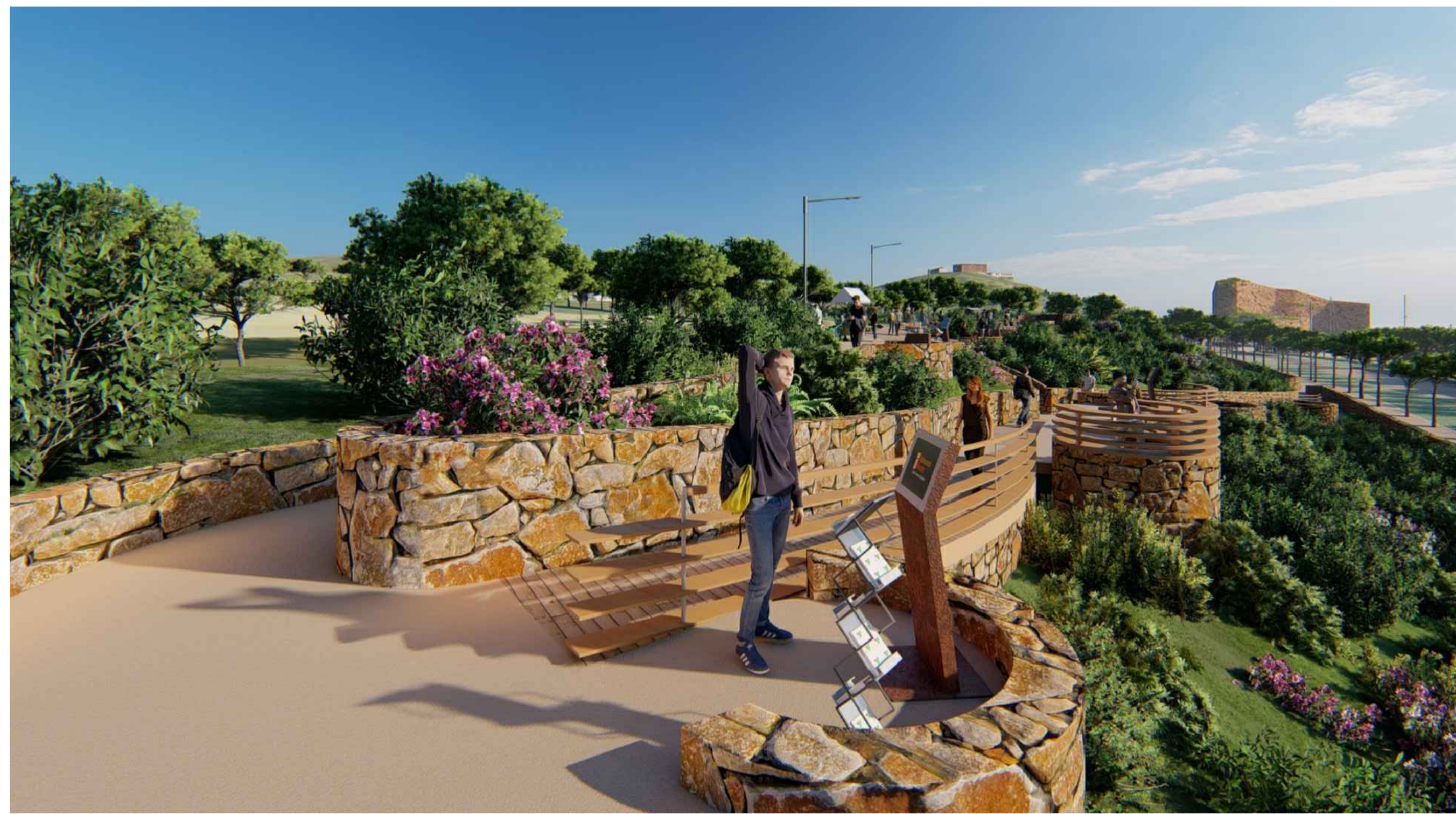
RENDERING DI PROGETTO - VISTA TOTEM INFORMATIVO