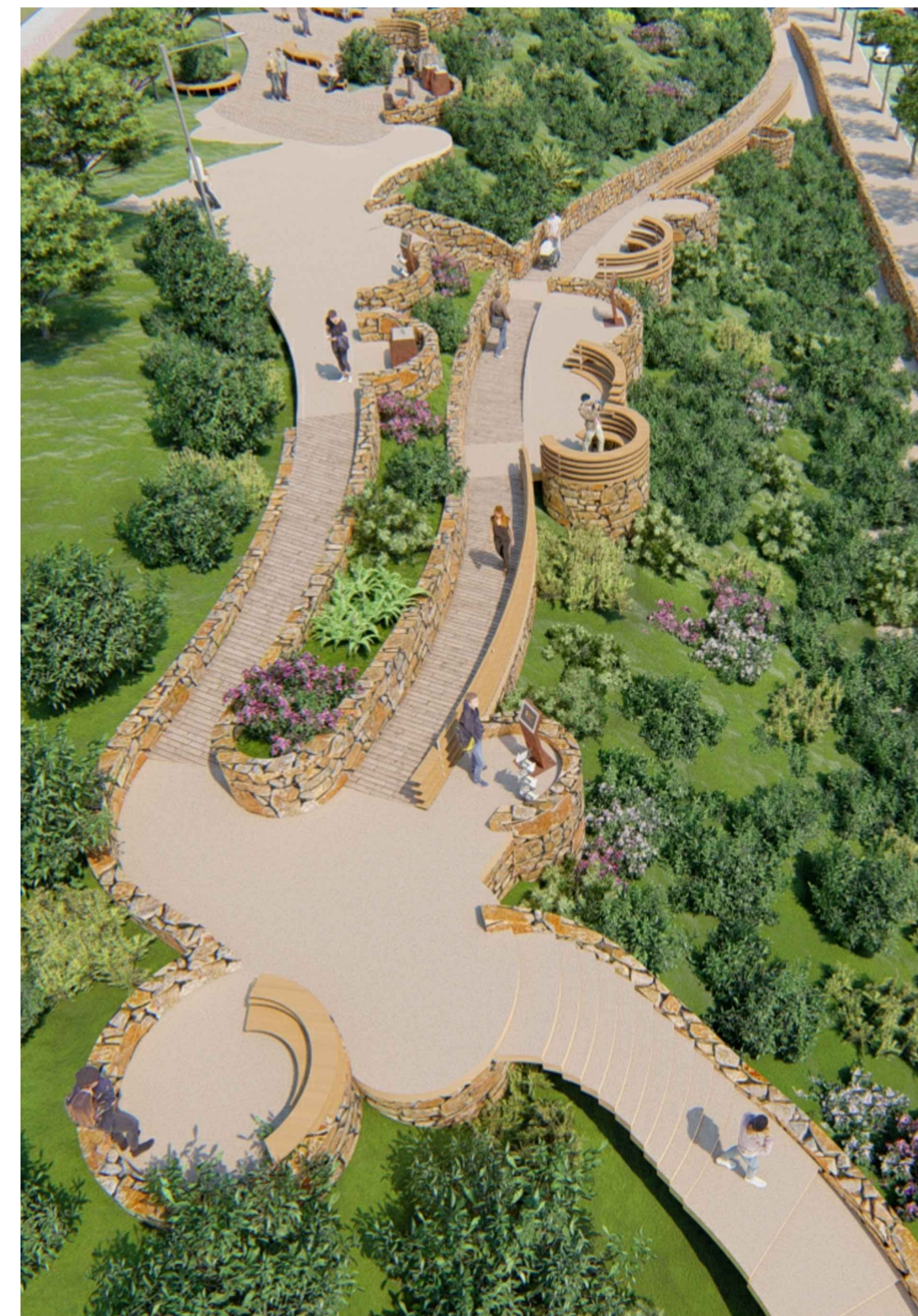
RENDERING DI PROGETTO - VISTA OVEST ALTA