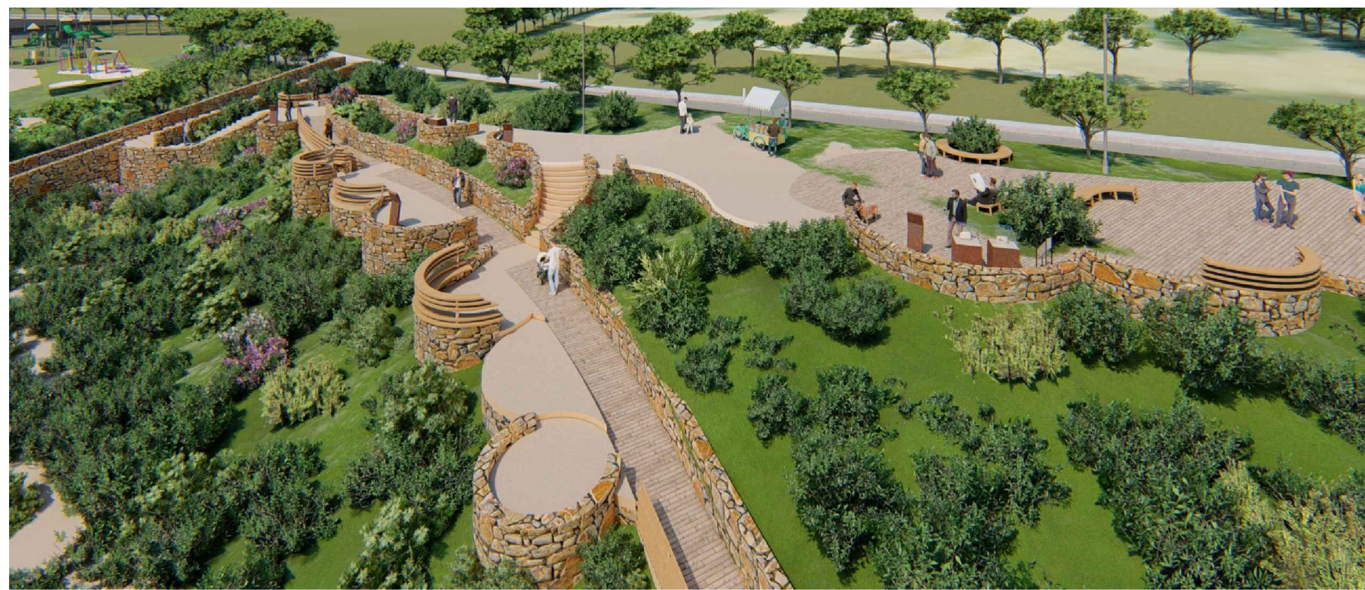
RENDERING DI PROGETTO - VISTA EST ALTA