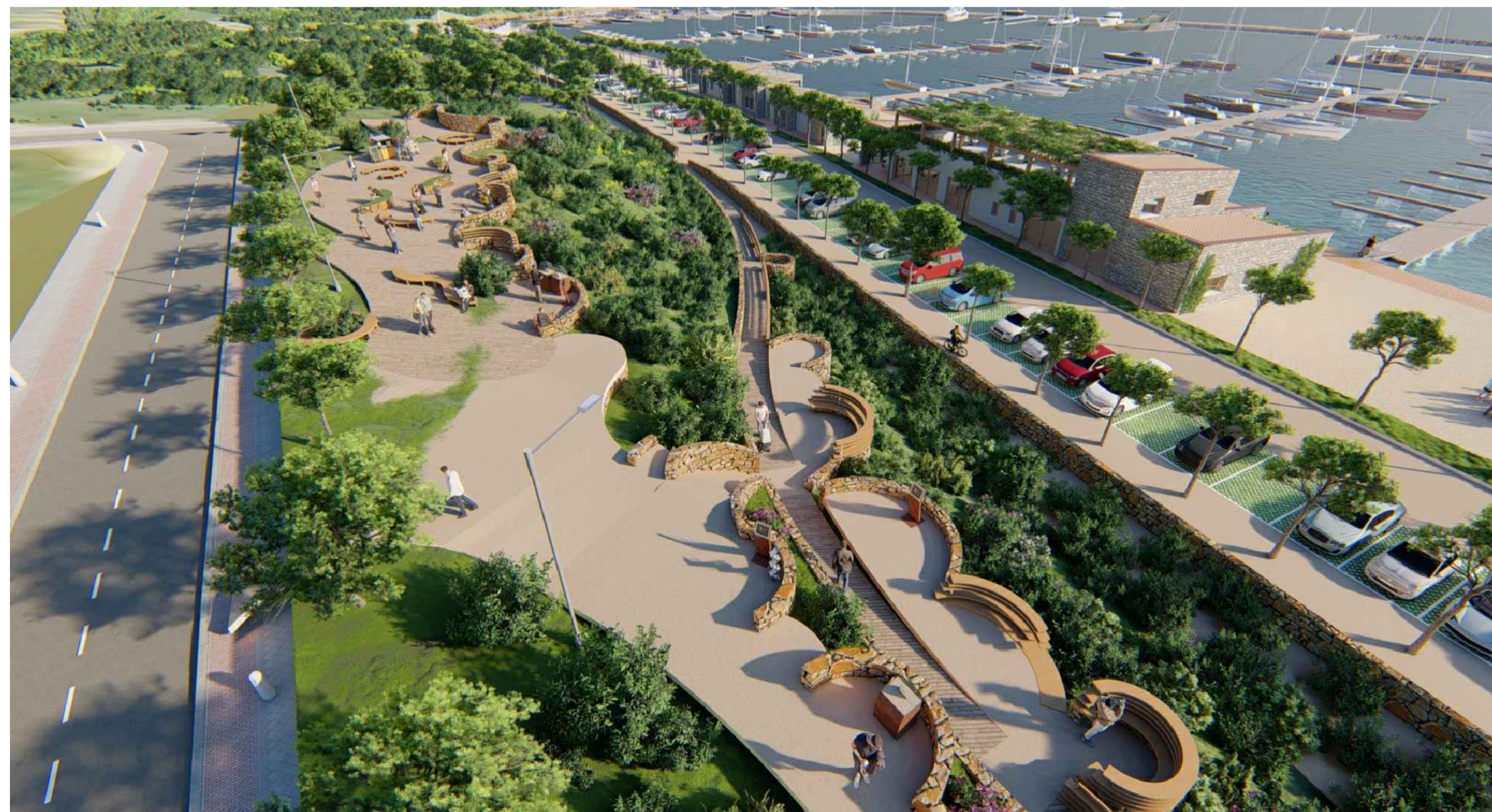
RENDERING DI PROGETTO - VISTA OVEST