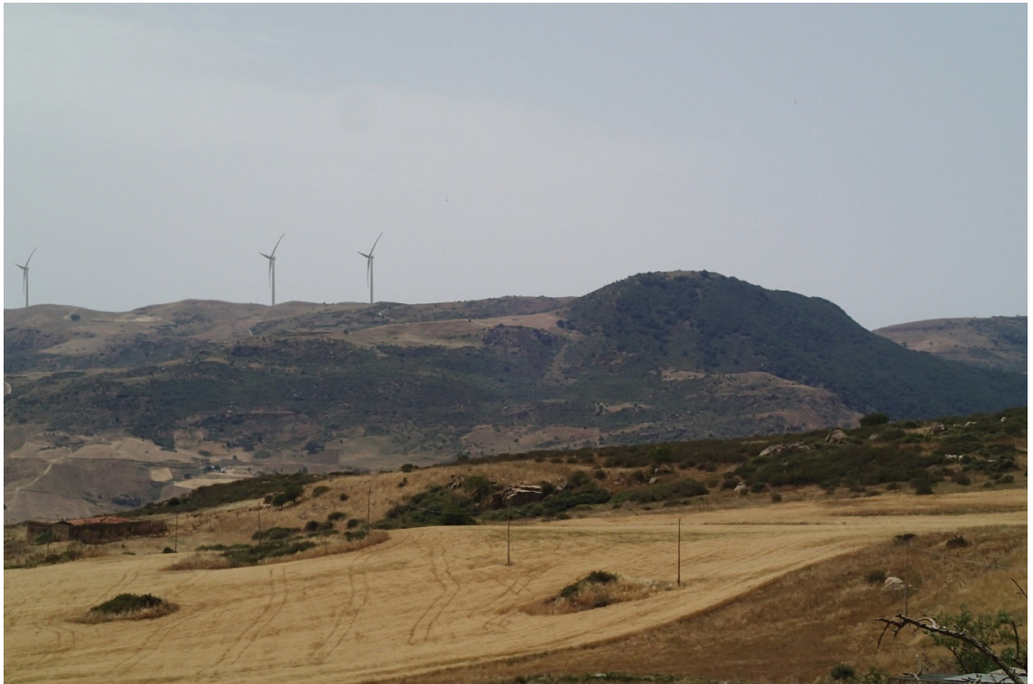
Figura 2-10: Foto 5 - Post-operam dal Comune di Sclafani Bagni