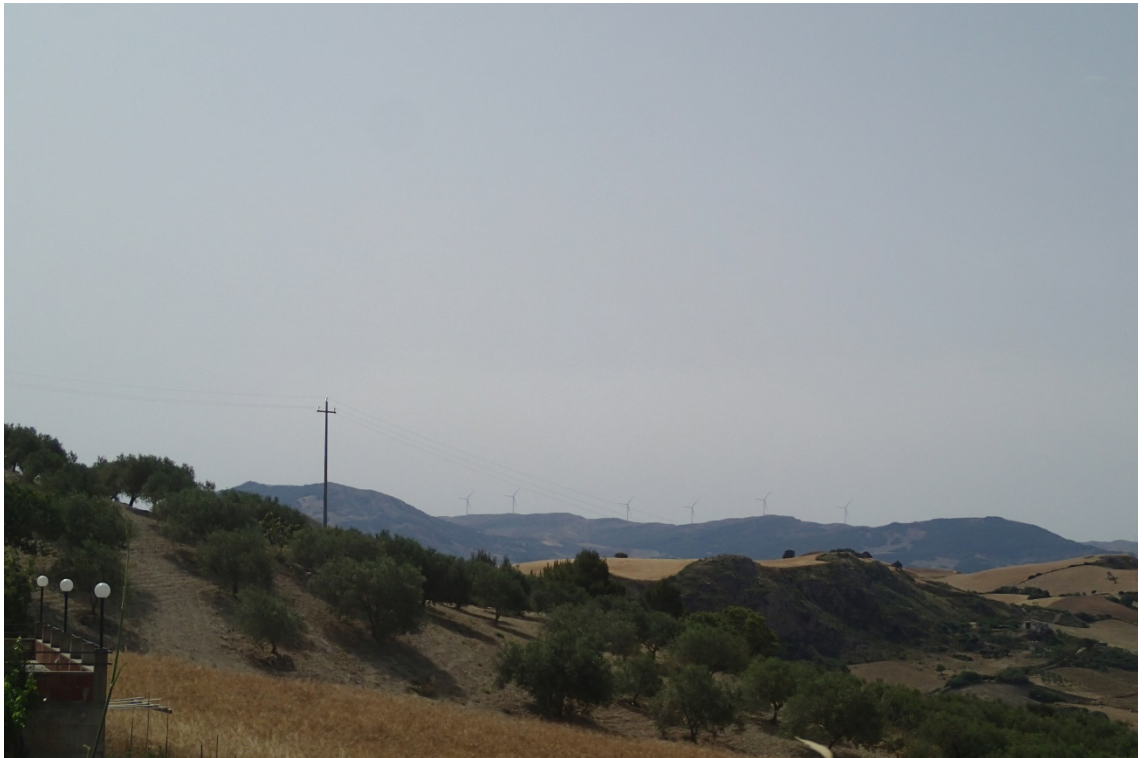
Figura 2-6: Foto 3 - Post-operam da SS285 nel Comune di Caccamo