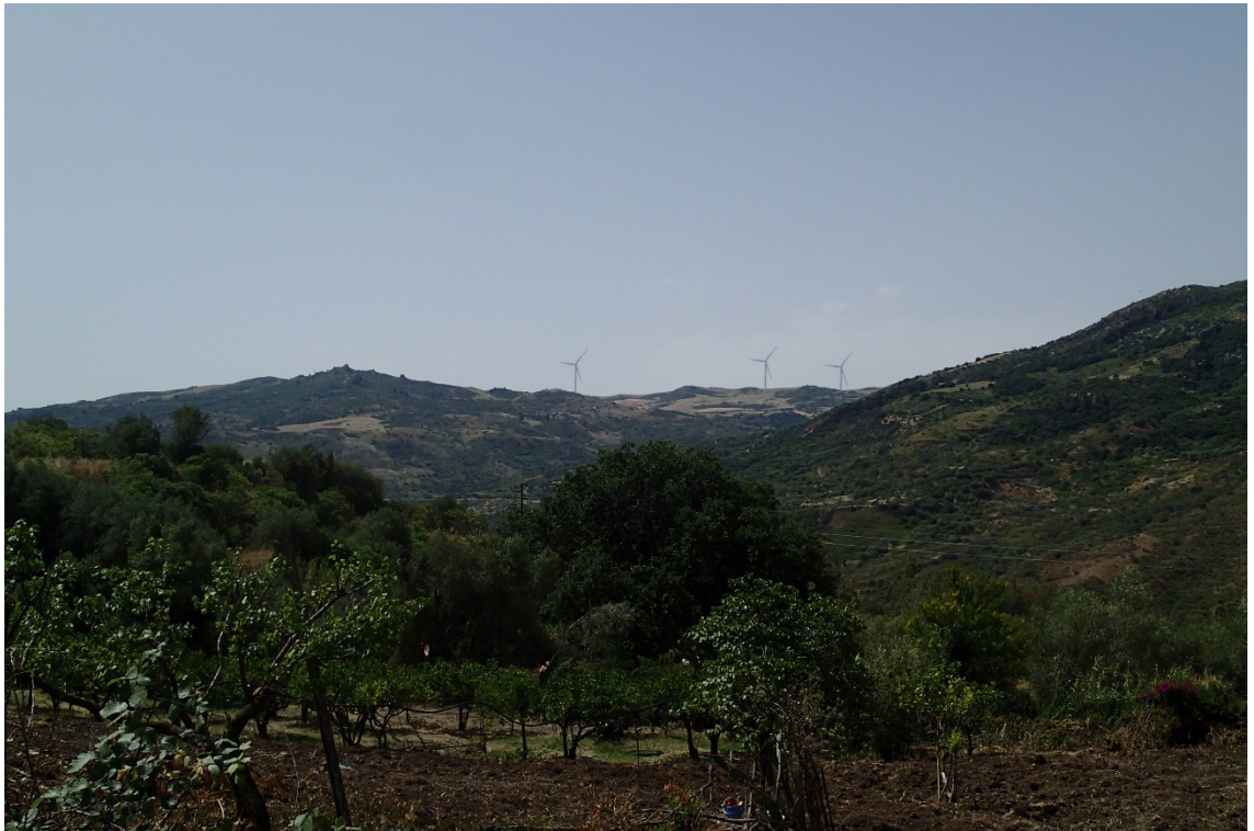
Figura 2-8: Foto 4 - Post-operam dal Comune di Termini Imerese