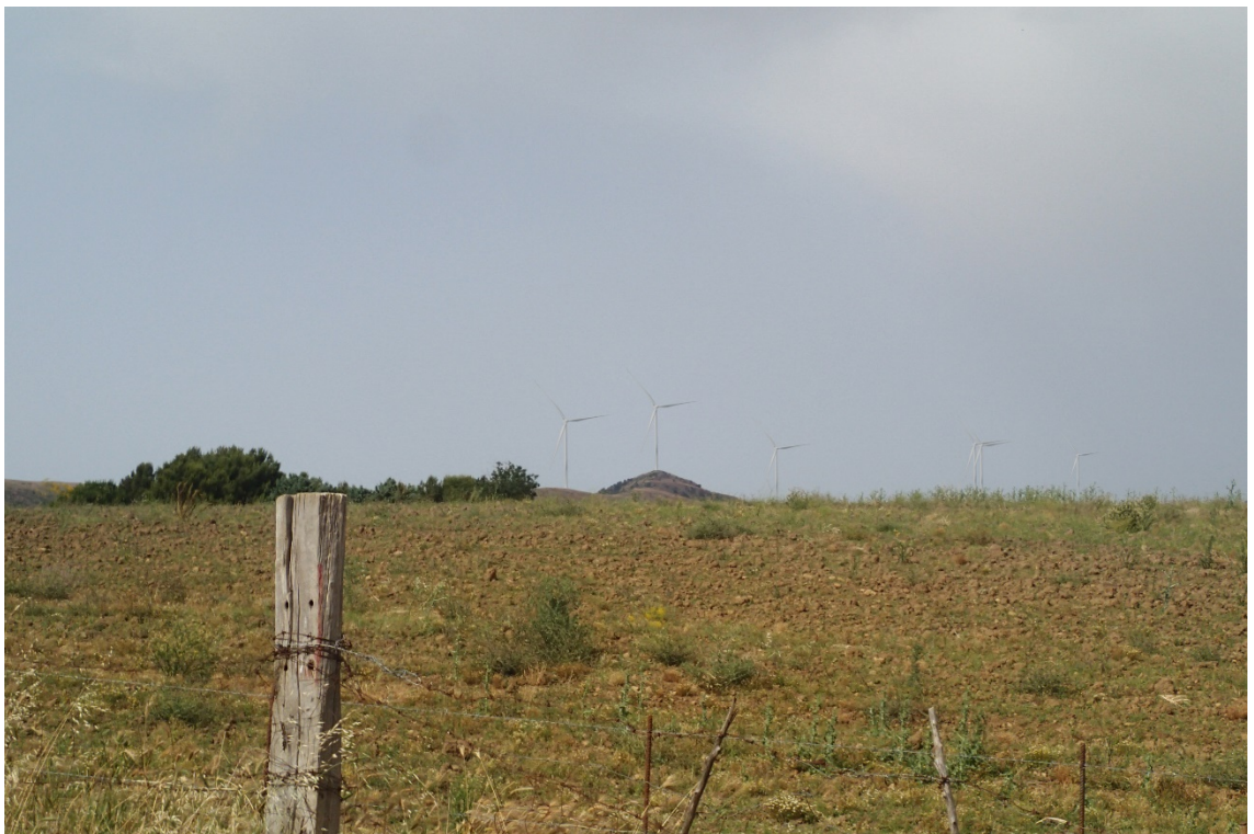
Figura 2-18: Foto 9 - Post-operam dal Comune di Alia