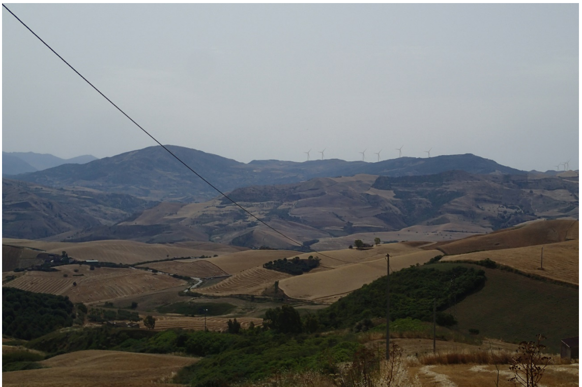
Figura 2-4: Foto 2 - Post-operam da SS285 nel Comune di Caccamo