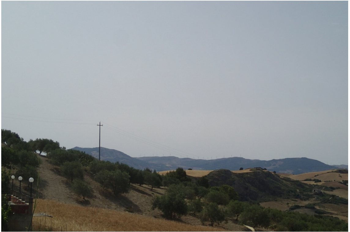
Figura 2-5: Foto 3 - Ante-operam da SS285 nel Comune di Caccamo