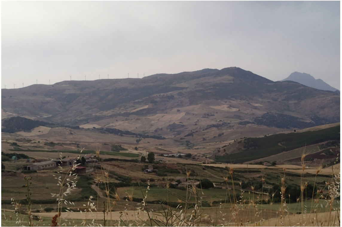
Figura 2-15: Foto 8 - Ante-operam da SS643 nel Comune di Polizzi Generosa