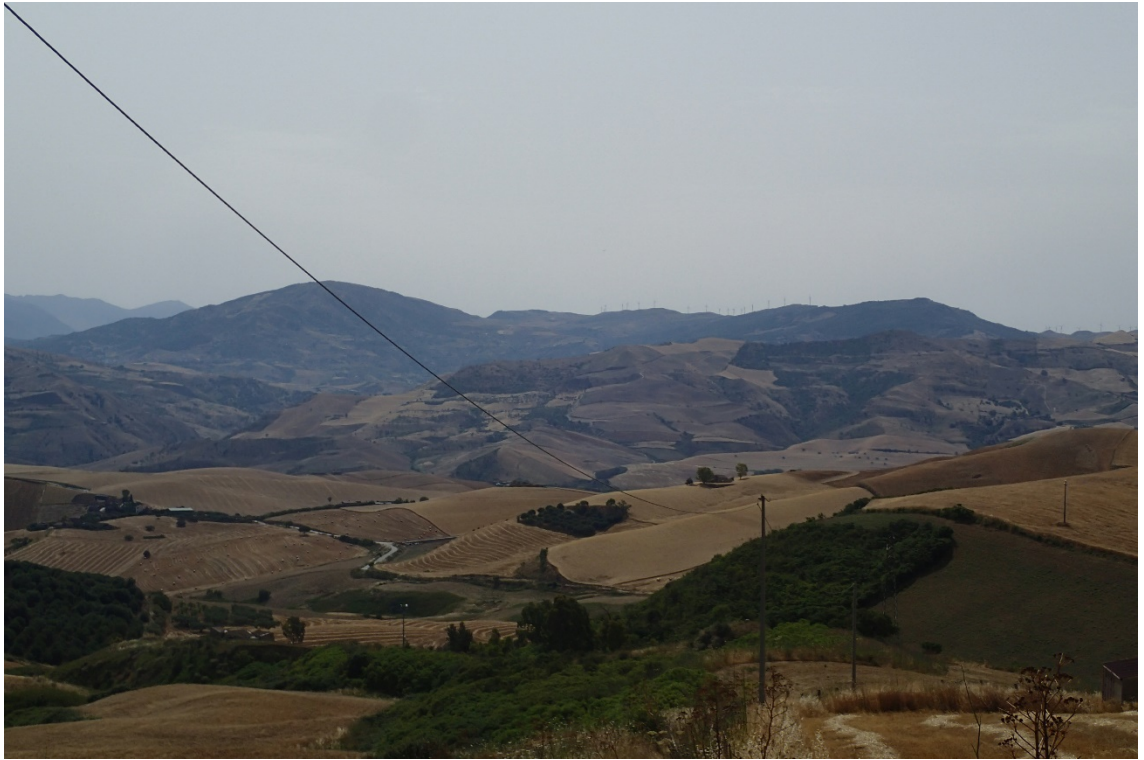
Figura 2-3: Foto 2 - Ante-operam da SS285 nel Comune di Caccamo