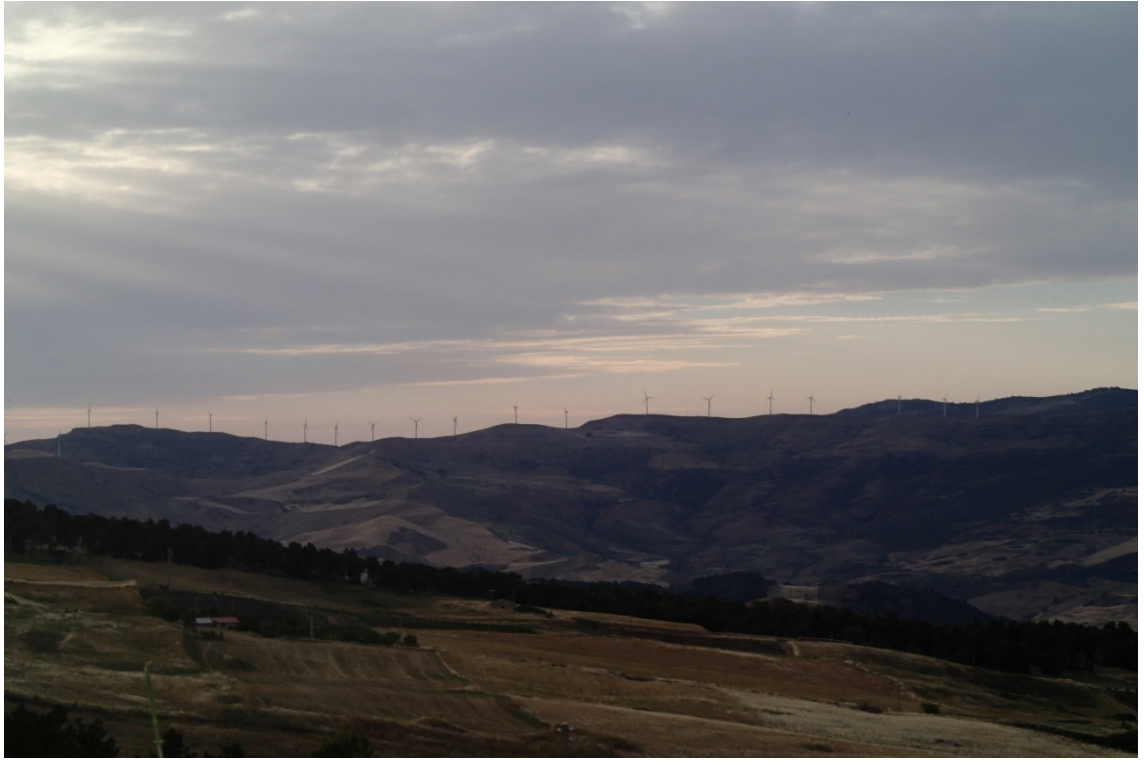
Figura 2-1: Foto 1 - Ante-operam da SP8 nel Comune di Caltavuturo