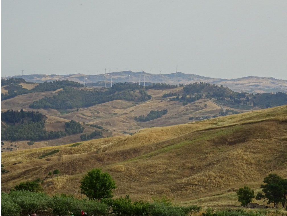
Figura 2-19: Foto 10 - Ante-operam da SP25 nel Comune di Cammarata