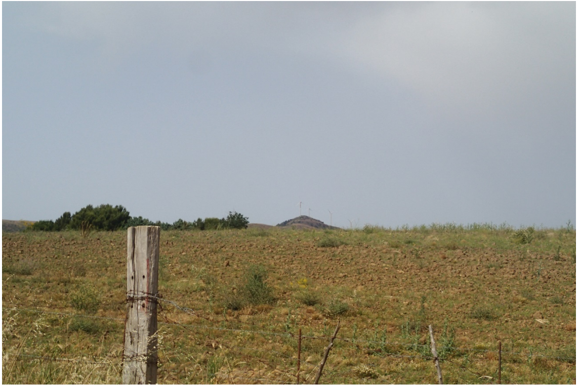
Figura 2-17: Foto 9 - Ante-operam dal Comune di Alia