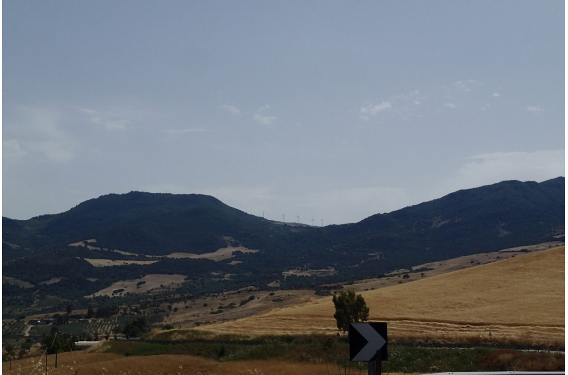
Figura 2-11: Foto 6 - Ante-operam da SS120 nel Comune di Sclafani Bagni