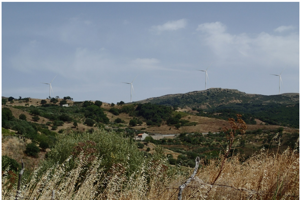
Figura 2-14: Foto 7 - Post-operam da SP7 nel Comune di Montemaggiore Belsito