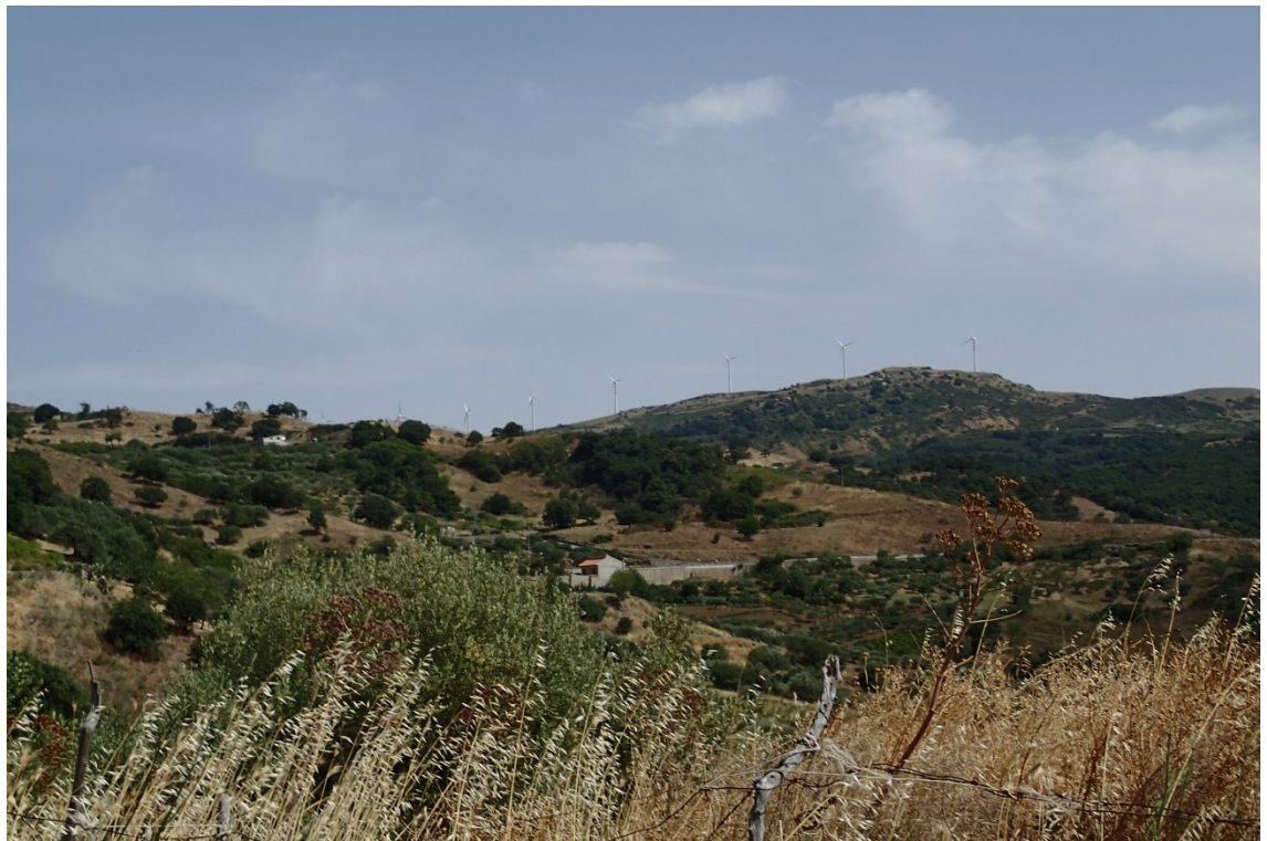
Figura 2-13: Foto 7 - Ante-operam da SP7 nel Comune di Montemaggiore Belsito