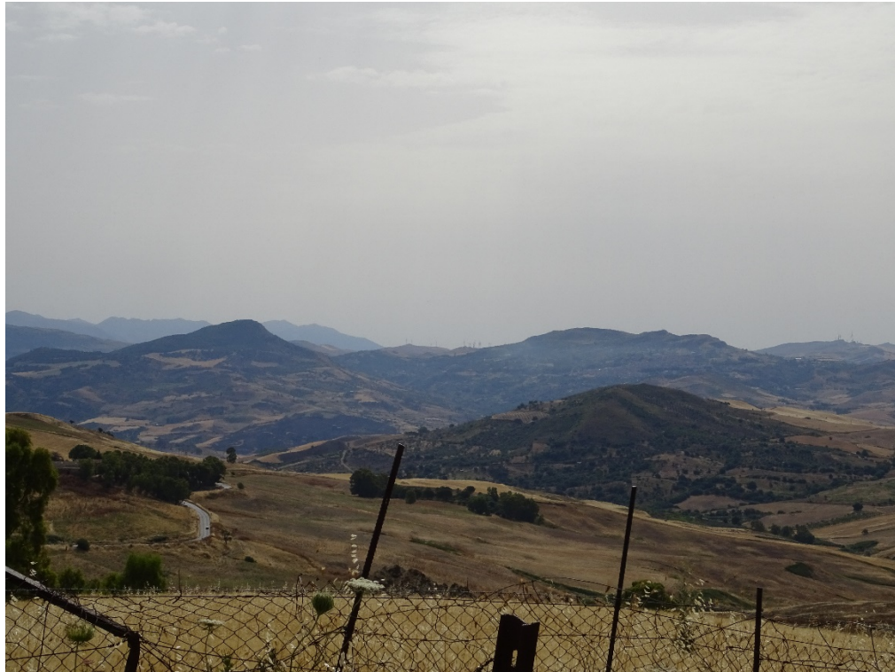
Figura 2-21: Foto 11 - Ante-operam da SS189 nel Comune di Vicari