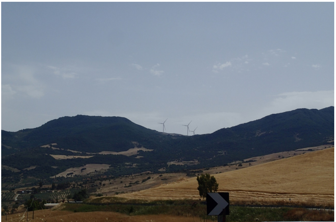
Figura 2-12: Foto 6 - Post-operam da SS120 nel Comune di Sclafani Bagni