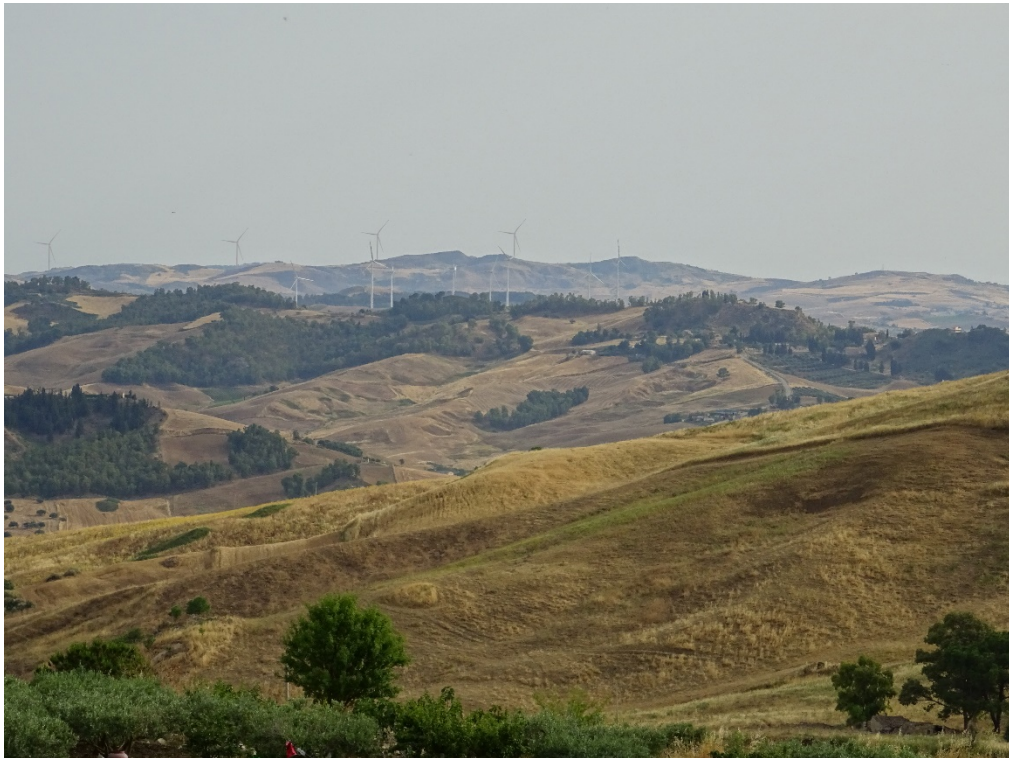
Figura 2-20: Foto 10 - Post-operam da SP25 nel Comune di Cammarata