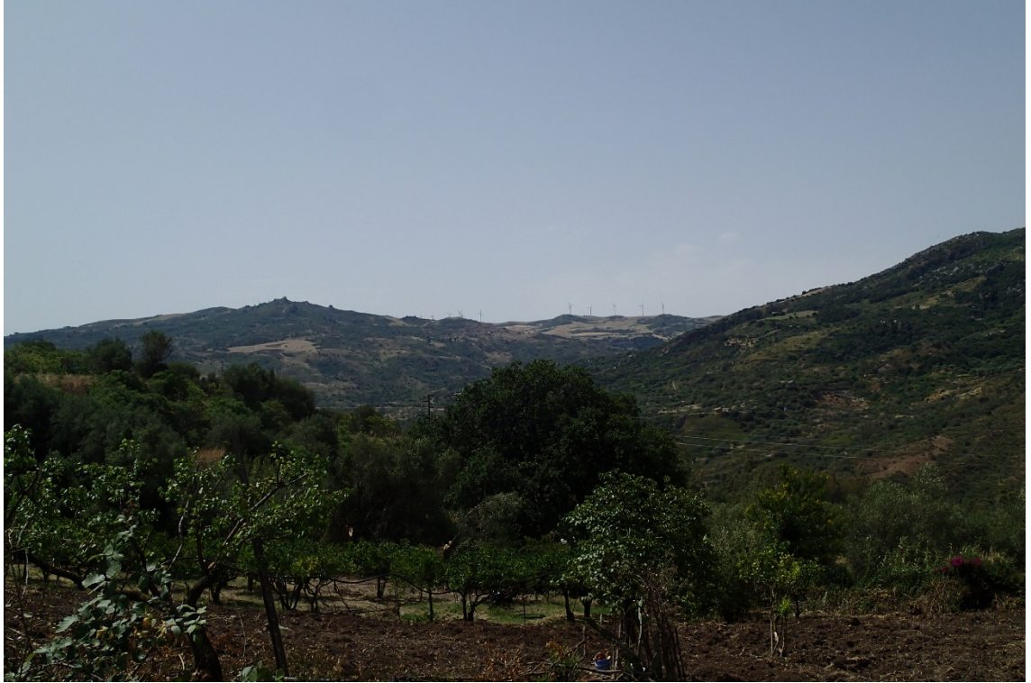
Figura 2-7: Foto 4 - Ante-operam dal Comune di Termini Imerese