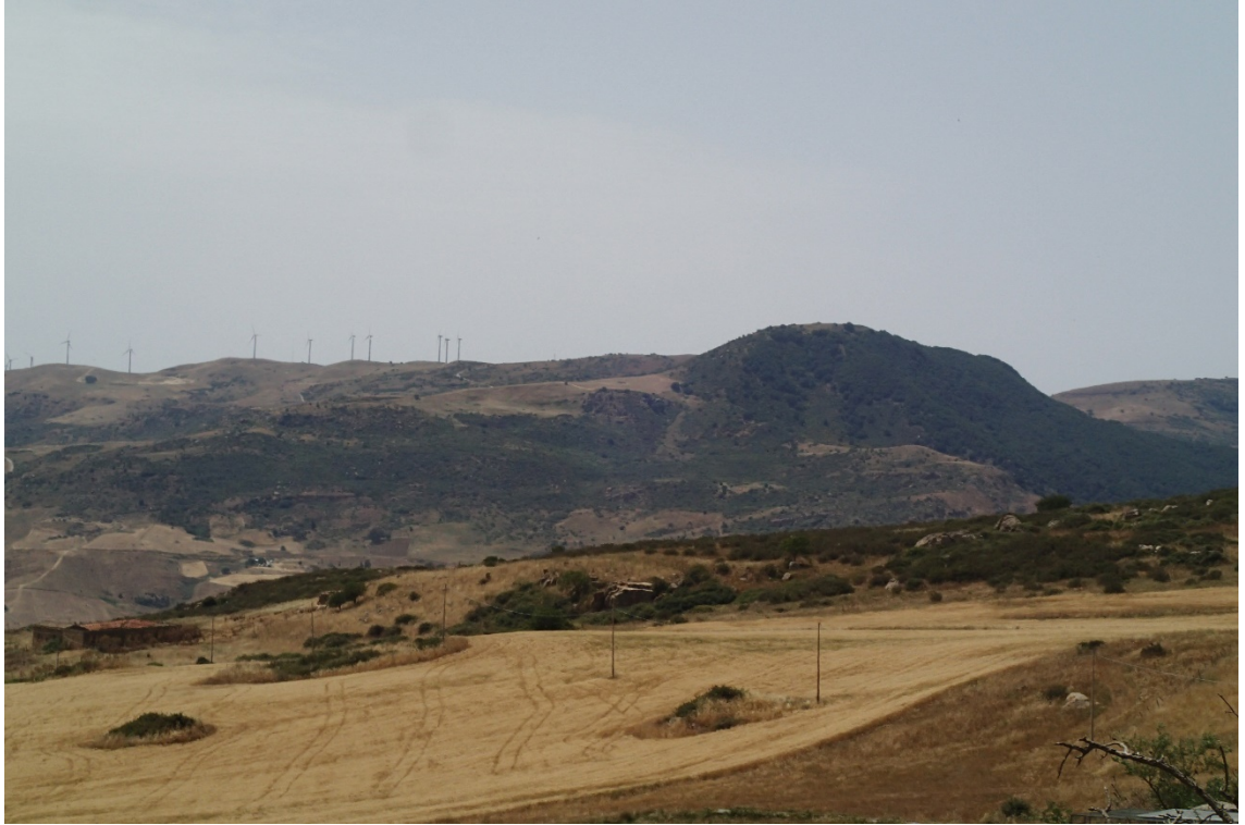
Figura 2-9: Foto 5 - Ante-operam dal Comune di Sclafani Bagni