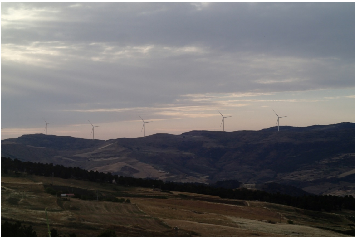
Figura 2-2: Foto 1 - Post-operam da SP8 nel Comune di Caltavuturo