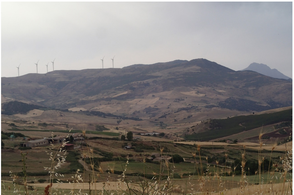
Figura 2-16: Foto 8 - Post-operam da SS643 nel Comune di Polizzi Generosa