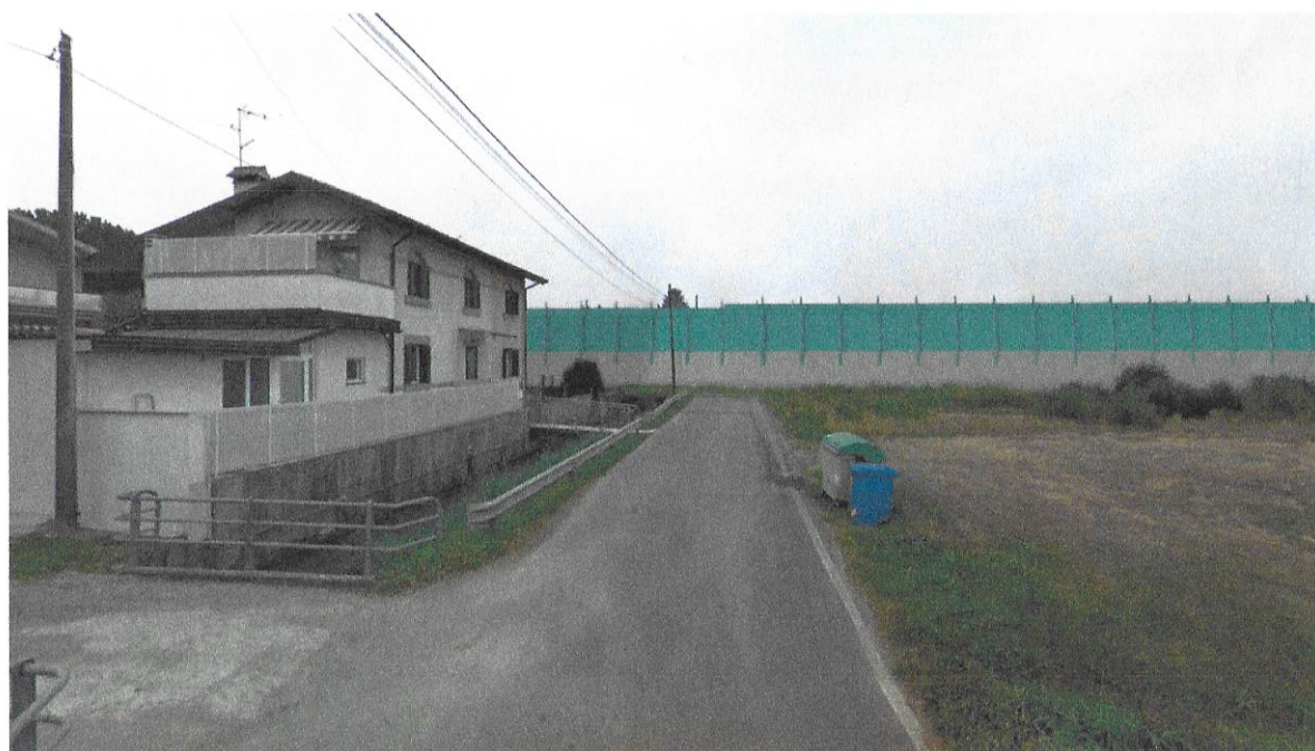
Figura 97 - - Fotosimulazione n.2 – Post opera