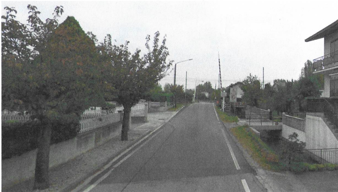
Figura 94 – Fotosimulazione n.1 – Ante opera