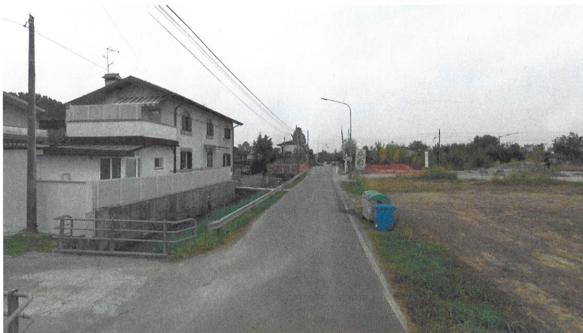
Figura 96 - Fotosimulazione n.2 – Ante opera