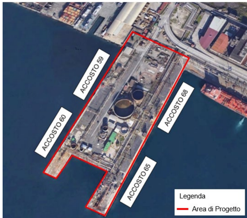
Figura 1.2: Identificazione degli Accosti nel Molo Vigliena.

Sul Molo Vigliena sono presenti ed operativi i seguenti accosti: 59, 60 (localizzati sulla parte Ovest del molo), 61, 62 (localizzati in testa al molo) e 65 (localizzato sulla parte Est). La localizzazione degli accosti di interesse per il presente progetto (No. 60 e 65) è riportata nella successiva Figura.