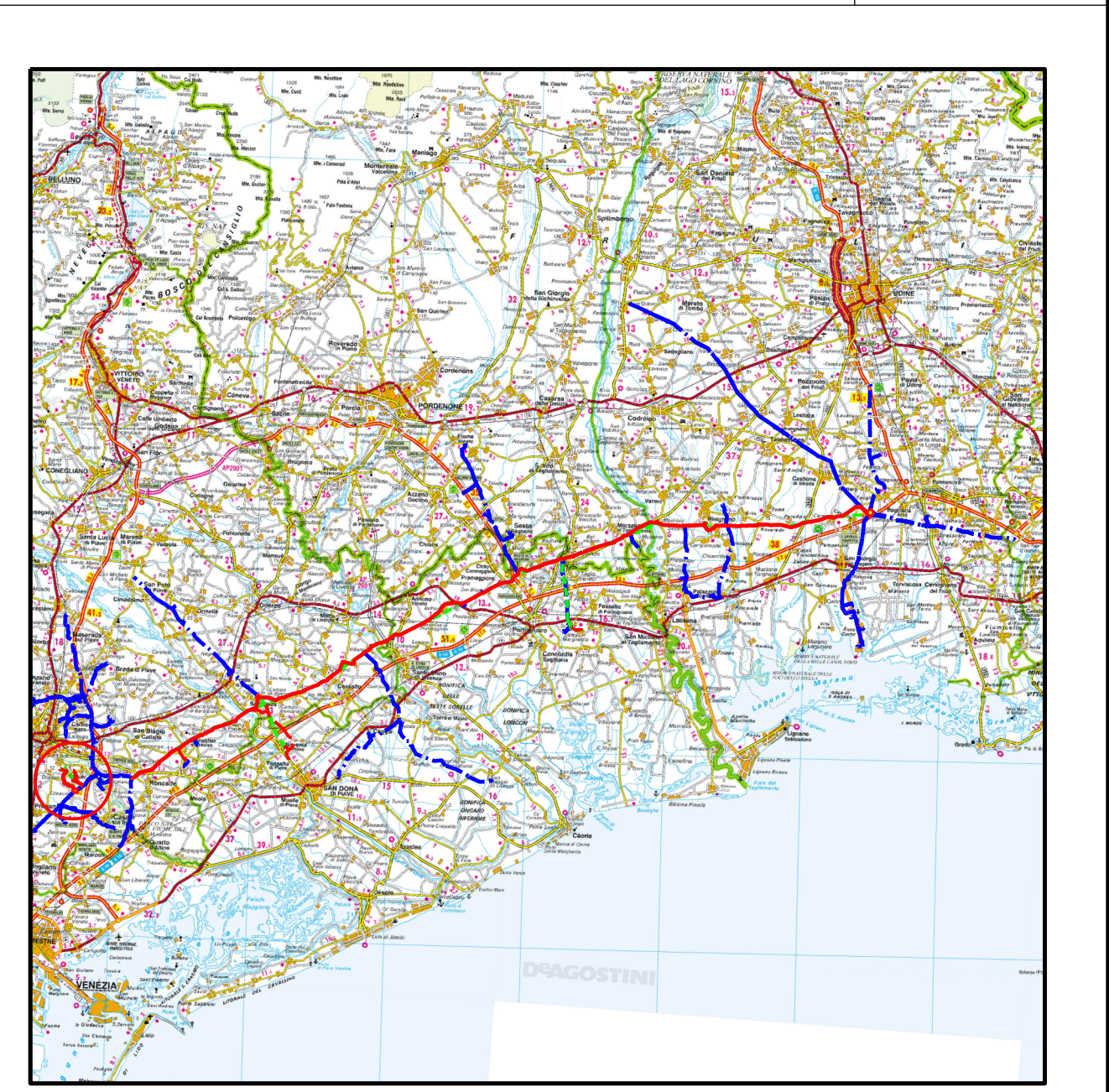
COROGRAFIA Nei comuni di TREVISO, CASIER