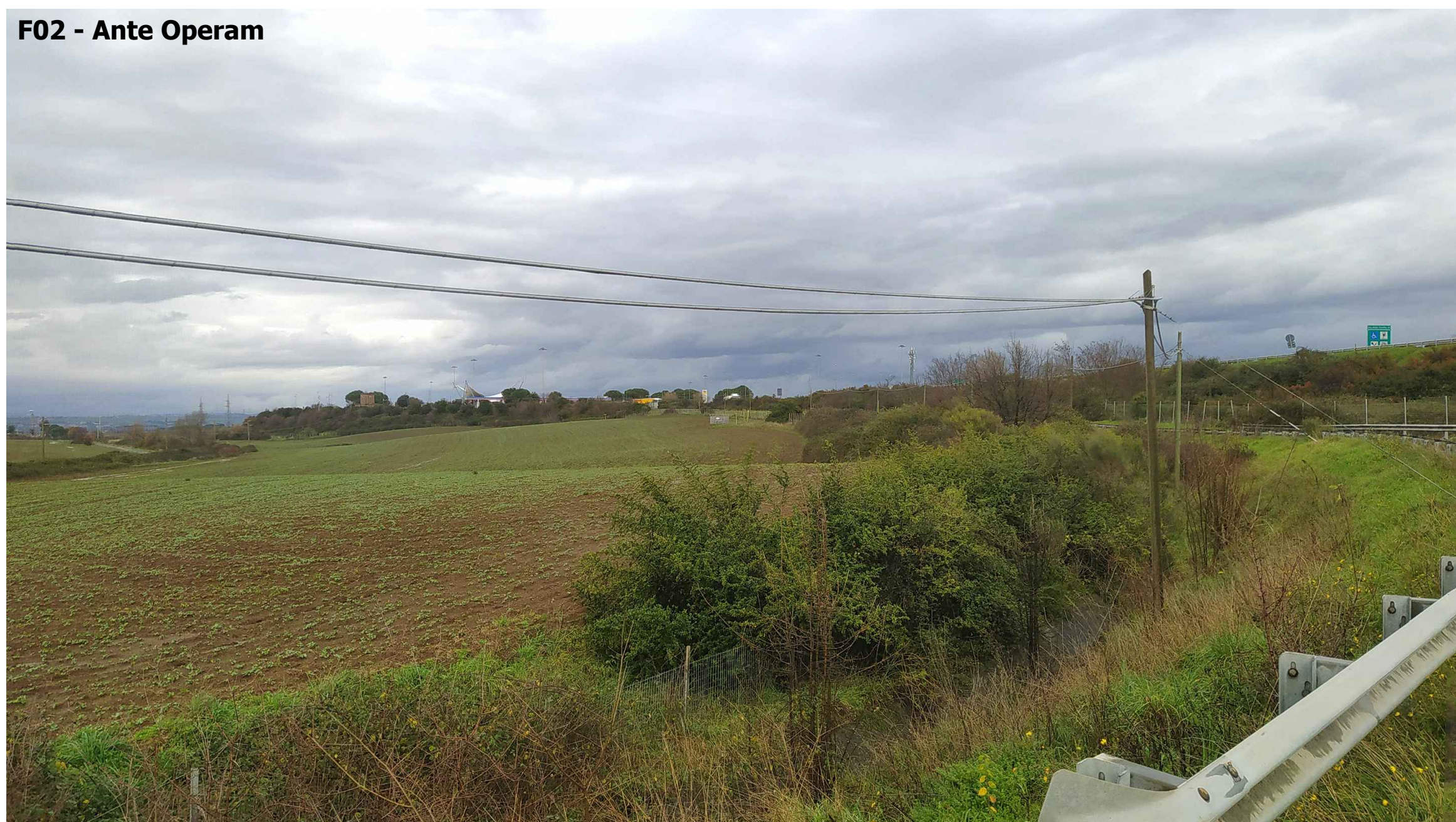
F02 - Ante Operam