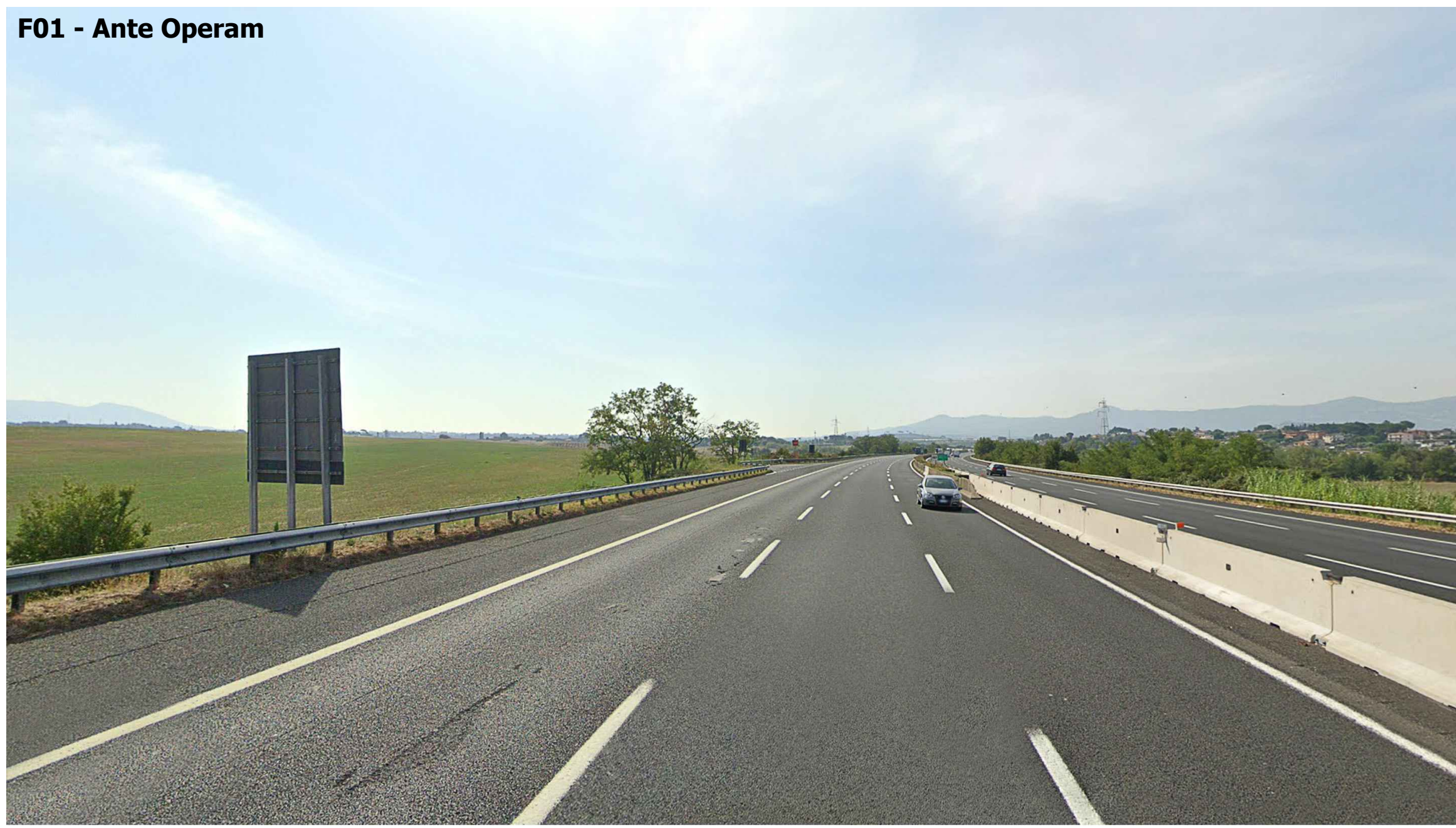
F01 - Ante Operam