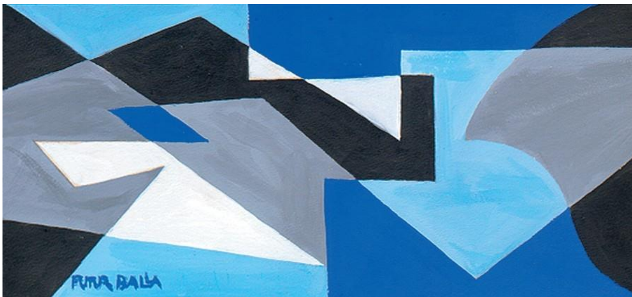
GIACOMO BALLA (1871-1958) LINEE DI FORZA 1925