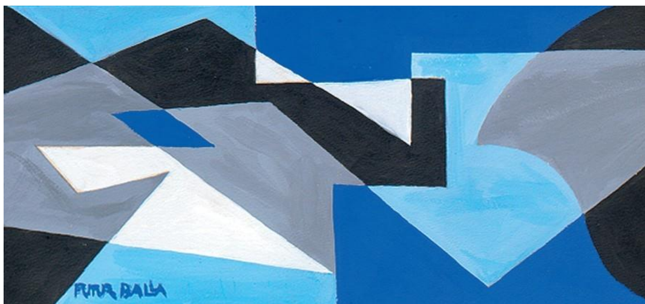
GIACOMO BALLA (1871-1958) LINEE DI FORZA 1925