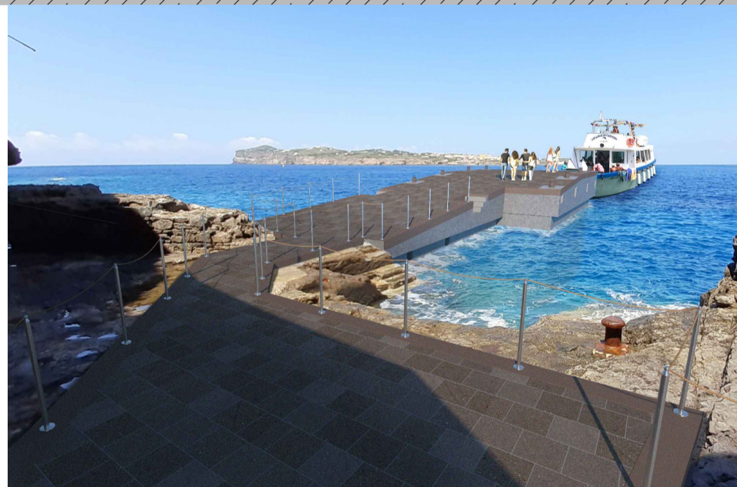
SCALO MARINELLA DA TERRA, vista post operam, simulazione attracco