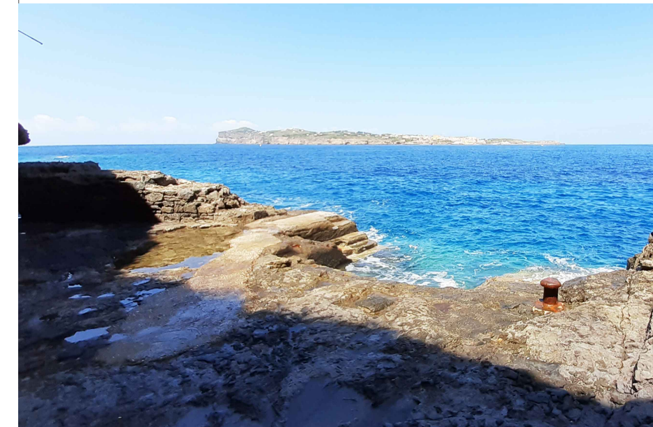
SCALO MARINELLA DA TERRA, vista ante operam