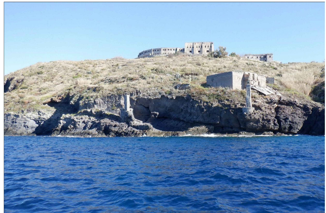
SCALO MARINELLA DA MARE, vista ante operam