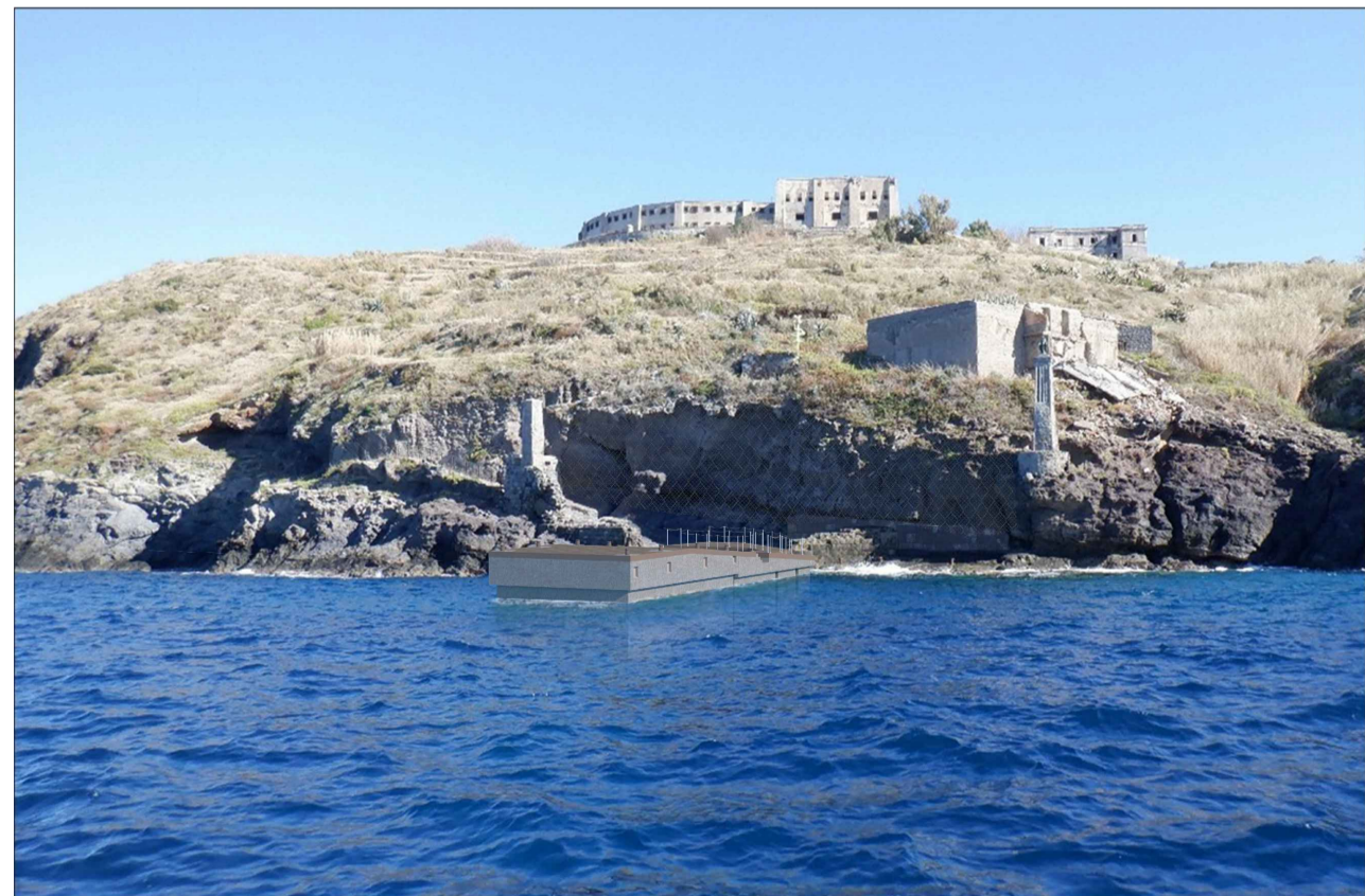
SCALO MARINELLA DA MARE, vista post operam