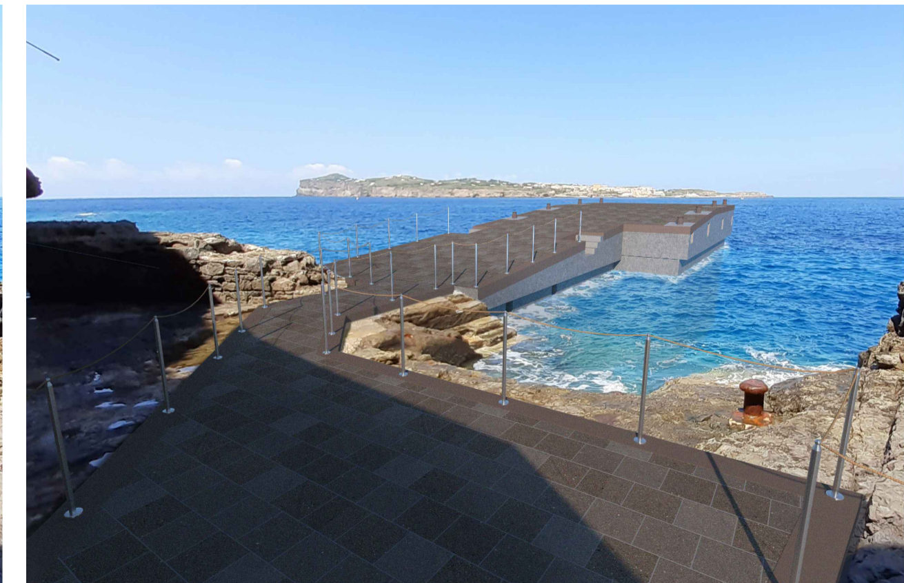
SCALO MARINELLA DA TERRA, vista post operam