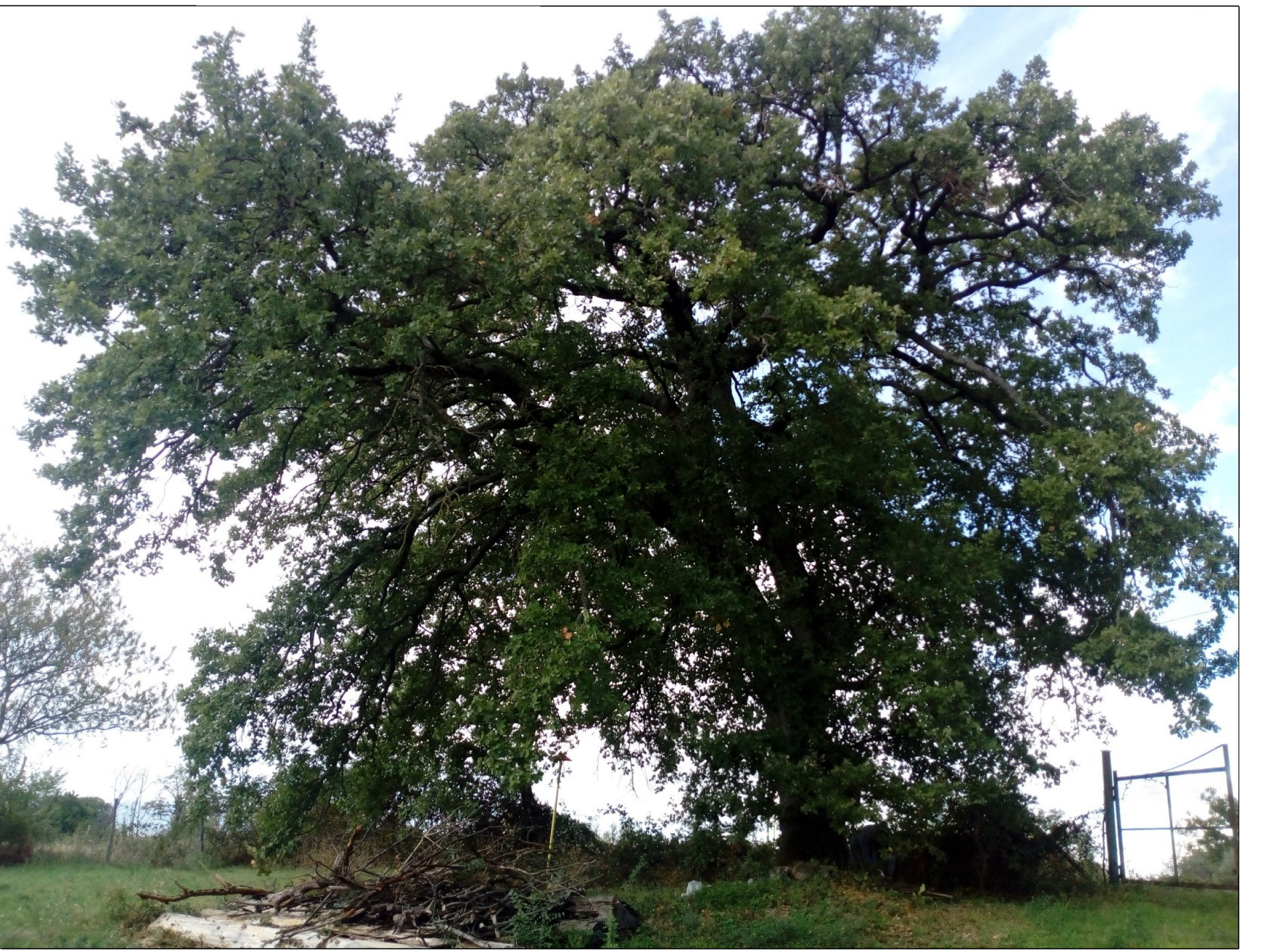
Fig. 2 - Quercus pubescens diametro 85 cm