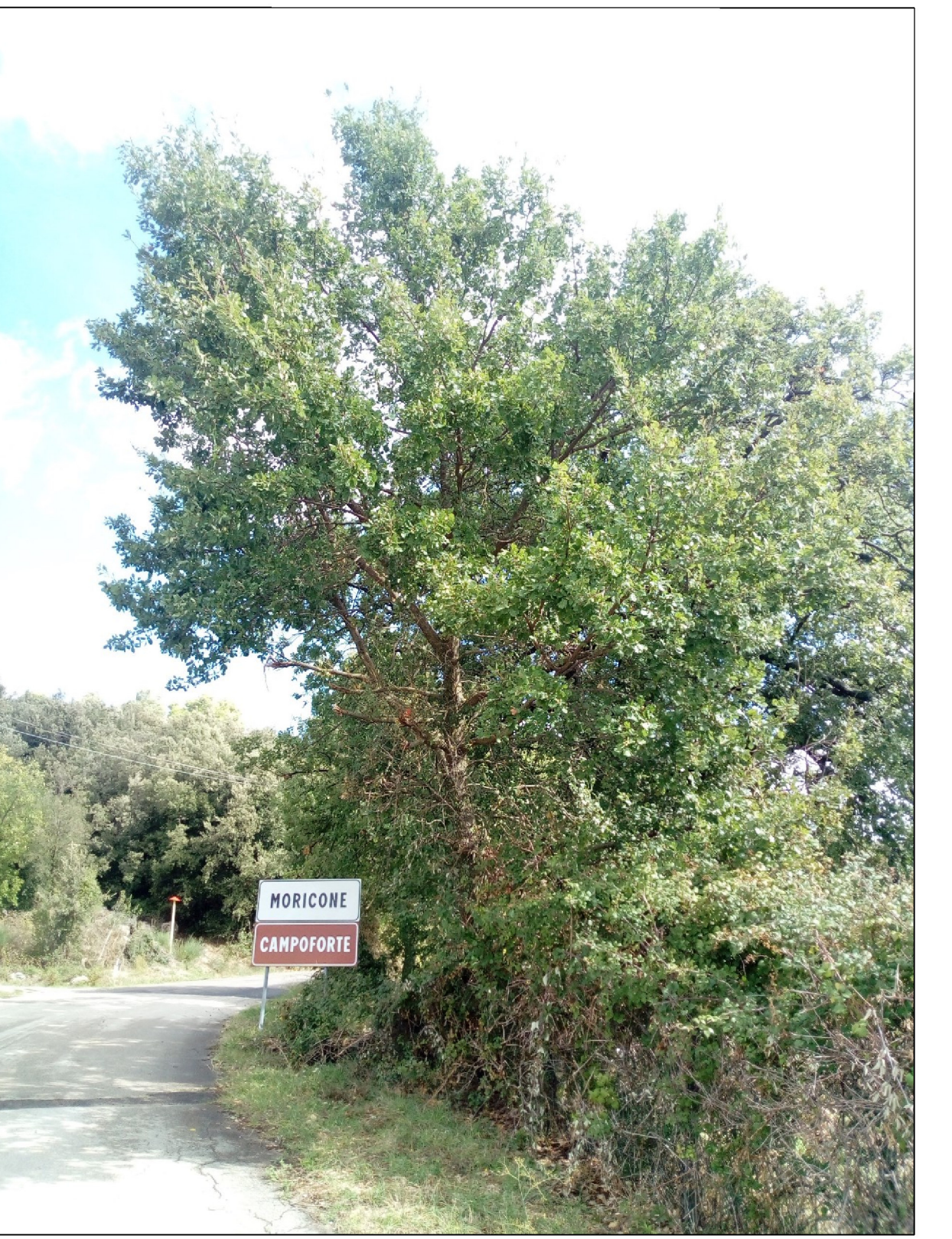
Fig. 3 - Quercus pubescens diametro 27 cm