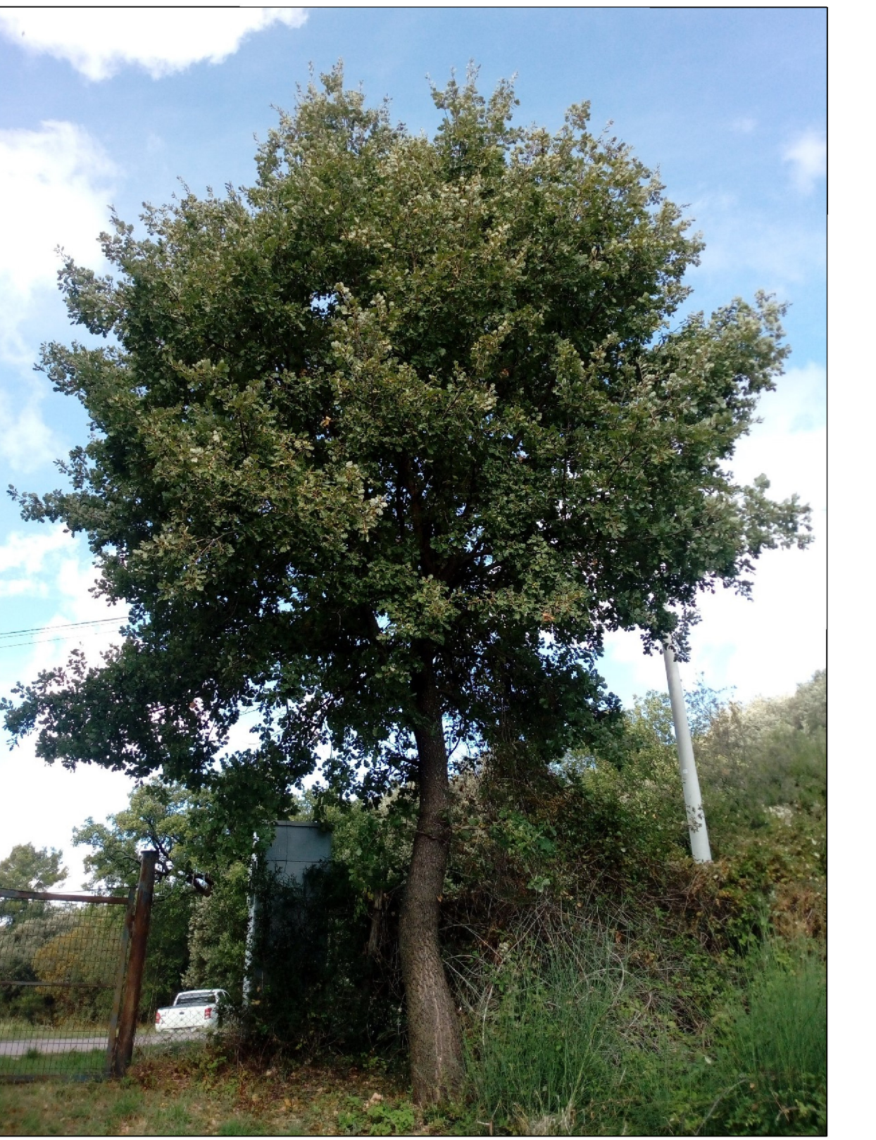
Fig. 1 - Quercus pubescens diametro 36,5 cm