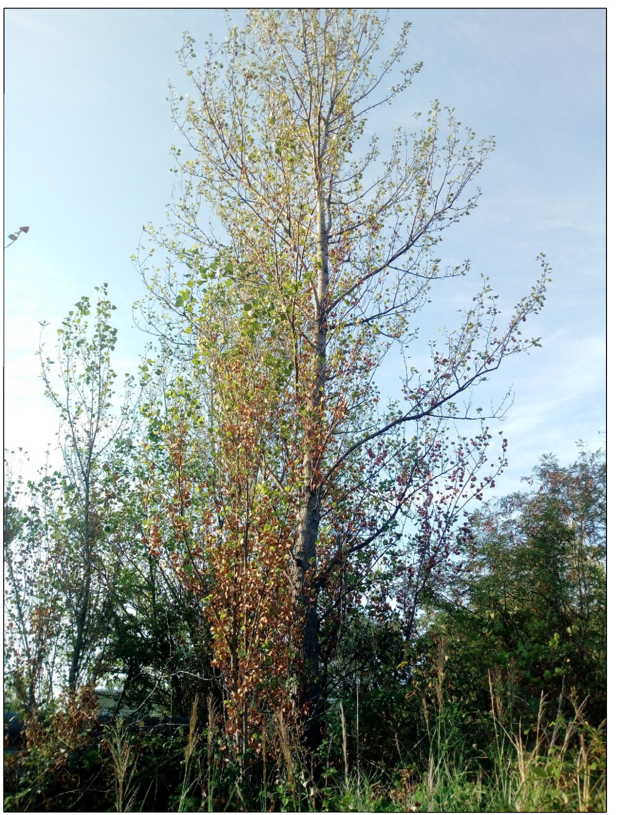
Fig. 17 - Populus nigra var. italica diametro 26m