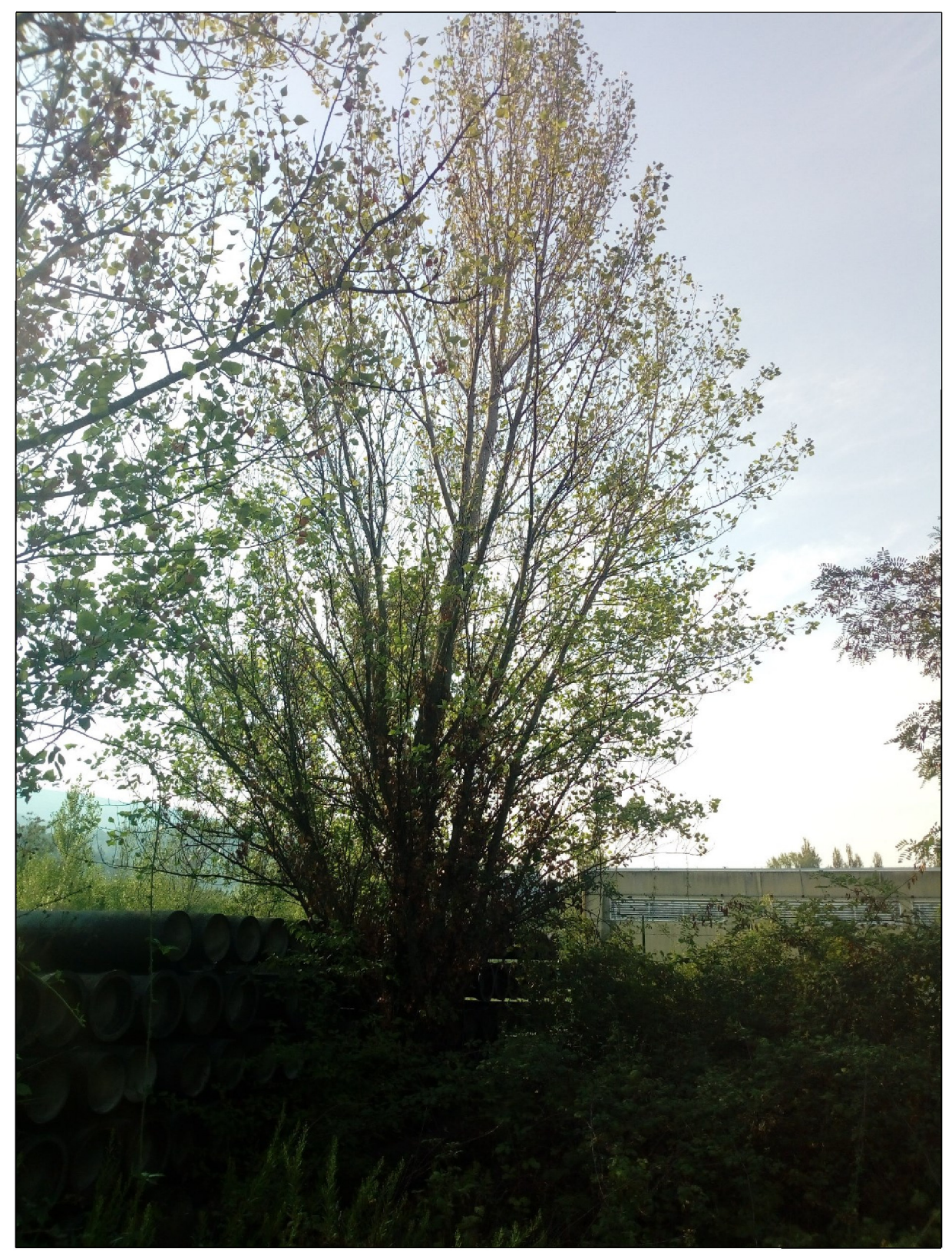
Fig. 16 - Populus nigra var. italica diametro 37 cm