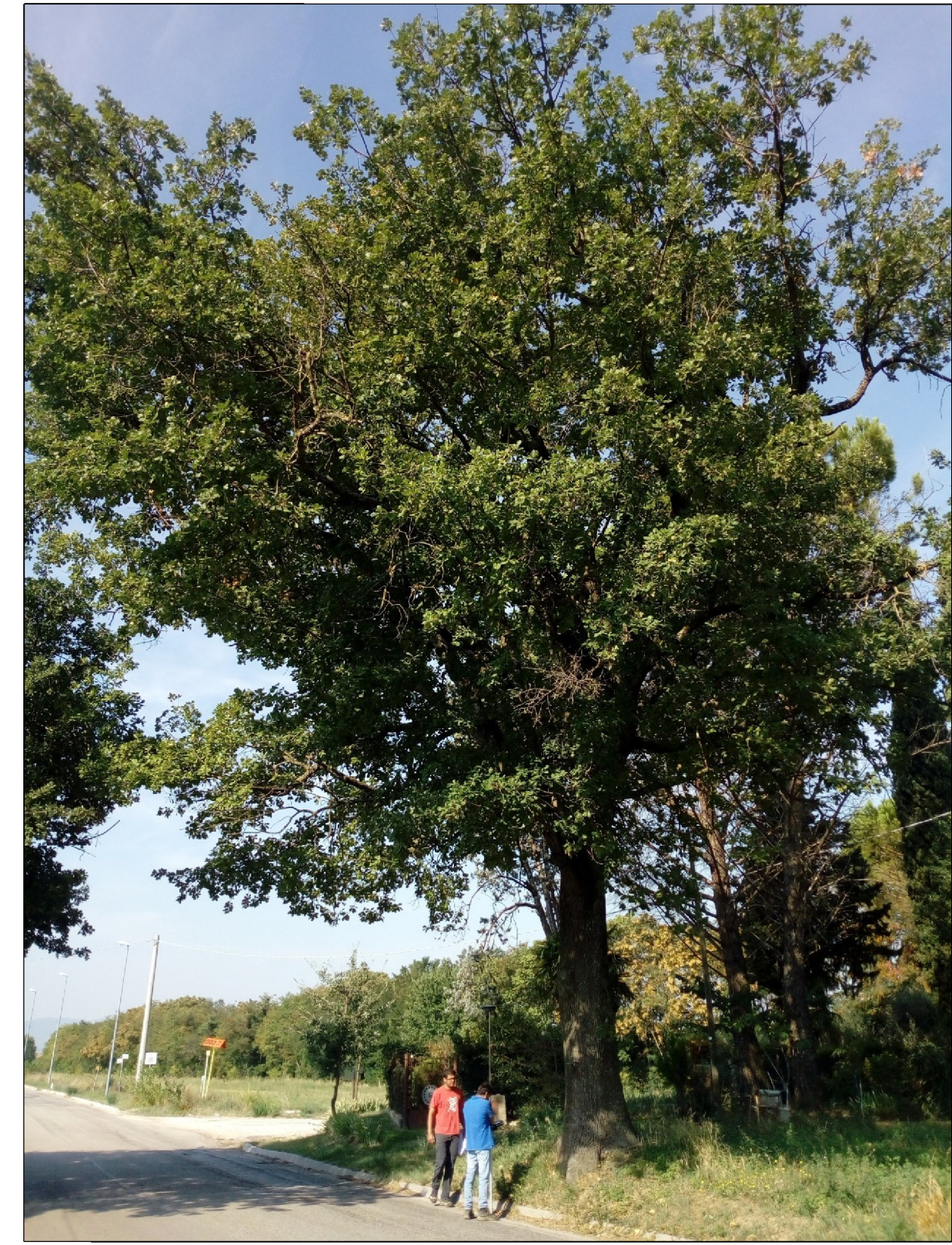
Fig. 18 - Quercus pubescens diametro 79 cm