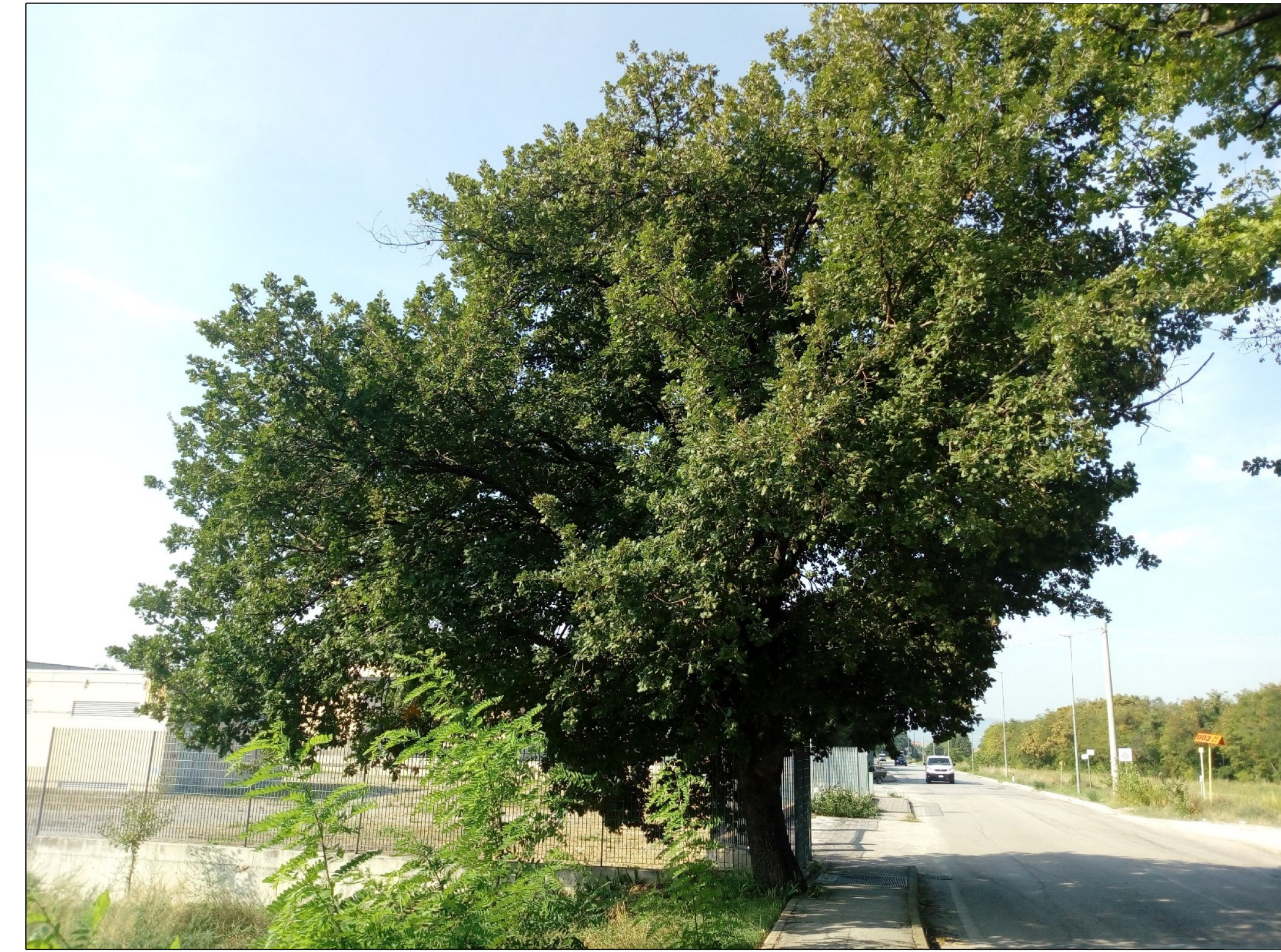
Fig. 19 - Quercus pubescens diametro 49 cm