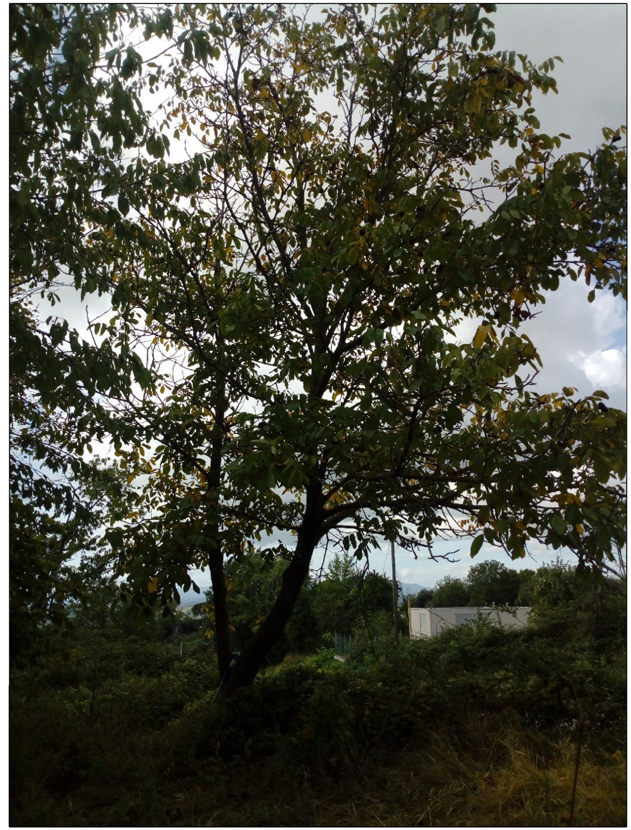
Fig. 9 - Juglans regia diametro 40 cm