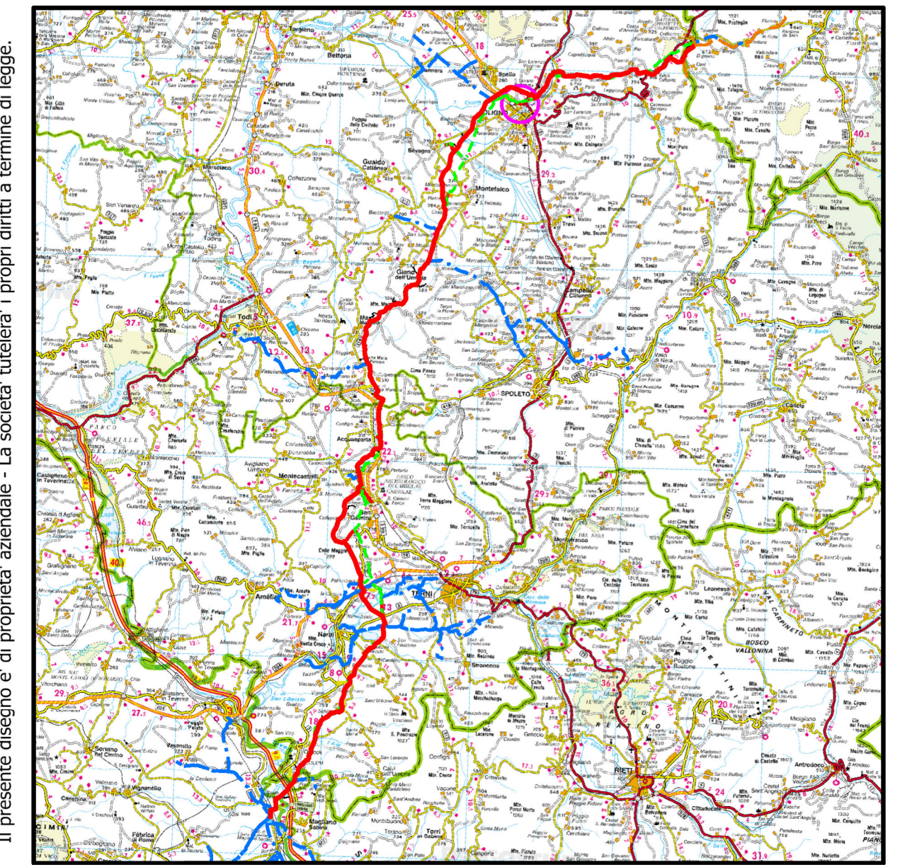
COROGRAFIA SCALA 1:500.000