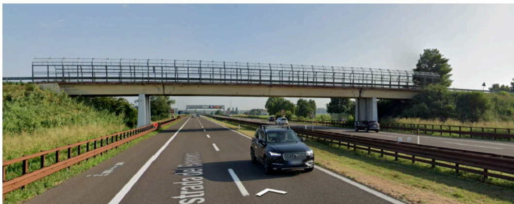
Fig. 2: Veduta del sovrappasso

Il sovrappasso attuale è del tipo a tre travi accostate con tre campate, di luce rispettivamente pari a circa 10 m., 36 m. e 10 m., appoggiate a due spalle a parete cava e due pile composte da tre pilastri, uno per trave. Per il nuovo sovrappasso è prevista la realizzazione di un impalcato a campata unica, con lunghezza complessiva pari a 50,10 m. e sezione stradale a doppio senso di marcia. Tra il piano viabile ed i marciapiedi verrà montata una barriera di sicurezza di classe di contenimento H3, mentre in corrispondenza dei bordi laterali del sovrappasso è prevista l'installazione di pannelli di protezione in polimetilmetacrilato (PMMA). La larghezza del sovrappasso progettato è stata definita in funzione dell'arteria stradale che il medesimo è chiamato a servire tenendo conto anche delle esigenze legate al transito di pedoni e/o ciclisti. In particolare, la larghezza attuale della sezione stradale è di 0,75+6,00+0,75 m, mentre quella di progetto è di 2,30+7,00+2,30 m. Le nuove rampe di accesso al sovrappasso si svilupperanno quasi interamente su rilevati stradali esistenti.