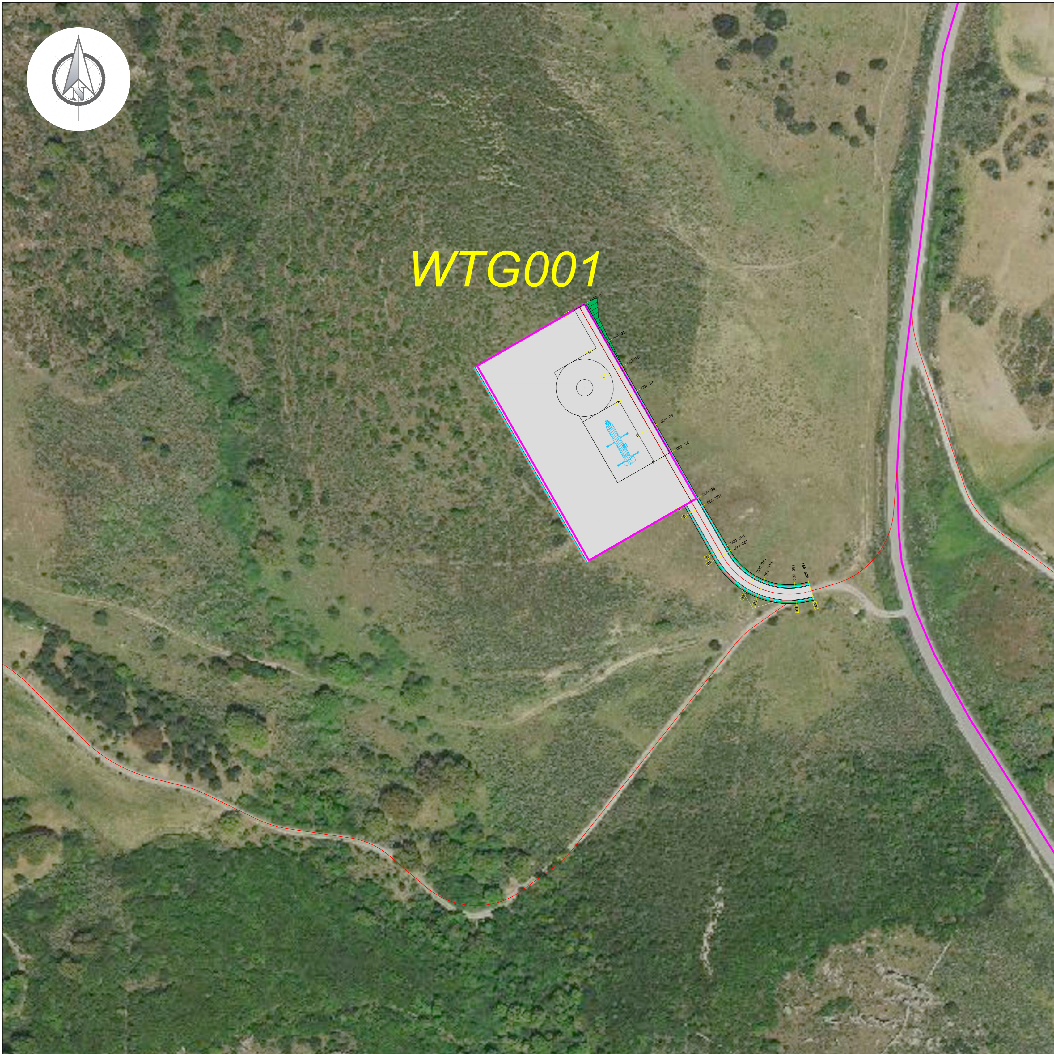
PLANIMETRIA VIABILITA' DI SERVIZIO AEROGENERATORE E RELATIVA PIAZZOLA Scala 1:1'000