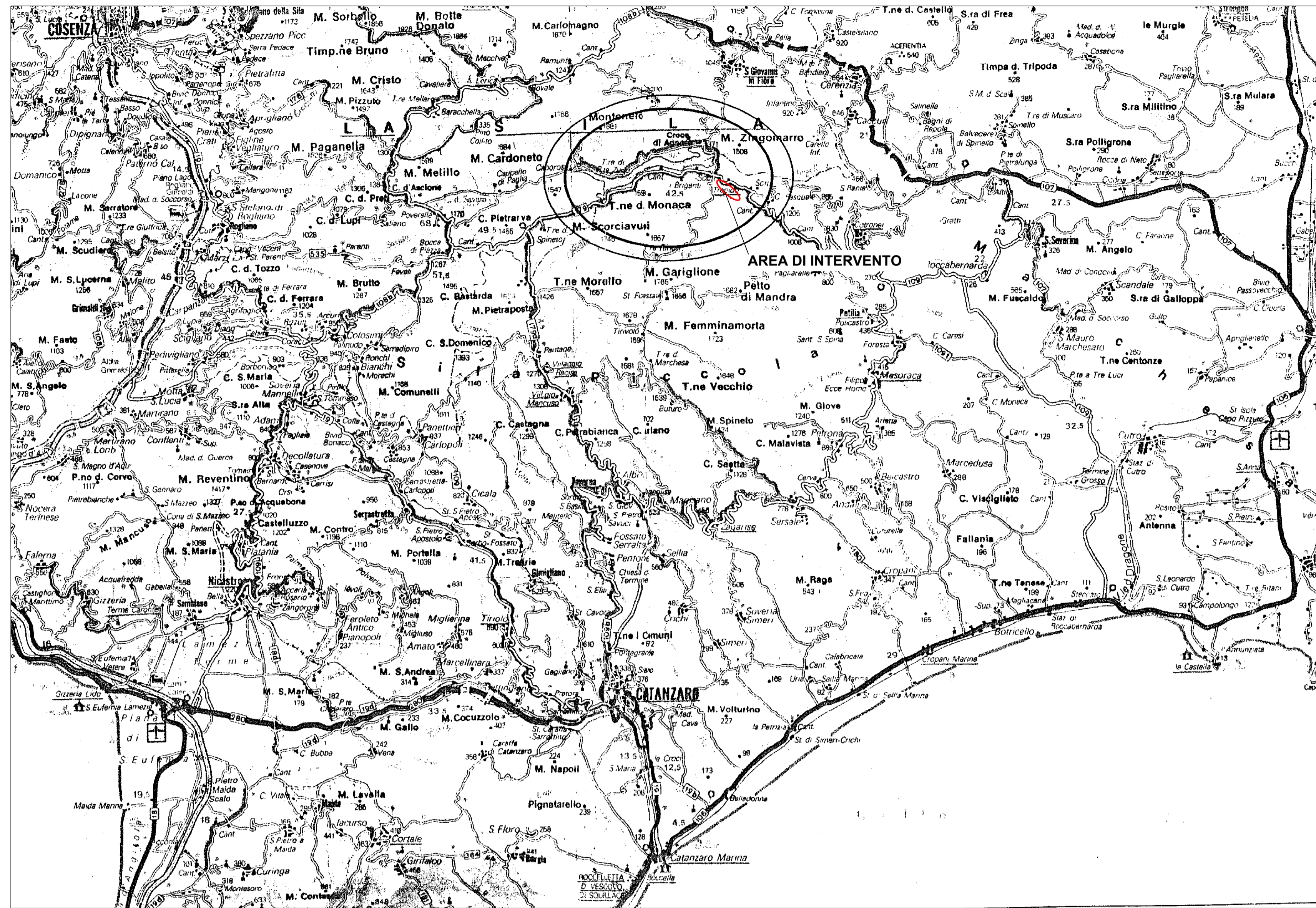
ANNO 2012