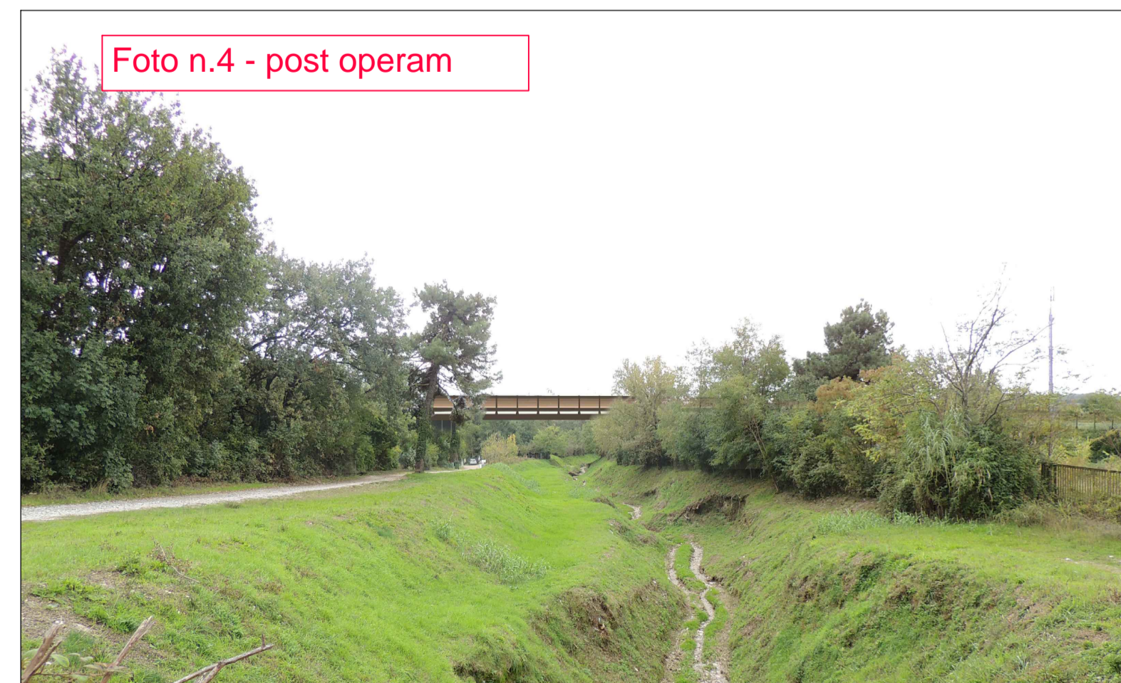
Foto n.4 - post operam