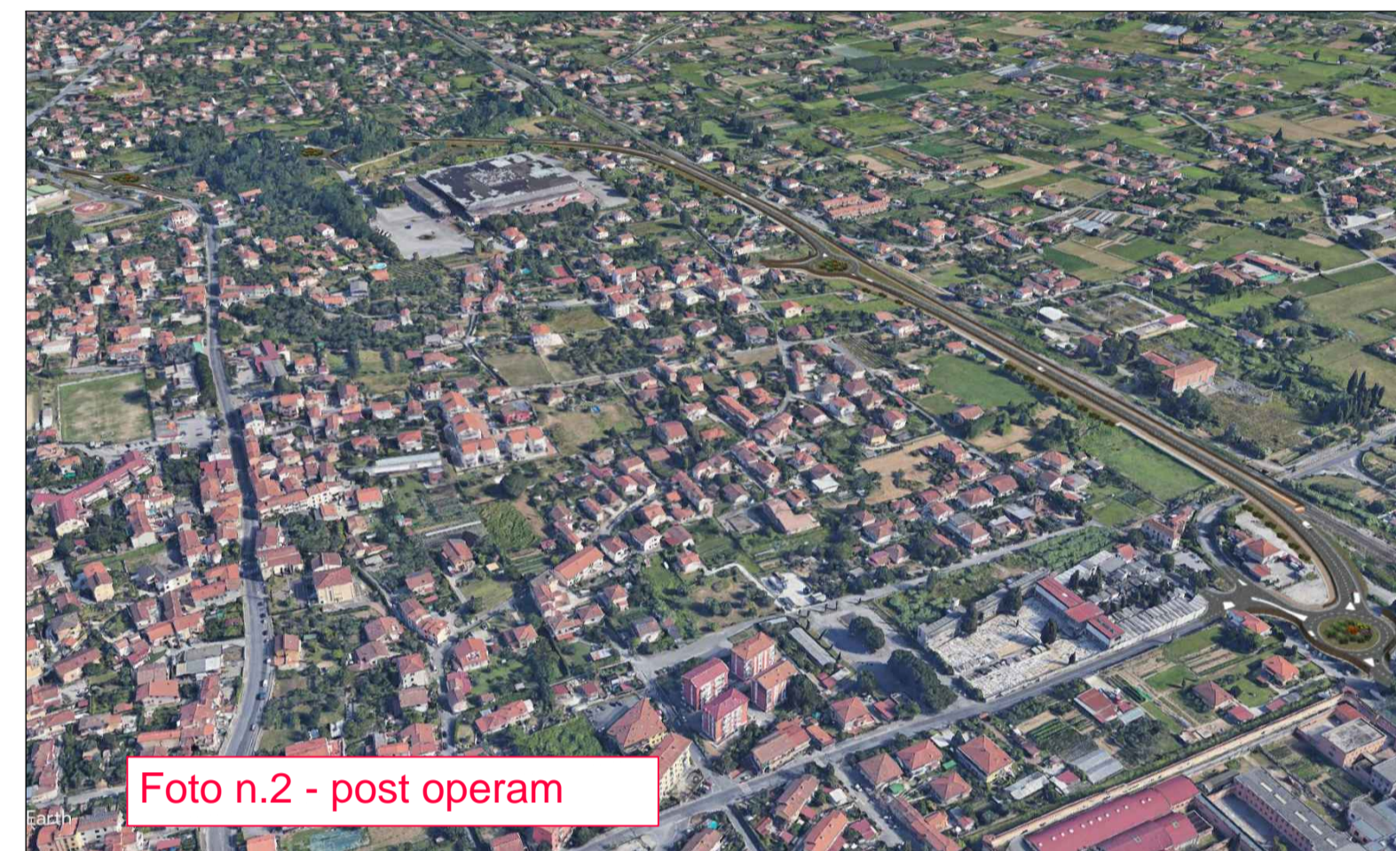
Foto n.2 - post operam