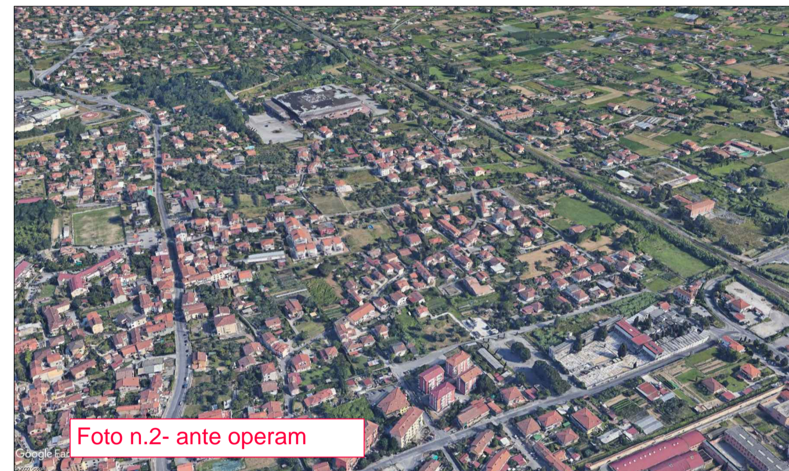
Foto n.2 - ante operam