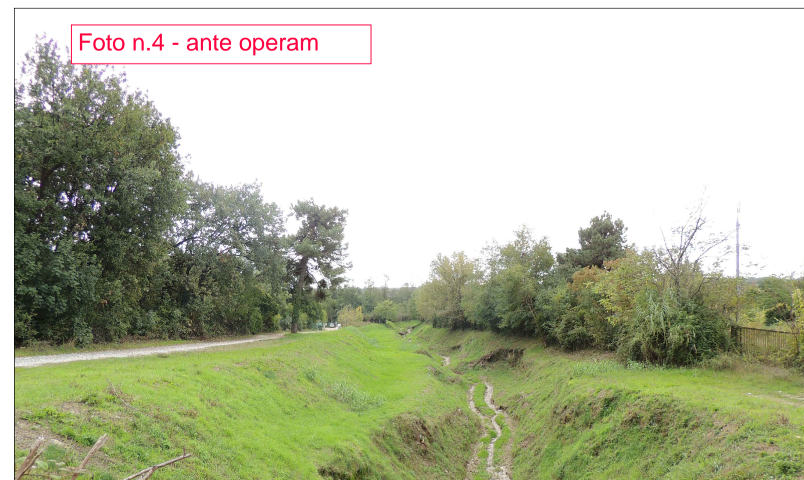
Foto n.4 - ante operam