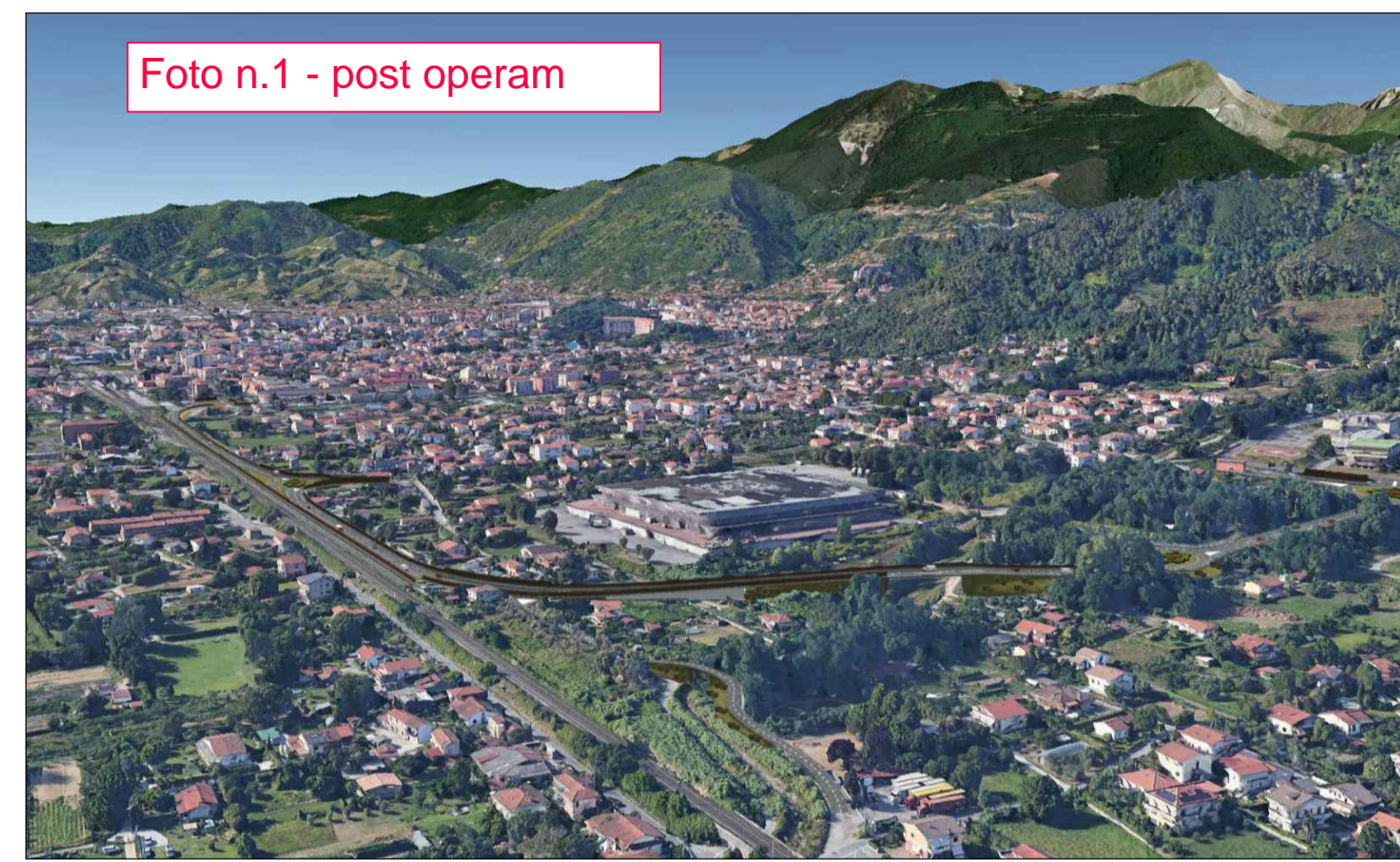
Foto n.1 - post operam