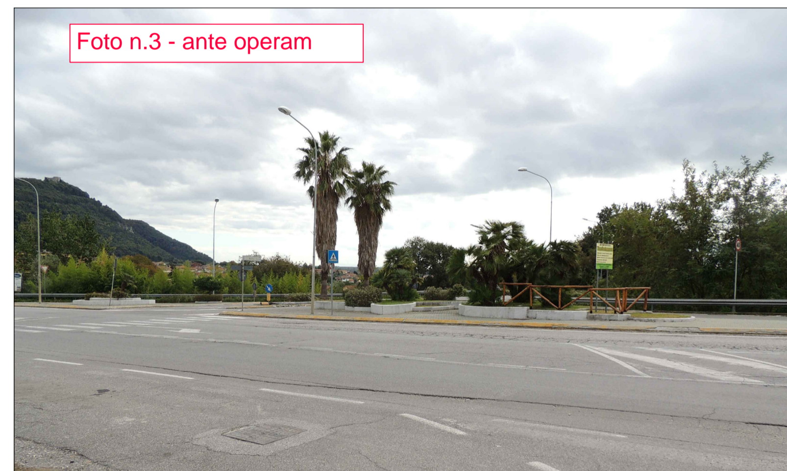
Foto n.3 - ante operam