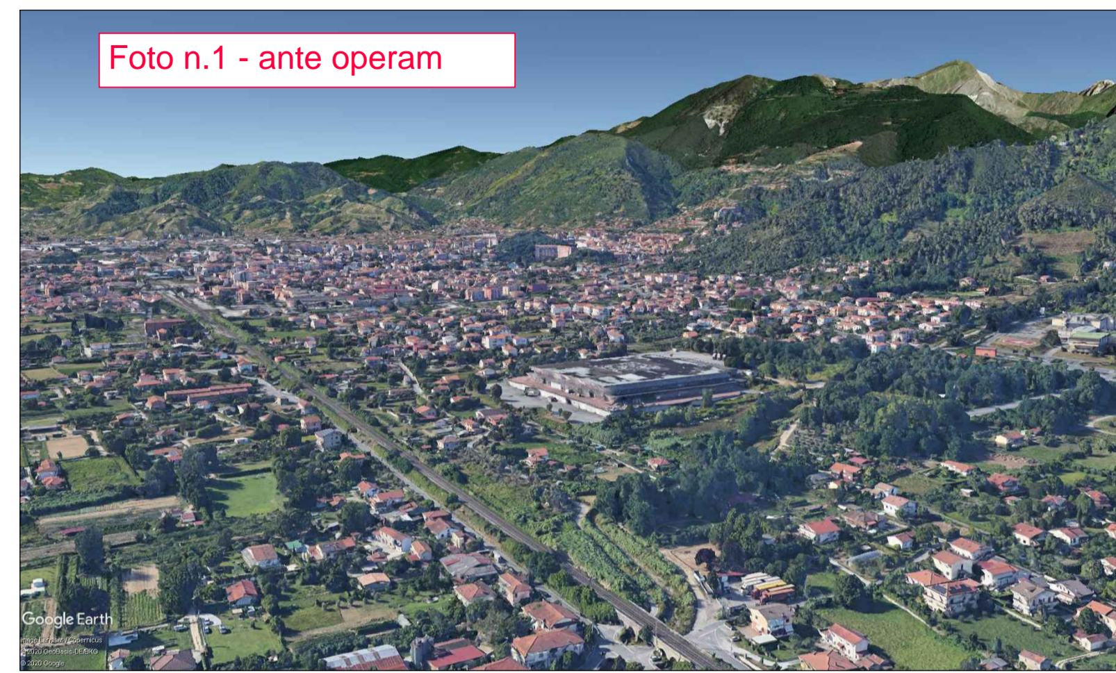
Foto n.1 - ante operam