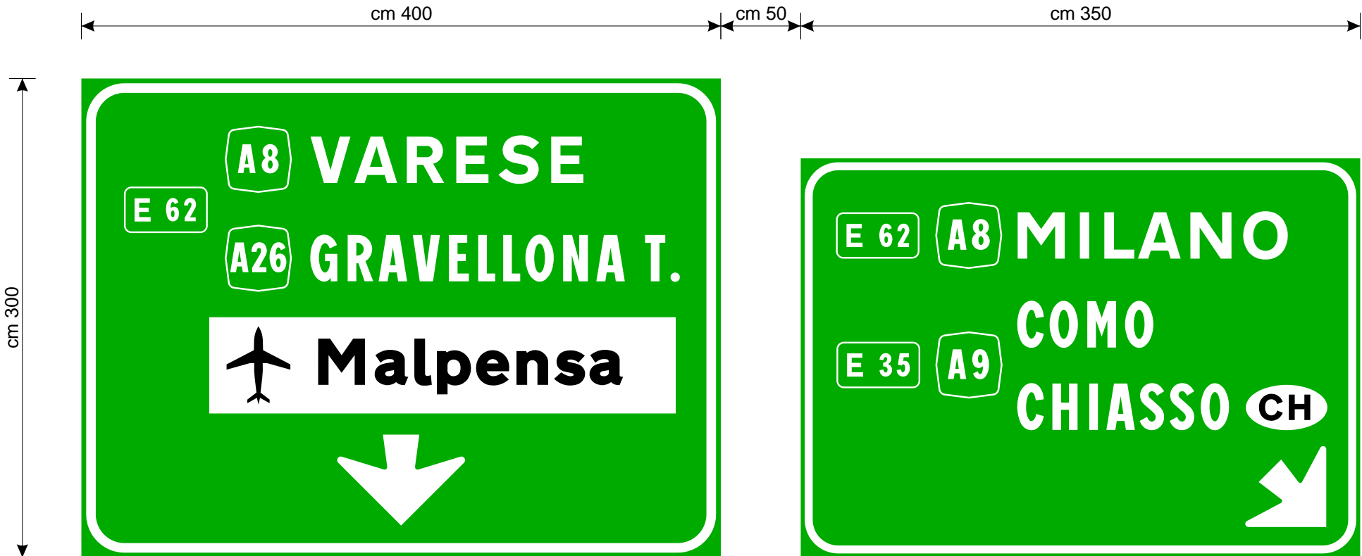
Targa in A25/10 con attacchi per barre di irrigidimento Pellicola fondo verde in pellicola classe 2, scritte, frecce e bordi bianchi in pellicola classe 2